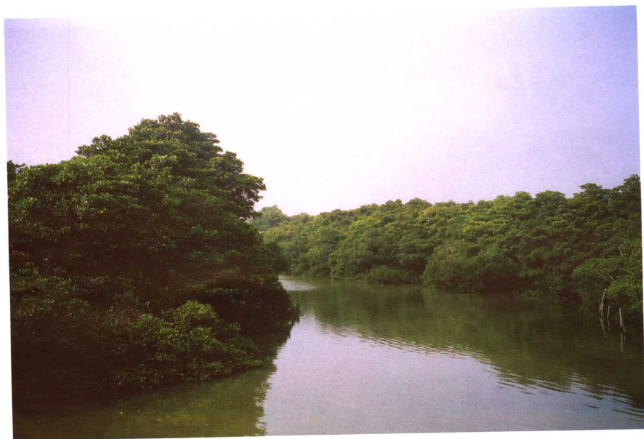
位于海口市的东寨港红树林，是中国建立的第一个红树林保护区，亦是世界湿地组织在中国建立的第一个湿地保护区。