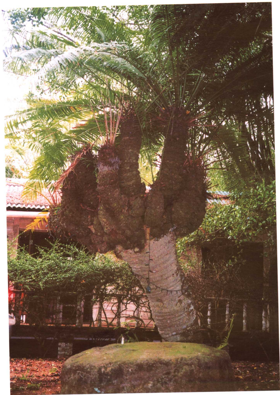
在海南，人们可以见到数百年高龄的苏铁树身影。