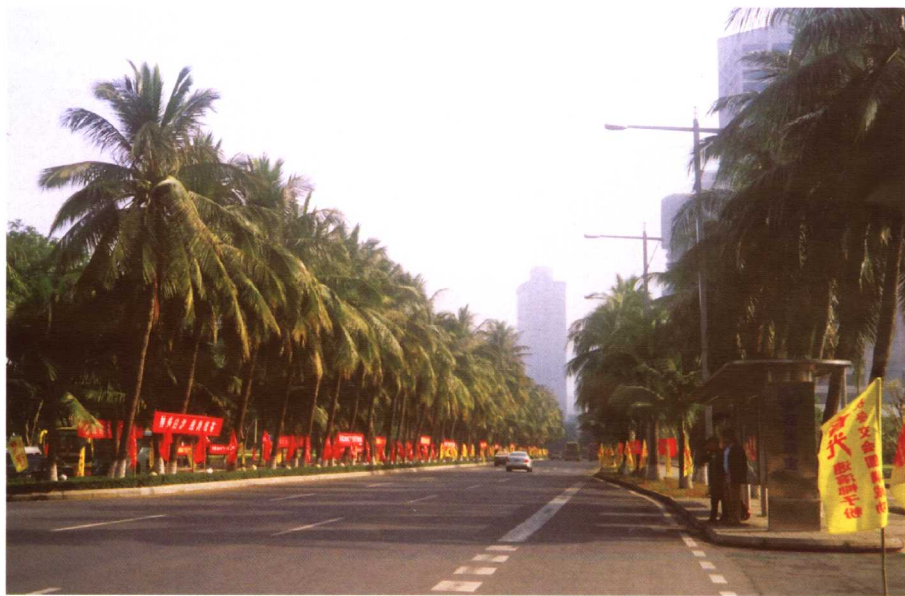
椰城海口市的椰树林。