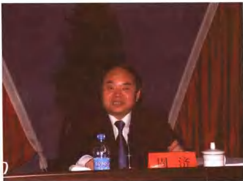
教育部部长周济出席 2005 年度职业教育系列专题会议并就相关问题做重要讲话