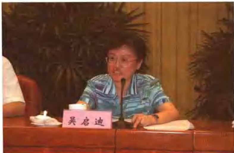
教育部副部长吴启迪主持 2005 年度职业教育系列专题会议并就相关问题做重要讲话