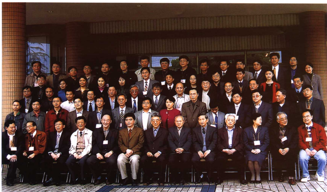
第二届马克思哲学论坛全体会议代表合影