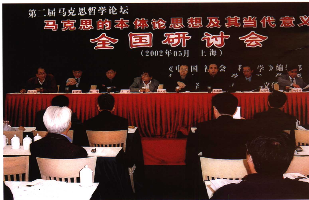
第二届马克思哲学论坛大会发言