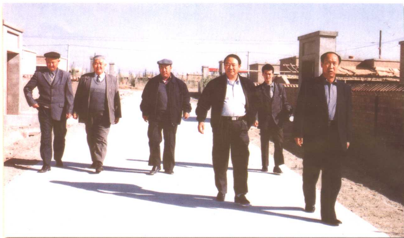
2003年5月，原兵团副司令员伯塔依·库平（后排左二）视察红星二牧场