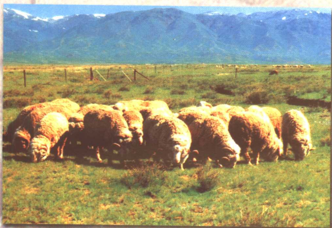
夏季围栏草场中的绵羊群