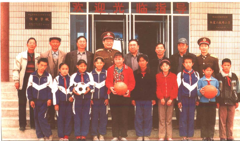
农十三师武装部资助牧场的10名贫困学生