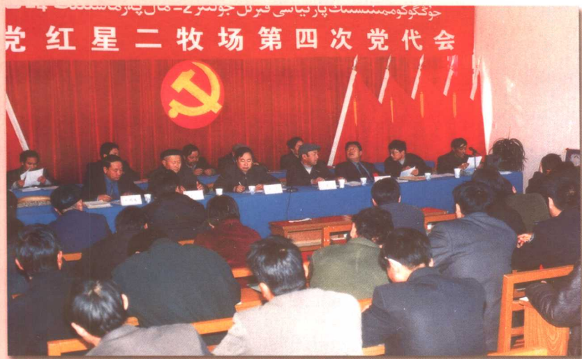
中共红星二牧场党代会