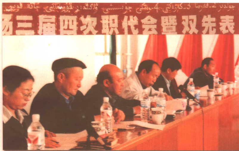
红星二牧场职代会