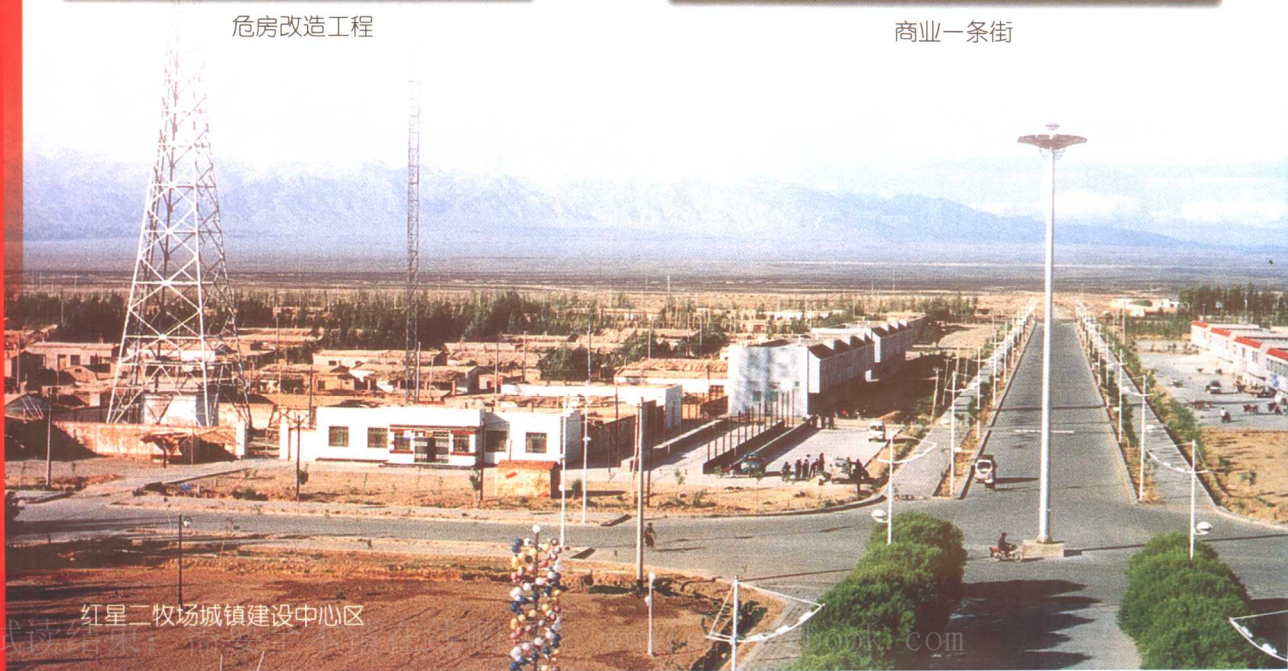
红星二牧场城镇建设中心区