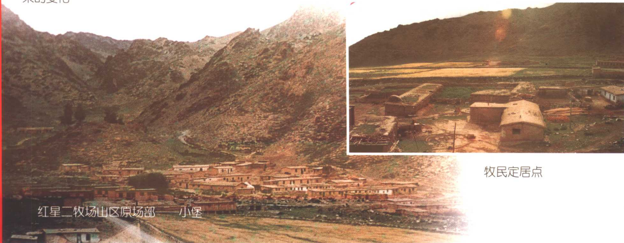
红星二牧场山区原场部——小堡