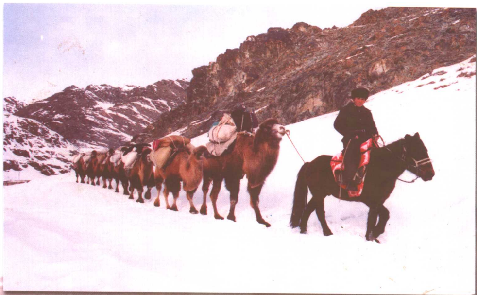
驼队运送物资救助受灾的羊群