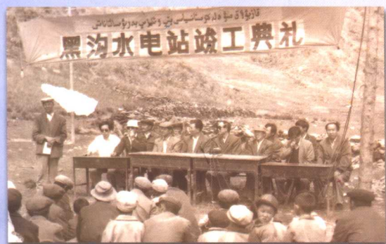
山区牧民结束了煤油灯的历史