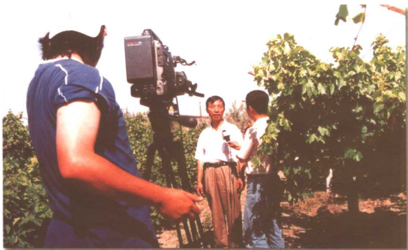
中央电视台第七套节目记者采访红星二牧场近年来的变化