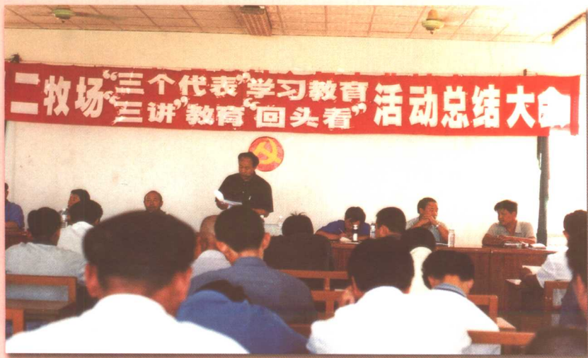
红星二牧场“三个代表”学习和“三讲”教育活动总结大会