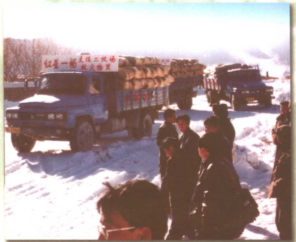
牧场受灾，八方支援