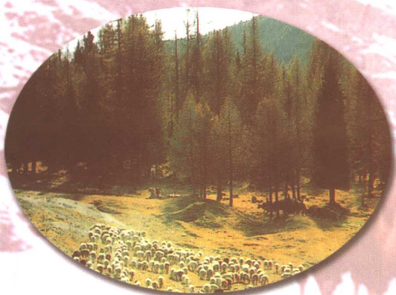
春季羊群转场上山