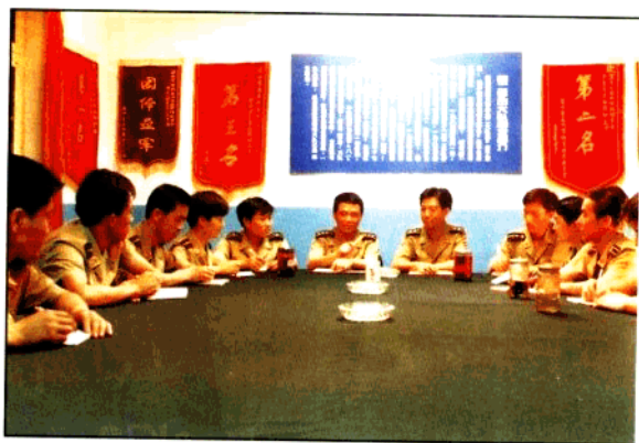
二大队领导坚持每月进行一次学员思想情况分析▶