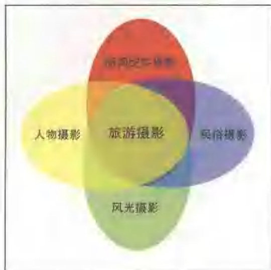
■ 图 1-7

旅游摄影的拍摄方式和表现形式多样,既有在游览过程中及时捕捉住转瞬而过的有趣瞬间的抓拍,也有经过精心摆布,