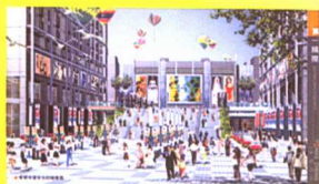
东莞大道主入口效果图