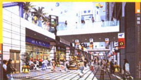
商业步行街效果图 (局部)