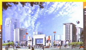
商务公寓沿街效果图