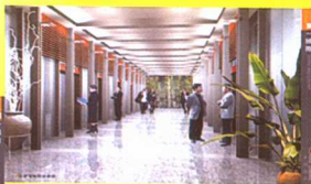
公寓电梯间效果图