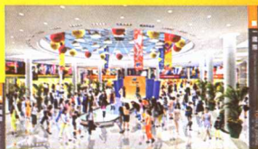
商场时装舞台效果图

方米,其中商业主要集中在16层。规划中的东莞市商业中心业态之丰富,业种之繁多在东莞业界来说已属首创。第一国际涵括超市、百货、餐饮、娱乐等多种业态,有效弥补了东莞城镇割据、产业发达、商业分散的城市功能现状。在整合城市商业资源上,起到了名副其实“东莞市商业中心”的作用。首期宽达11米,长达540米的二层商业步行街,高达38层的国际大酒店,成为众多国际品牌商家争夺的战略要地,更是中小投资者哄抢的投资宝地。随着东莞城市中心的迅速形成,庞大的人流向中心区的迅速汇集,2004,东莞聚焦中心区,商业聚焦第一国际已经成为业内外不容争辩的事实。