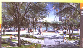
二层园林广场局部效果图