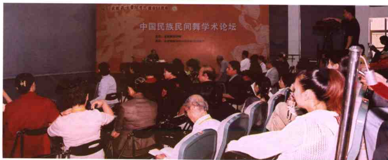
王国宾院长与论坛代表合影