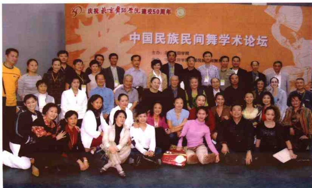
论坛代表集体合影