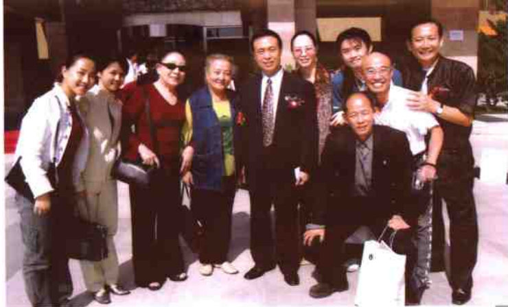
王国宾院长与论坛代表合影