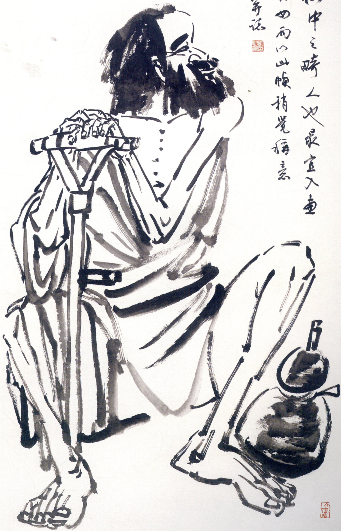
铁拐李 136 × 68cm 2005年