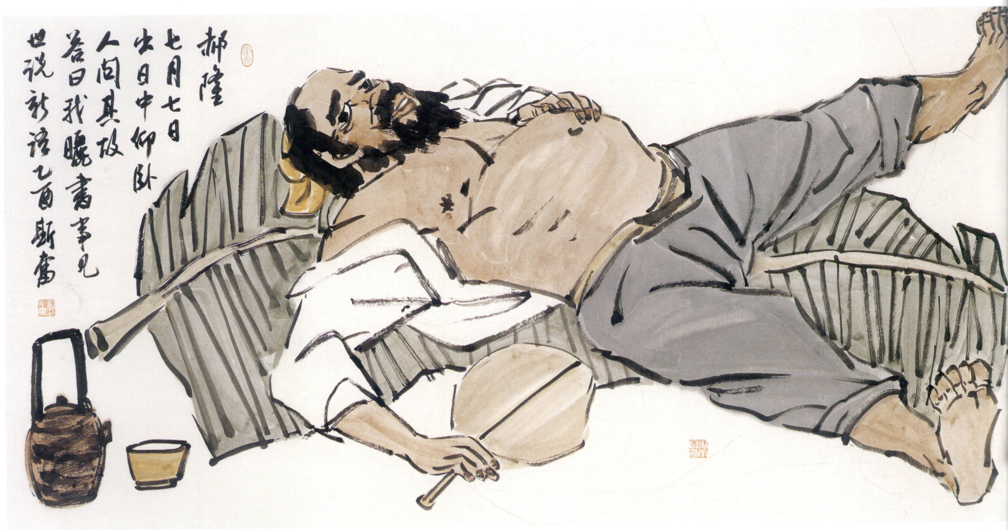
晒书图 68 × 136cm 2005年