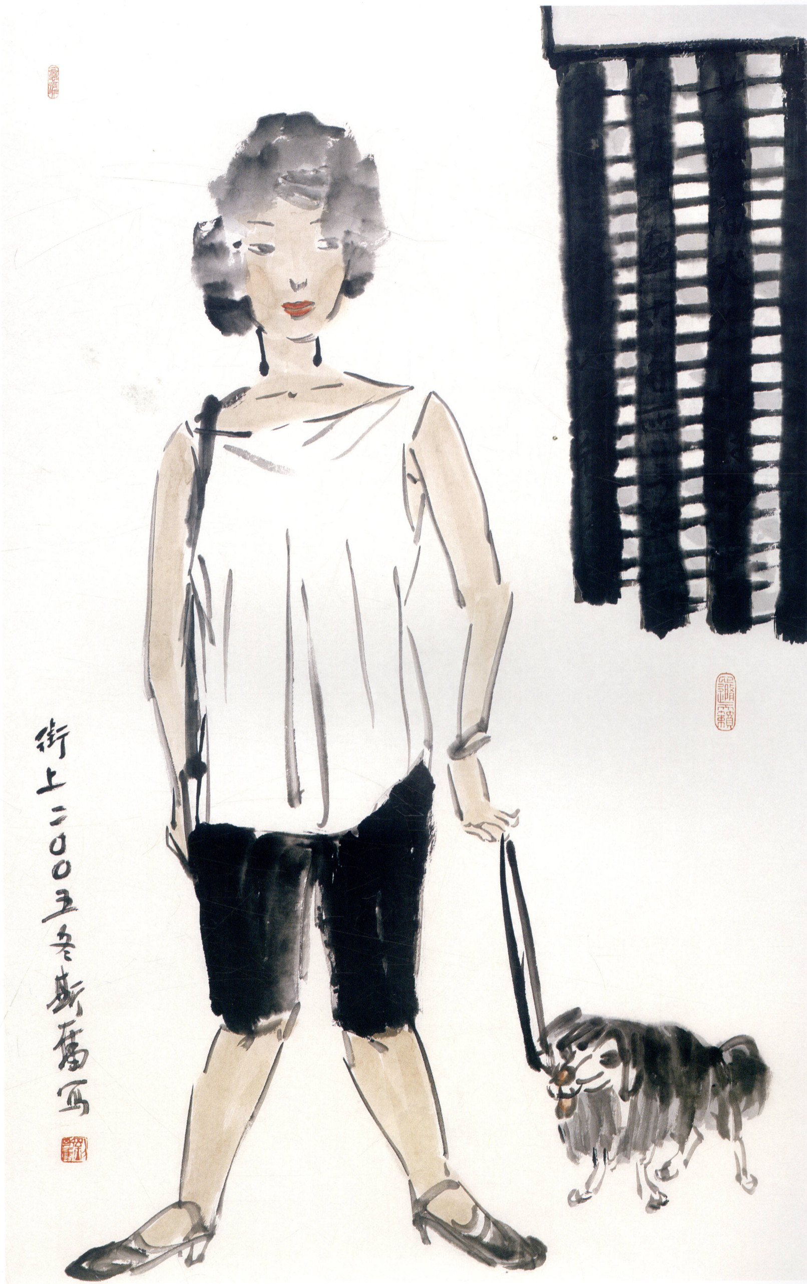
街上 95 × 60cm 2005年