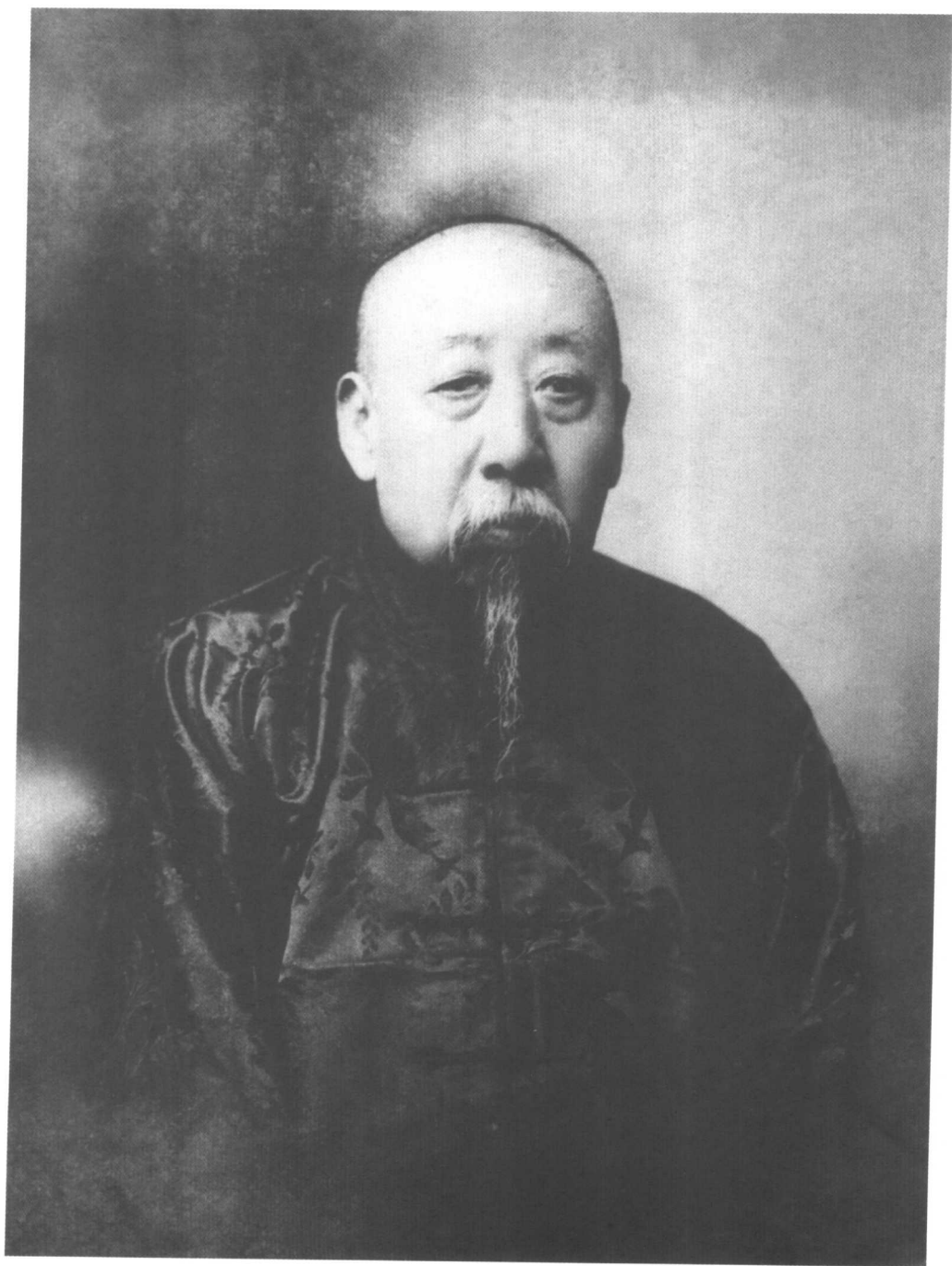
老年时那桐便装照