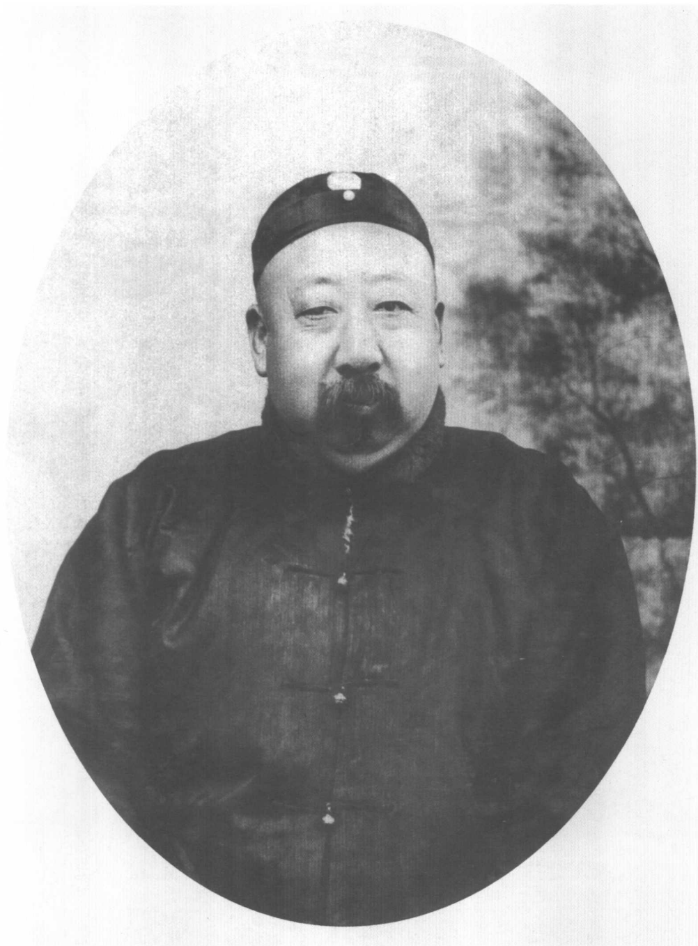
中年时那桐便装照