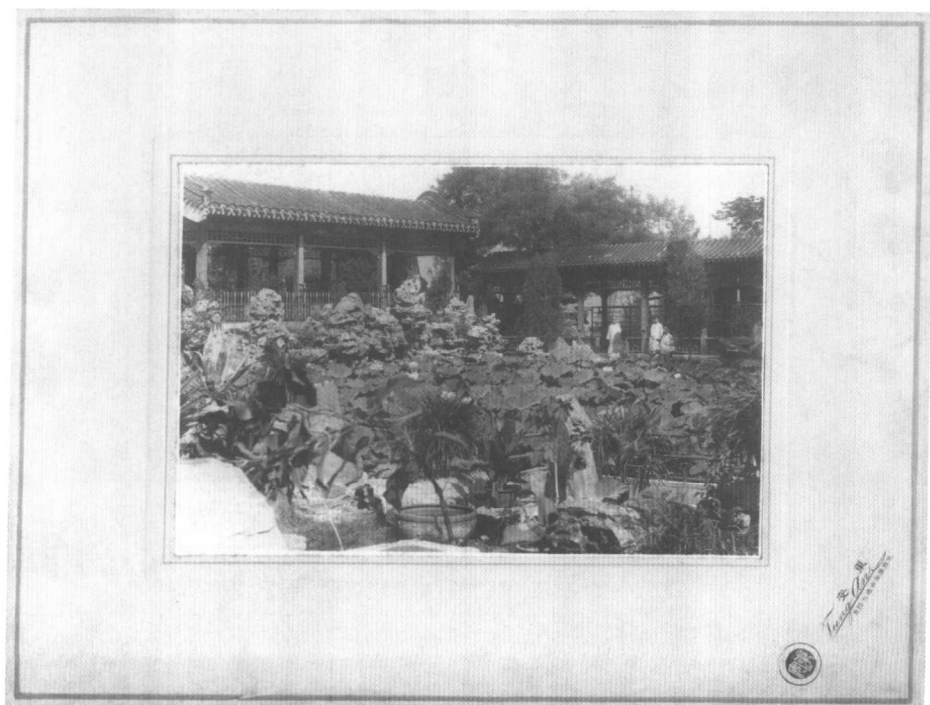
夏季“澄清榭”前池塘中的荷花