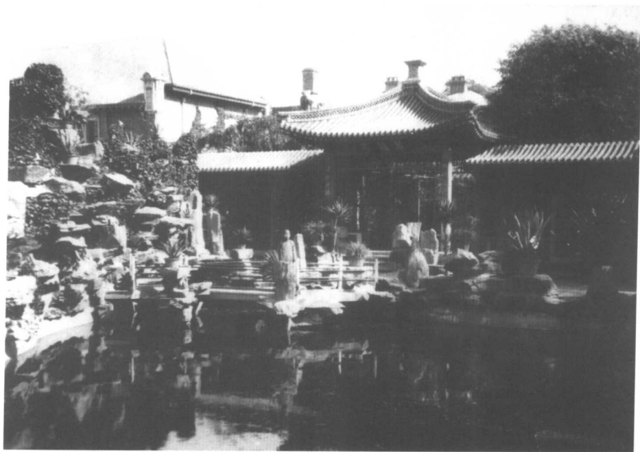
花园中“翠簌亭”前的池塘和小桥