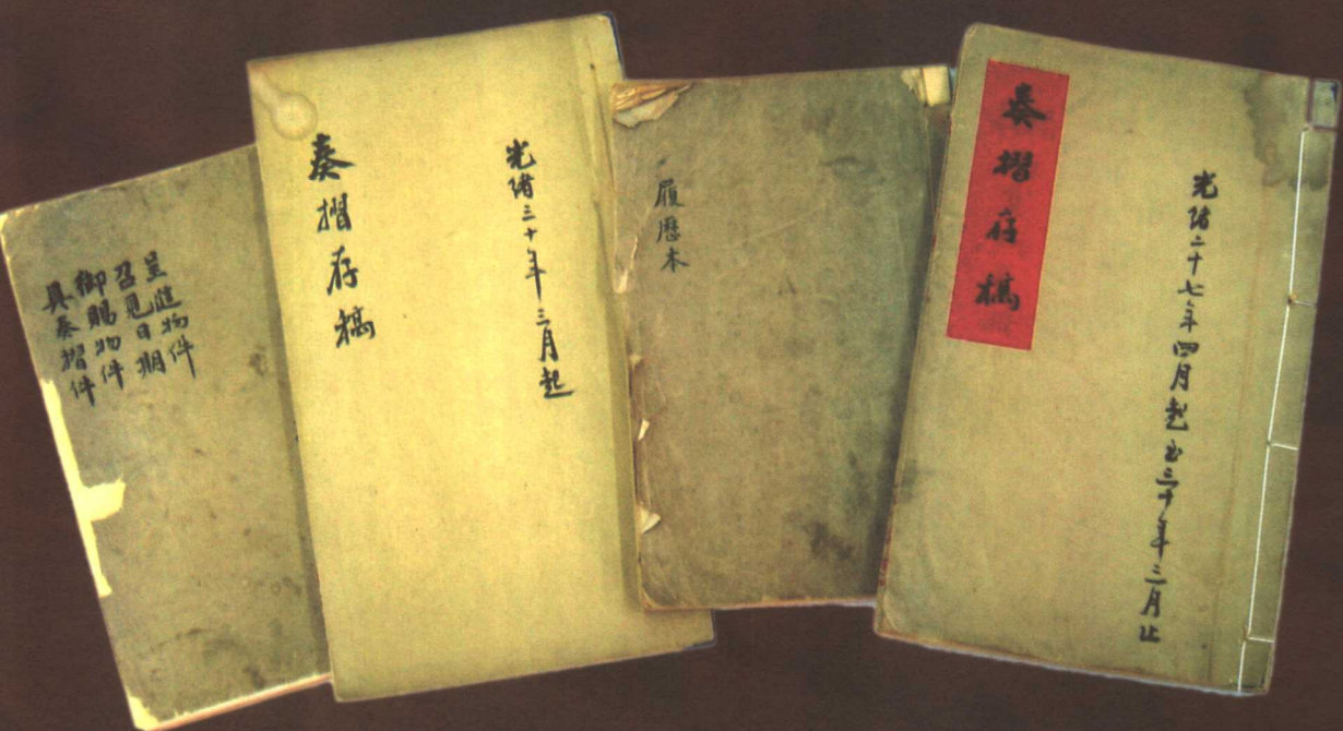
那桐亲书履历及奏折存稿等