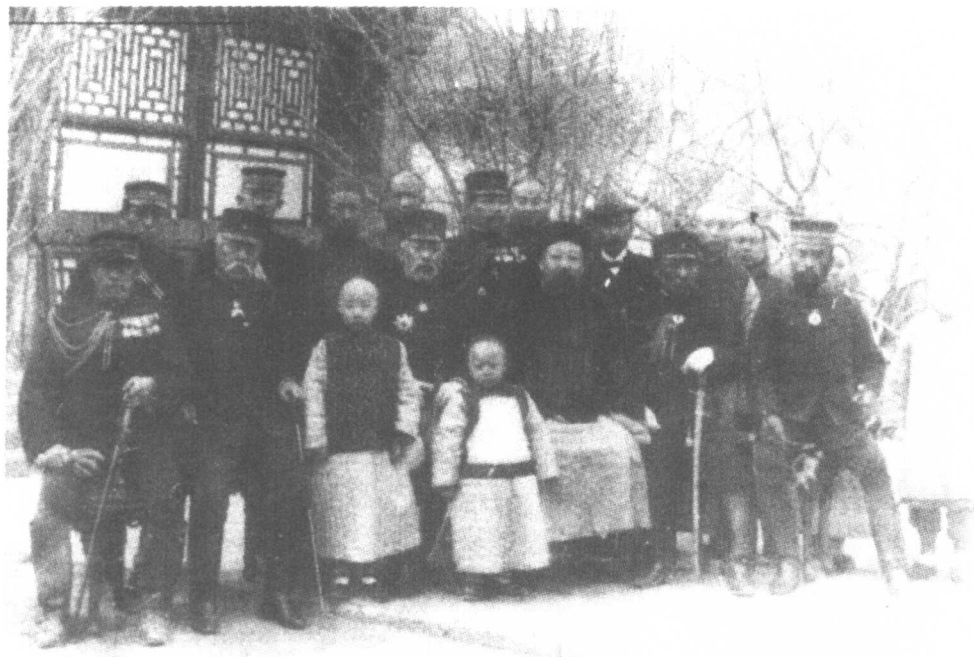
庚子后那桐与日本官的合影