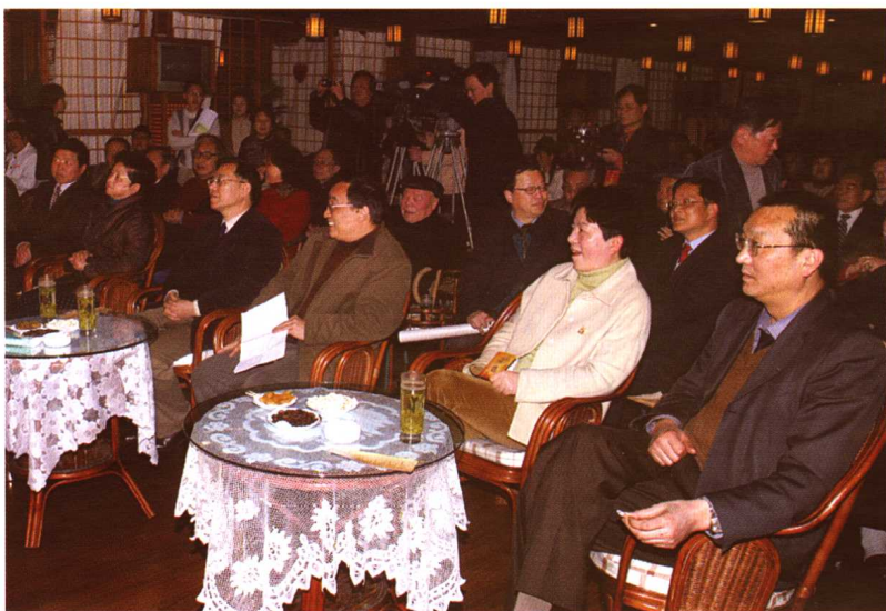
宁波市委宣传部、文联、文化局等领导观看曲艺演唱