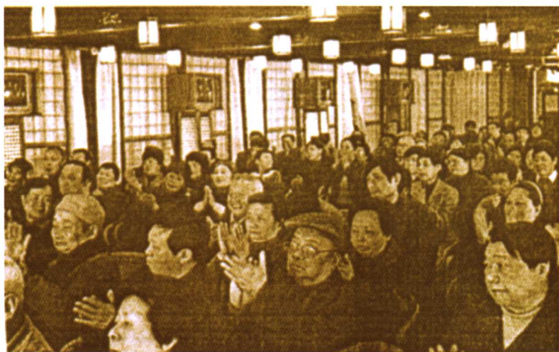
掌声阵阵,印证着民间曲艺独特的魅力