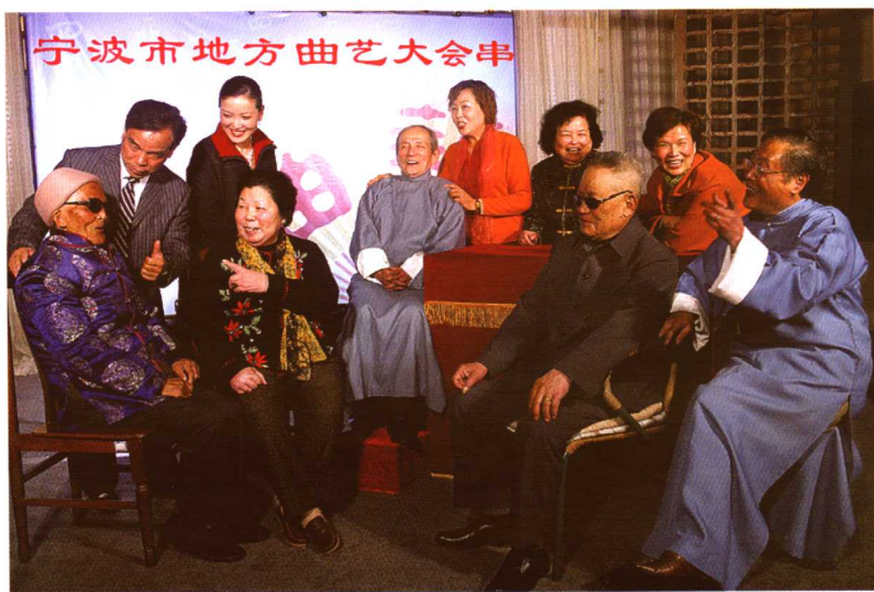
曲艺大会串,名家笑开颜