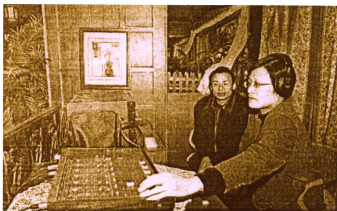
宁波广播电台正在录制传统曲艺