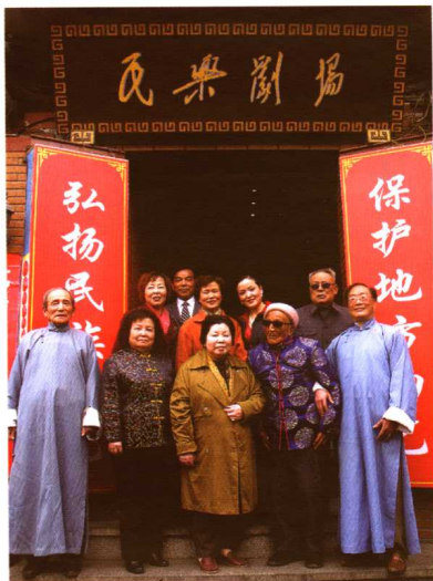
新老曲艺家相聚民乐剧场