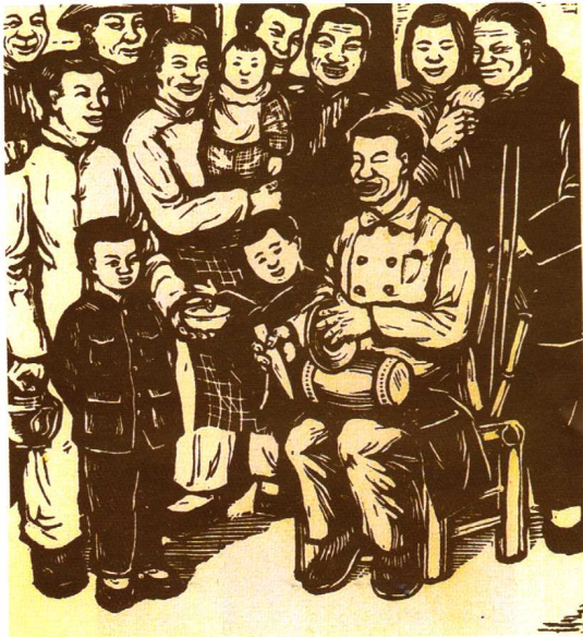
盲人唱新闻(木刻,作者周士非)