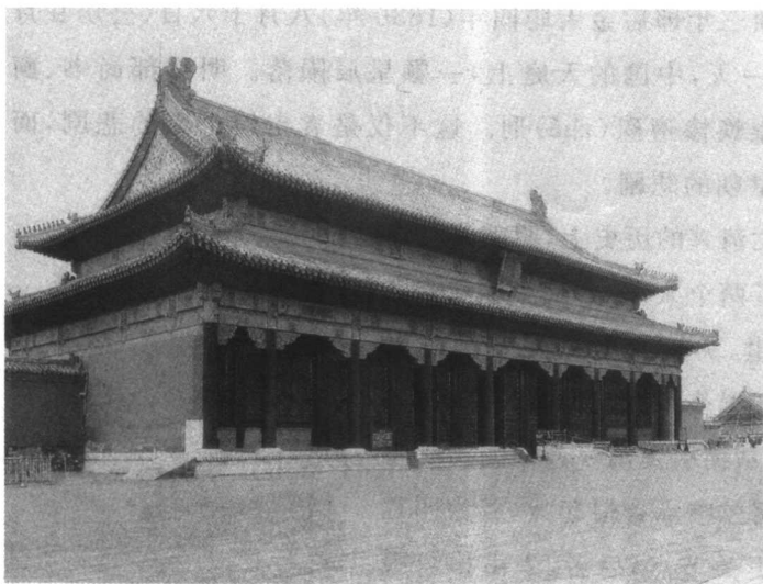
紫禁城建极殿(今保和殿)

明崇祯二年即后金天聪三年(1629年)十二月初一日,崇祯皇帝在北京紫禁城平台(紫禁城建极殿即今保和殿居中向后为云台门,其两旁向后为云台左门、云台右门,又名平台),召见袁崇焕,传谕是要“议军饷”。