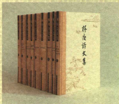
林庚诗文集（精装本）