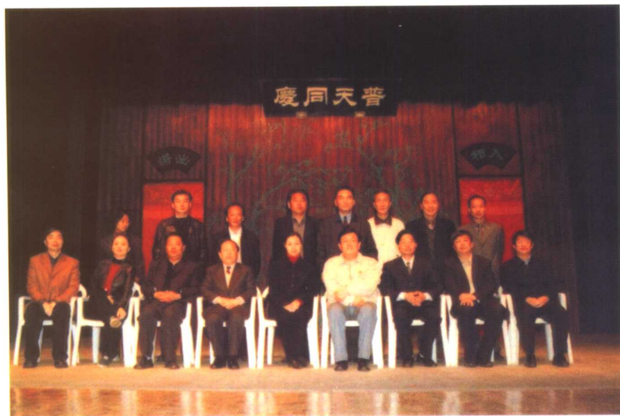
2003年陈晓光同志考察该院。