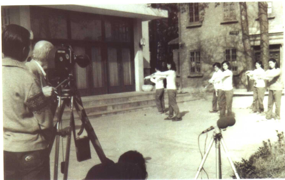
1983年联合国教科文组织专家来该团收集有关表演艺术、音乐等资料。