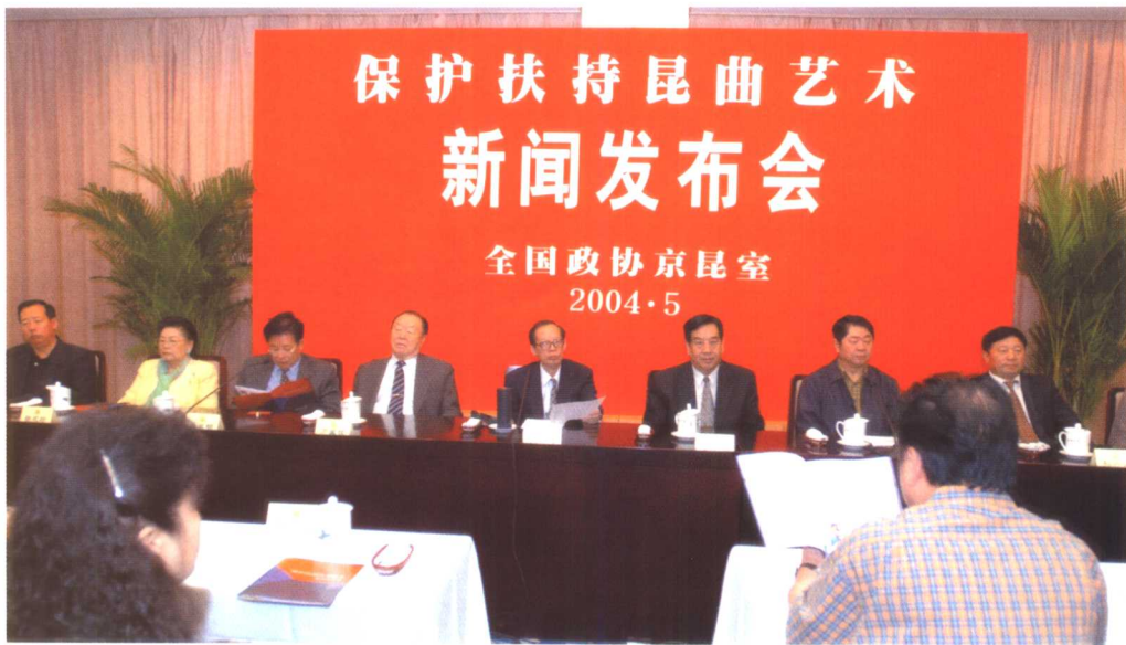
“保护扶持昆曲艺术”新闻发布会 2004年5月12日由王选在全国政协会议中心主持。