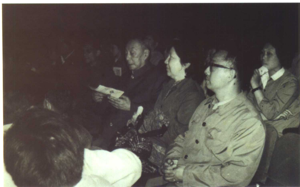
1981年5月俞振飞夫妇在上海劳动剧场观看该团演出。