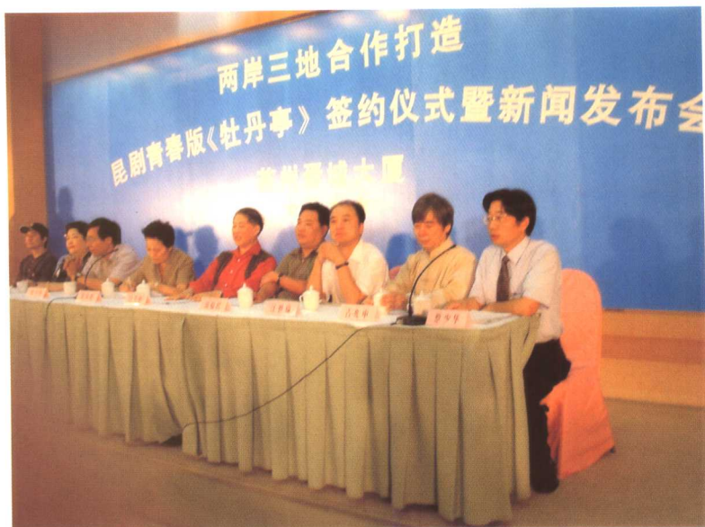
2003年9月27日青春版《牡丹亭》新闻发布会。