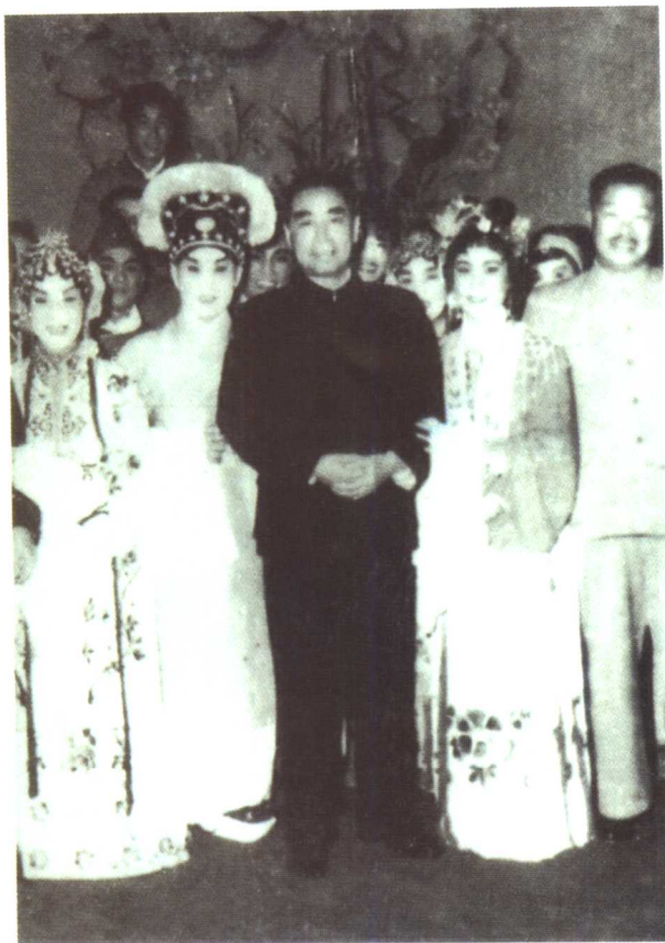
周恩来、贺龙同志与苏州昆剧团演员合影。