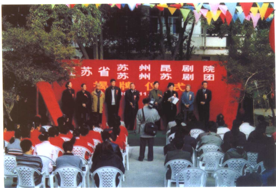
2001年11月苏州昆剧院改团为院挂牌仪式。