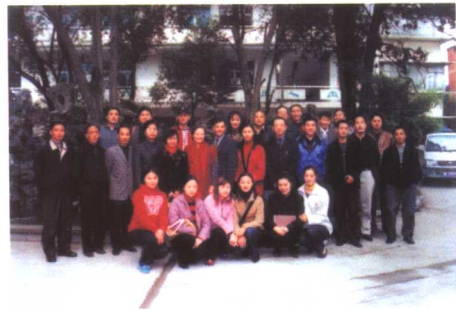
2002年联合国教科文组织官员视察该院。