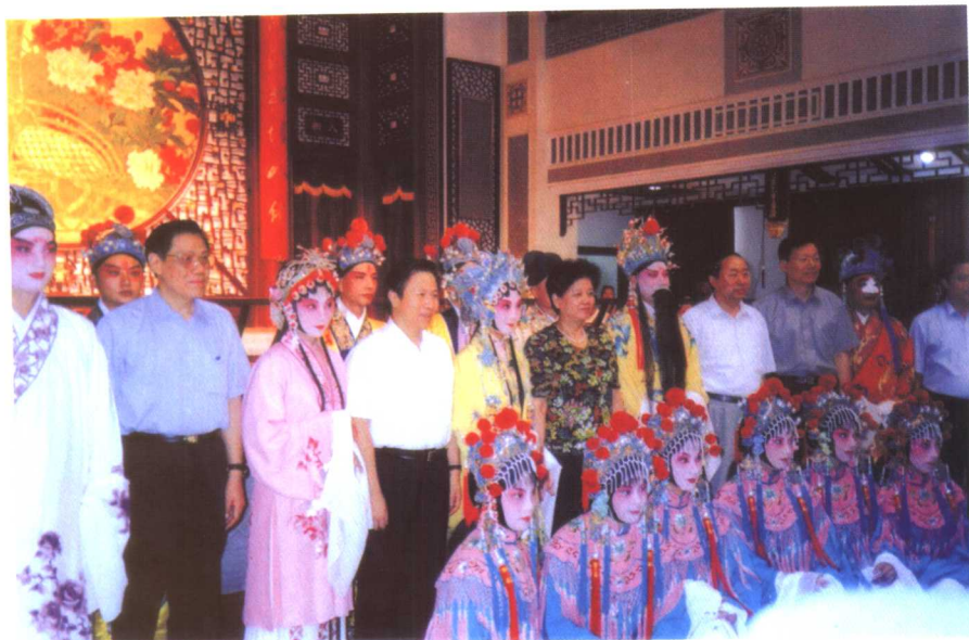
2003年陈至立同志观摩该院表演后接见演员。