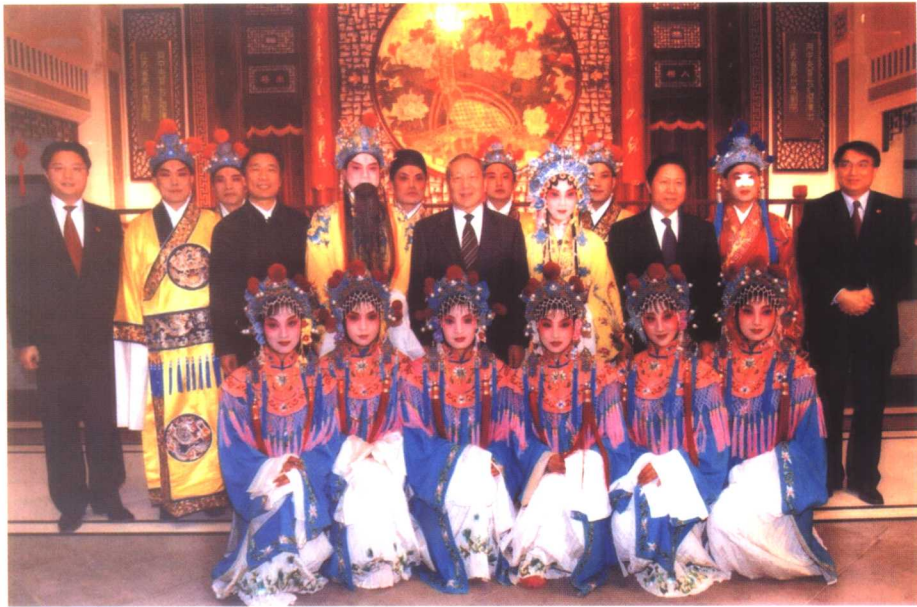
2003年2月27日李岚清同志在沁兰厅与该演员合影留念。