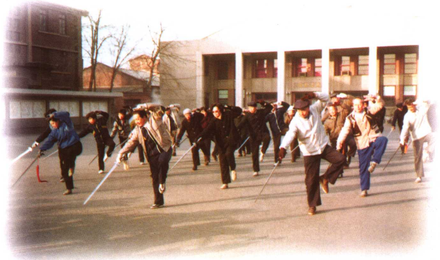
向“天津市老年大学”传授武当剑第一路。