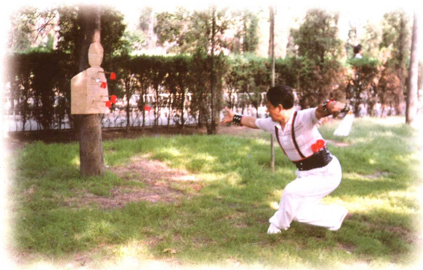
演练 武当飞剑 “宿鸟投 林”式。