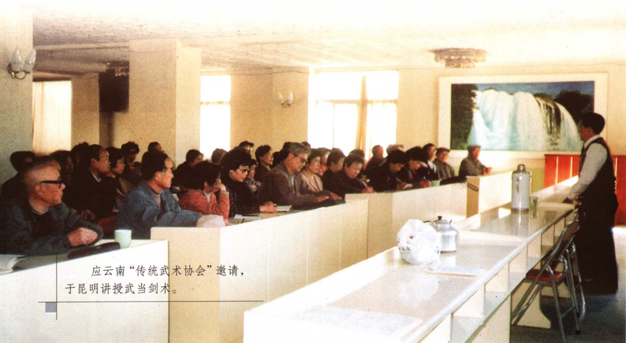
应云南“传统武术协会”邀请，于昆明讲授武当剑术。