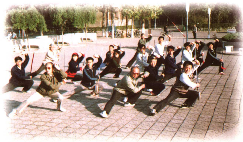
于天津大学“武当拳剑培训中心”向学员传授武当剑第六路。