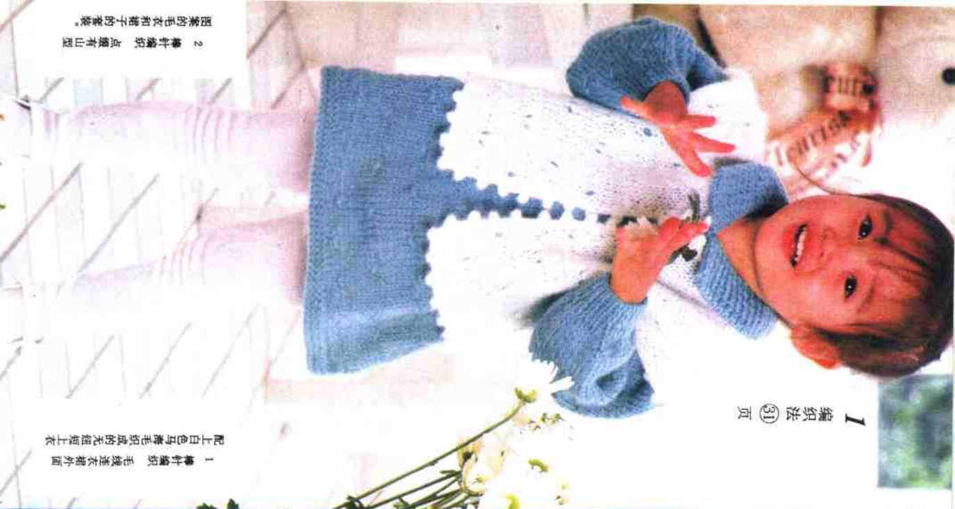
1 编织法 ③1 页