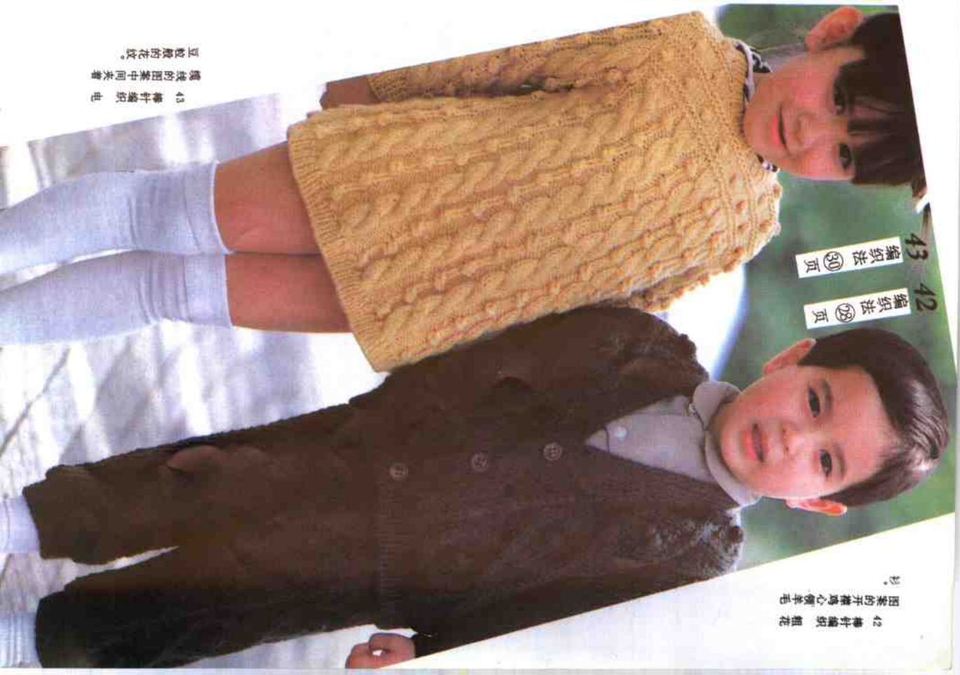
42 棒针编织 粗花 图案的开襟鸡心领羊毛衫