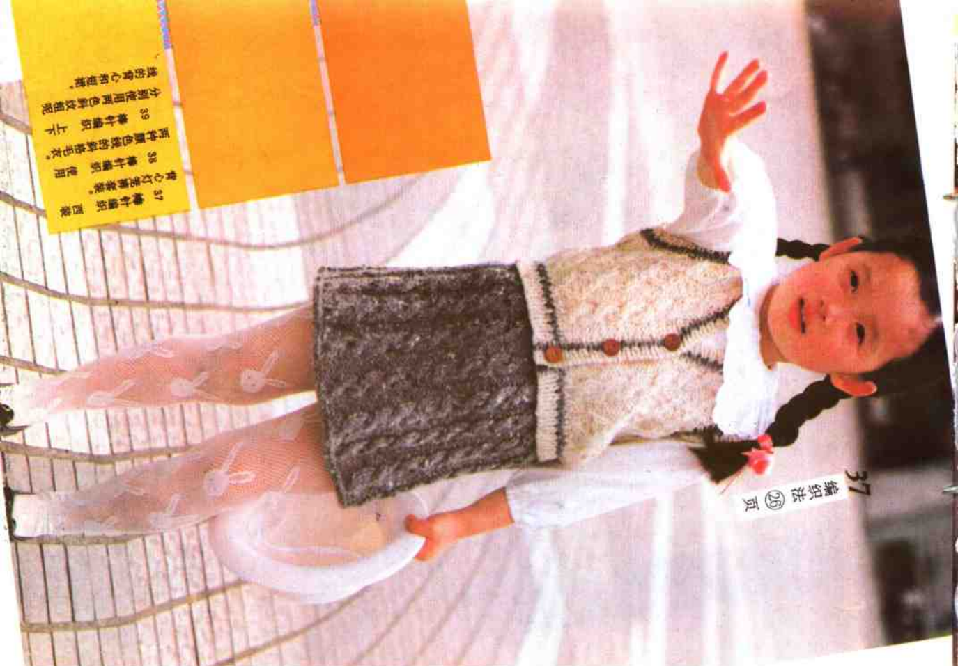
37 编织法 ②6 页

37 棒针编织 圆领 背心灯罩排插使用 38 棒针编织 使用 两种颜色线的斜纹毛衣 39 棒针编织 上下 分别使用两种斜纹组织 线的背心和短襟