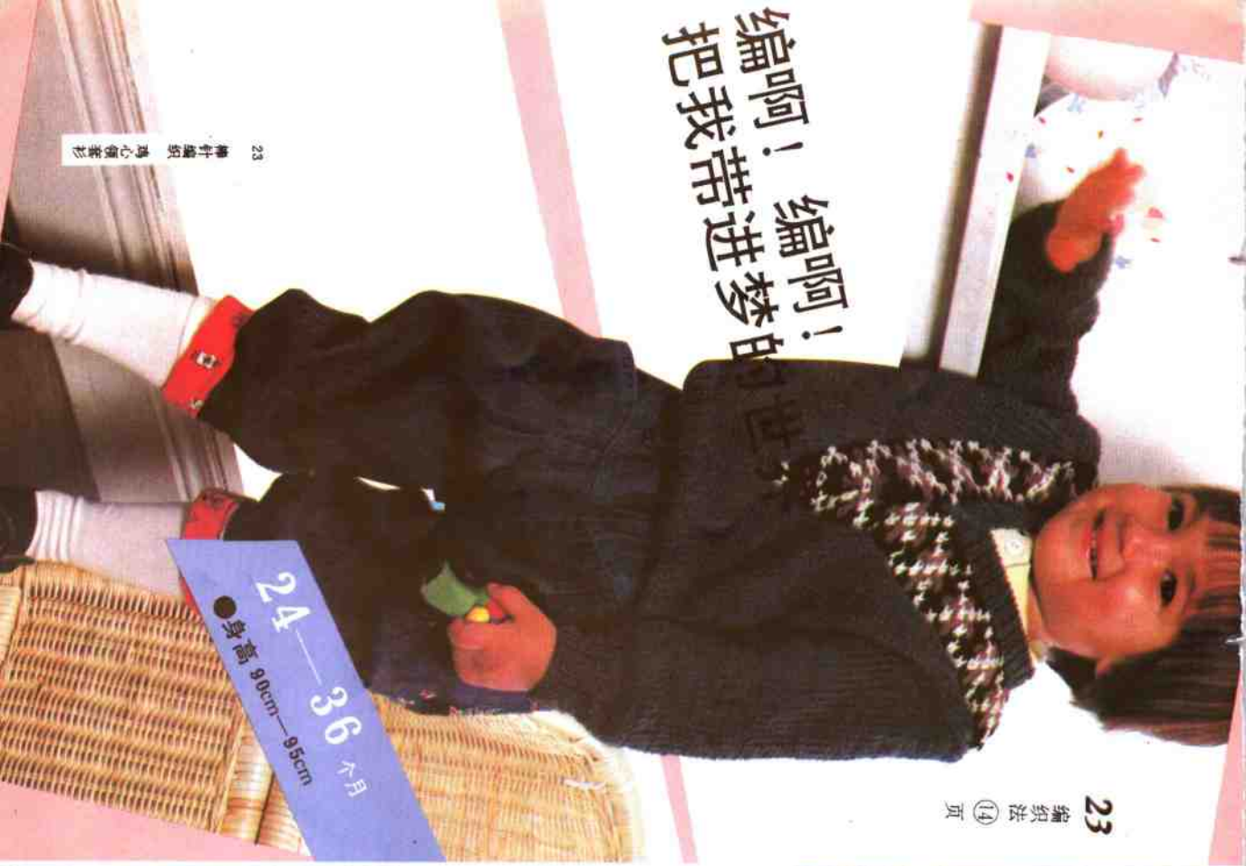
23 编织法 ⑭ 页