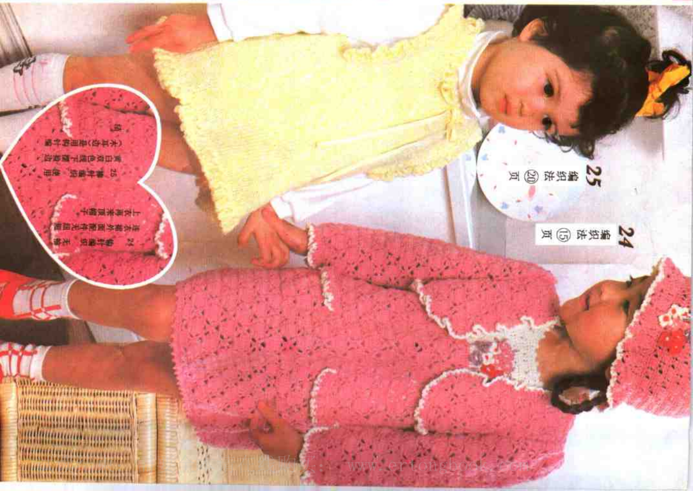
25 编织法 ⑳ 页