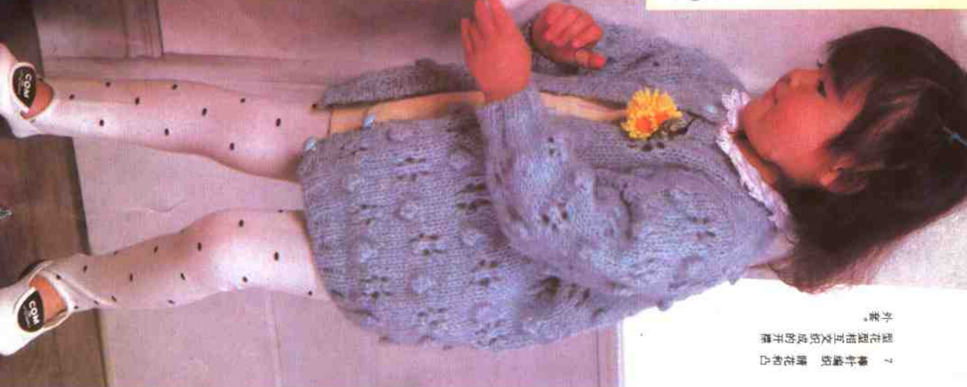
7 棒针编织 睡花和凸型花型相互交织的开襟外套。