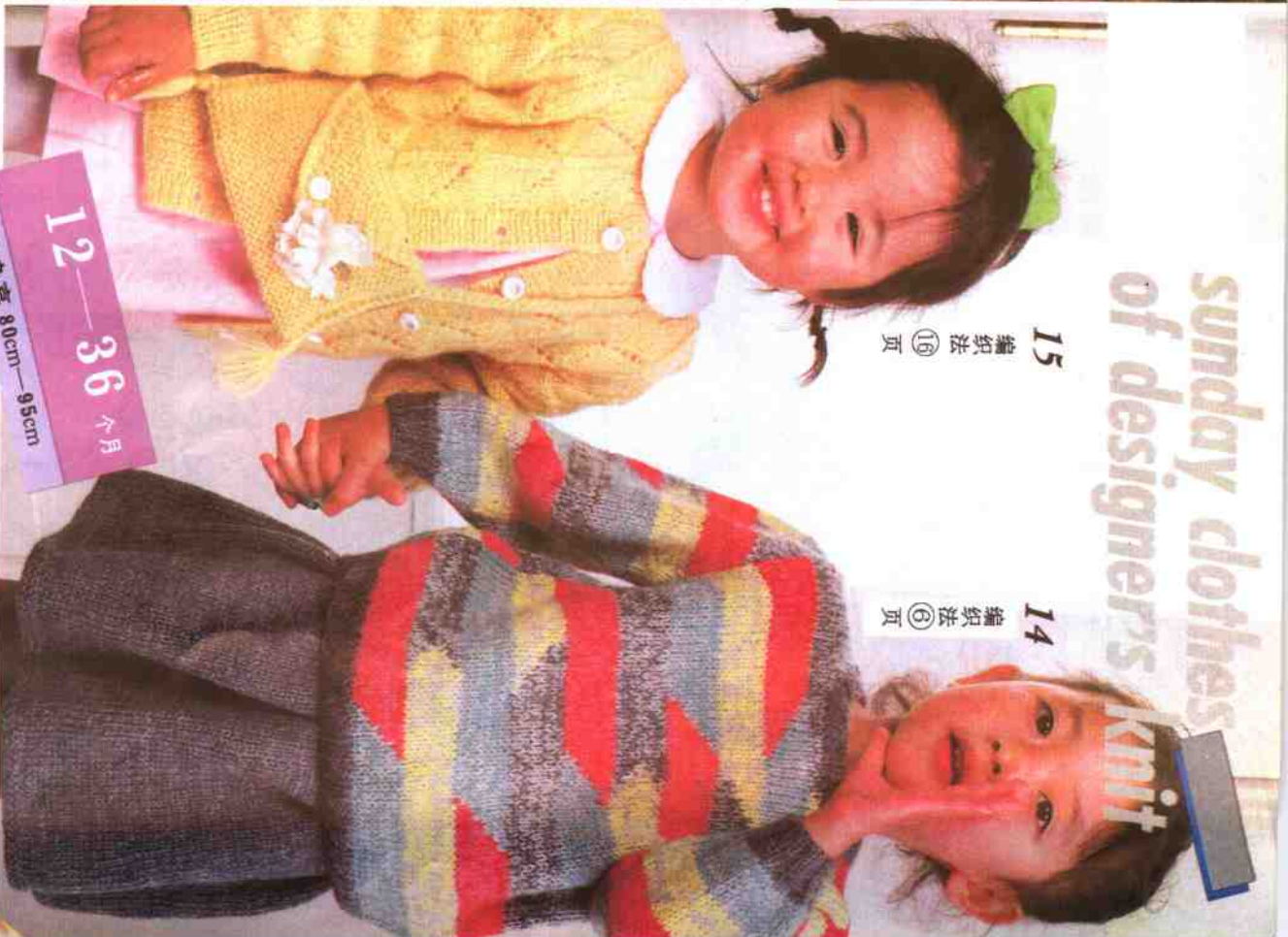
14 编织法 ⑨ 页