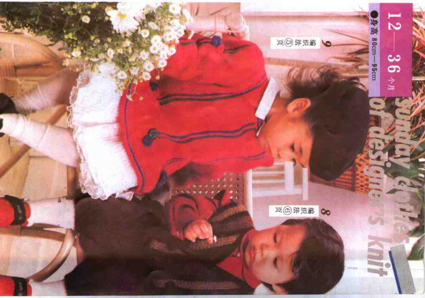
9 编织法 ⑮ 页