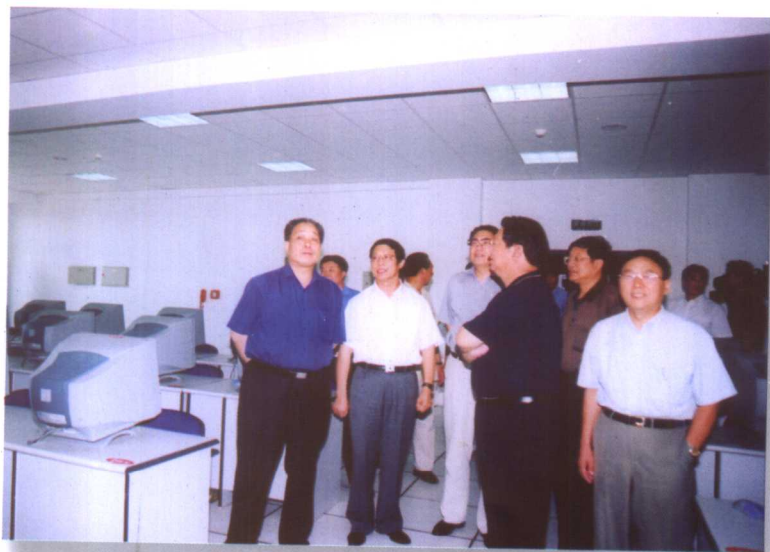
8月11日，教育部副部长张保庆来我校视察工作。