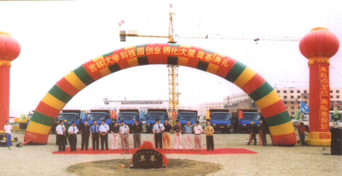
7月9日，学校举行科技园创业孵化大厦奠基典礼。吉林省副省长陈晓光出席了奠基仪式并为大厦奠基。