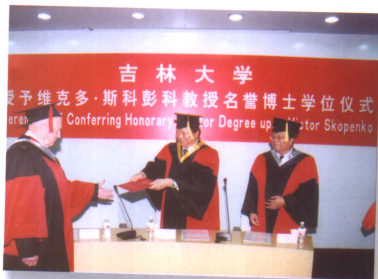
11月18日，吉林大学授予乌克兰基辅国立大学校长维克多·斯科彭科教授吉林大学名誉博士学位，这是我校首次将名誉博士学位授予国外学者。