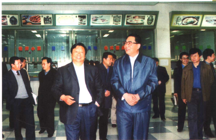
5月1日，吉林省副省长李锦斌率相关部门负责同志到我校检查“非典”防治工作落实情况。