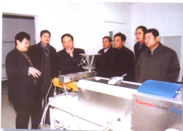
11月6日，吉林省委书记王云坤，副书记林炎志、全哲洙，副省长李锦斌来我校调研，考察我校部分实验室。