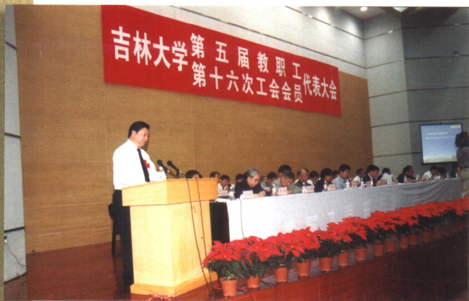
6月19日,学校举行第五届教职工代表大会暨第十六次工会会员代表大会。