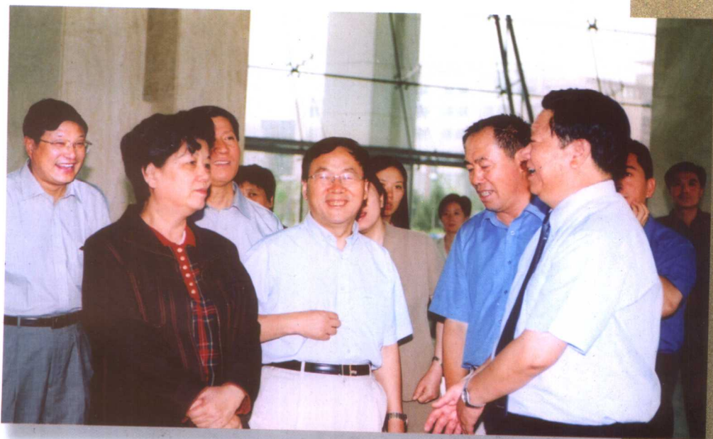
7月3日，国务委员陈至立、国务院副秘书长陈进玉、教育部副部长王湛、财政部副部长金立群和国家文物局局长单霁翔在省委、省政府领导的陪同下来我校进行视察。