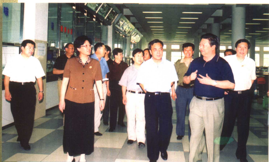
6月30日,以国家人口计生委副主任赵炳礼为组长的国务院“非典”防控督察组在副省长李斌、省卫生厅厅长李殿富的陪同下到我校进行检查指导。