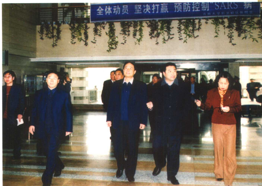
4月22日，省委书记王云坤、省委秘书长李申学和有关部门负责同志来我校视察“非典”防治工作。