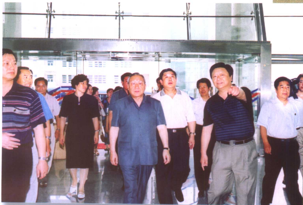
7月15日，国务院副总理李岚清在省委、省政府领导的陪同下来我校视察。