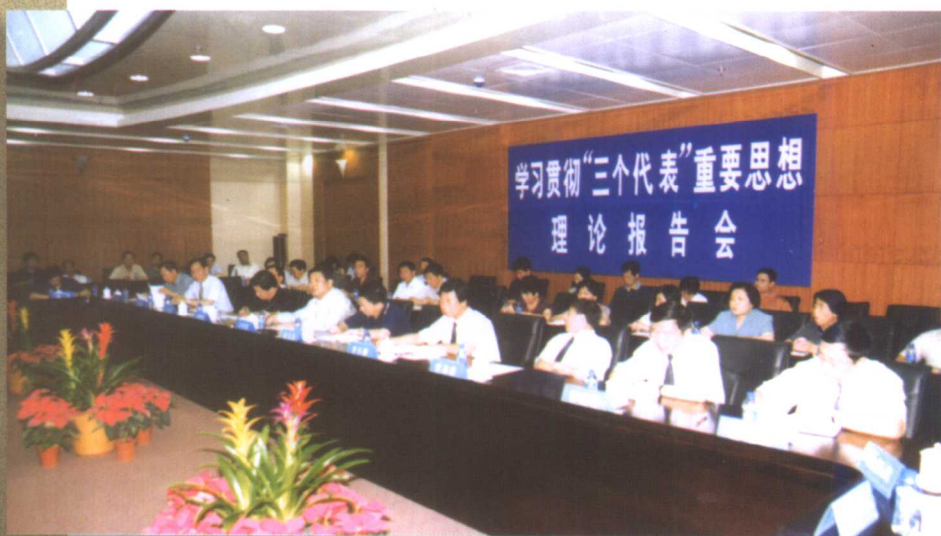
7月9日，吉林省委副书记全哲洙来我校为我校党委理论中心组成员及基层党委书记作“三个代表”重要思想理论报告。