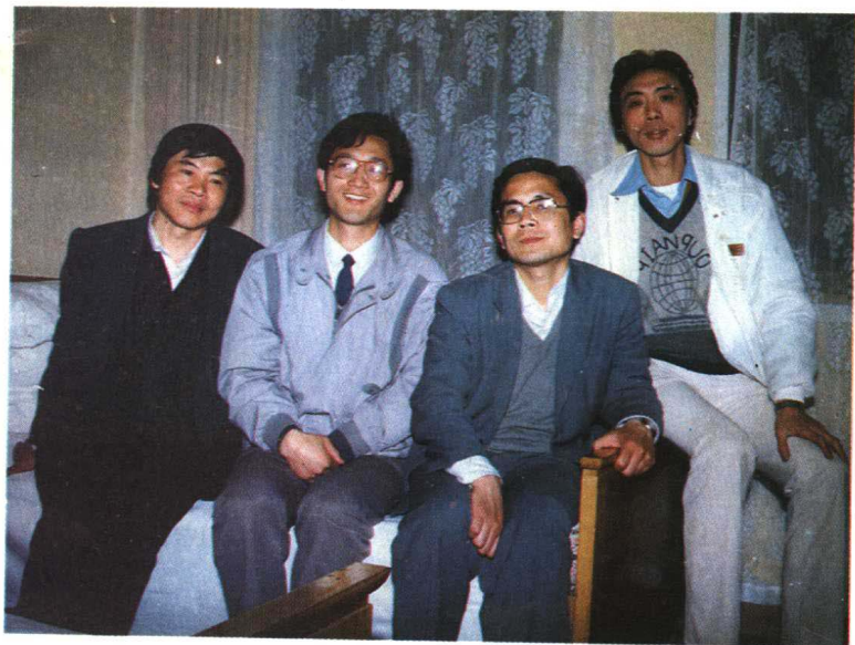
作者与责任编辑合影