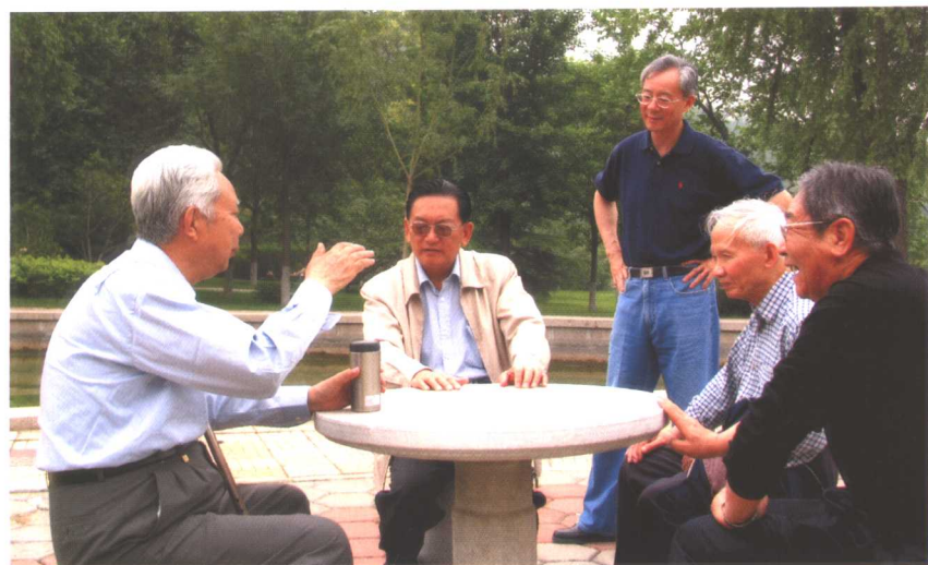
会议休息期间，学者们仍在继续讨论问题