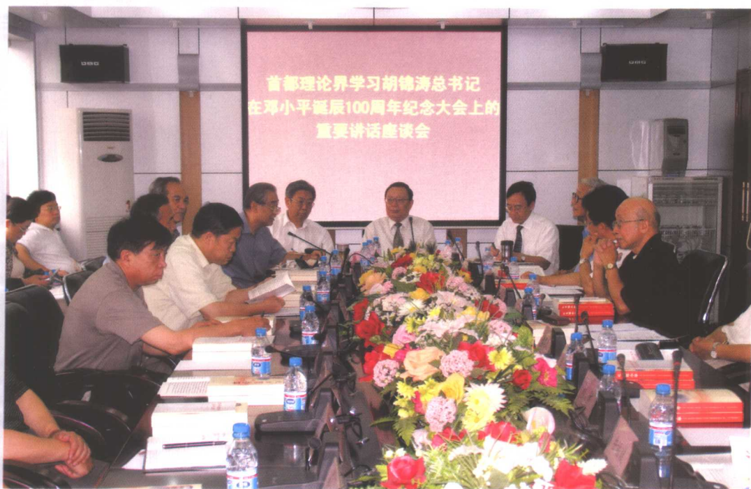
为纪念邓小平同志诞辰100周年，中共北京市委宣传部、北京市社会科学界联合会、北京市邓小平理论和“三个代表”重要思想研究中心等单位联合举办理论研讨会和座谈会