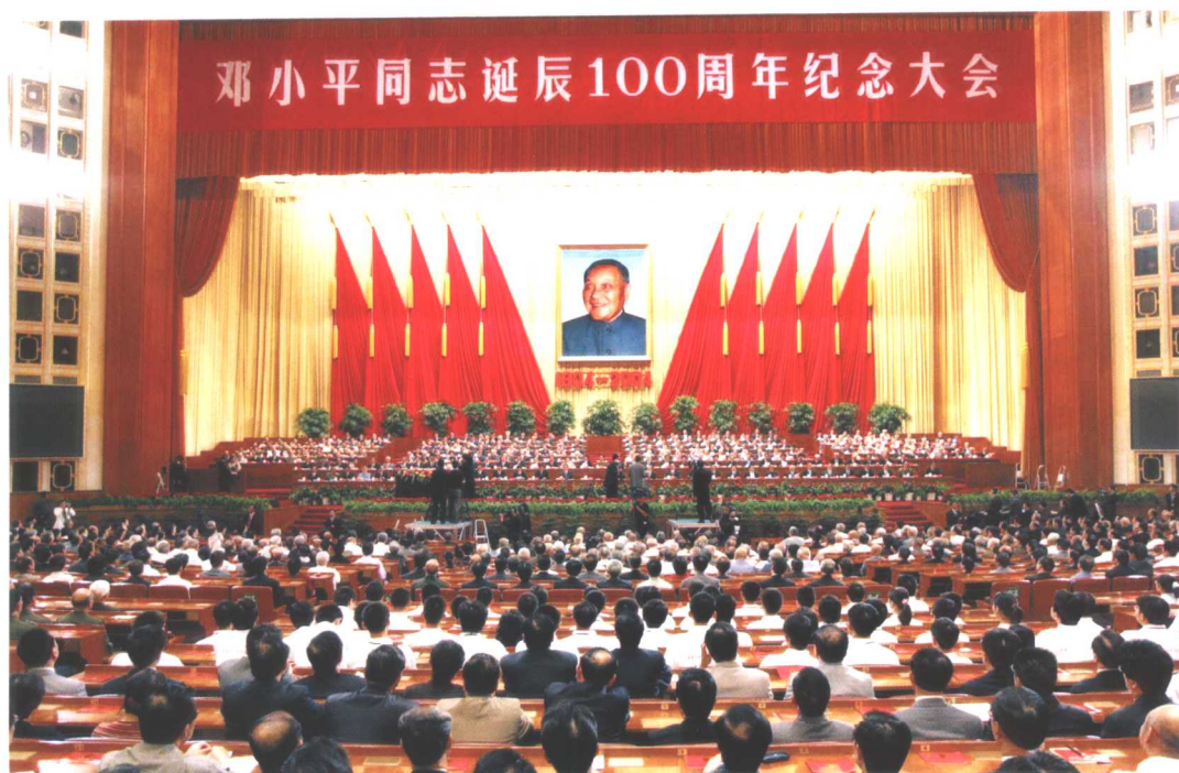
邓小平同志诞辰100周年纪念大会会场