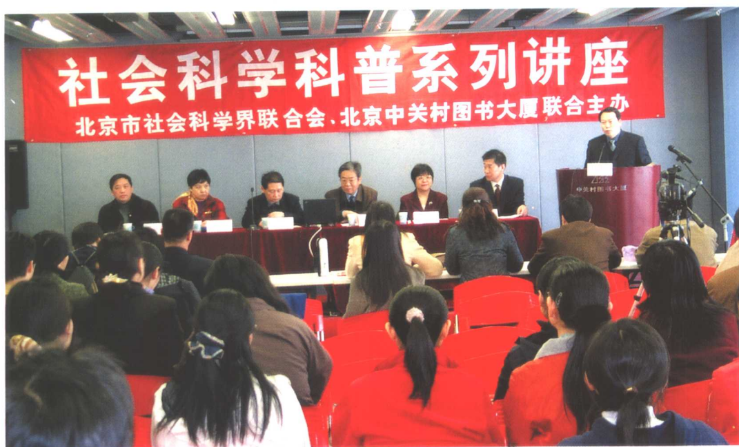
北京市社会科学界联合会及部分所属学会，于2004年共举办各类社科讲座150余场。图为“2004·北京经常性社科普及讲座”开幕式