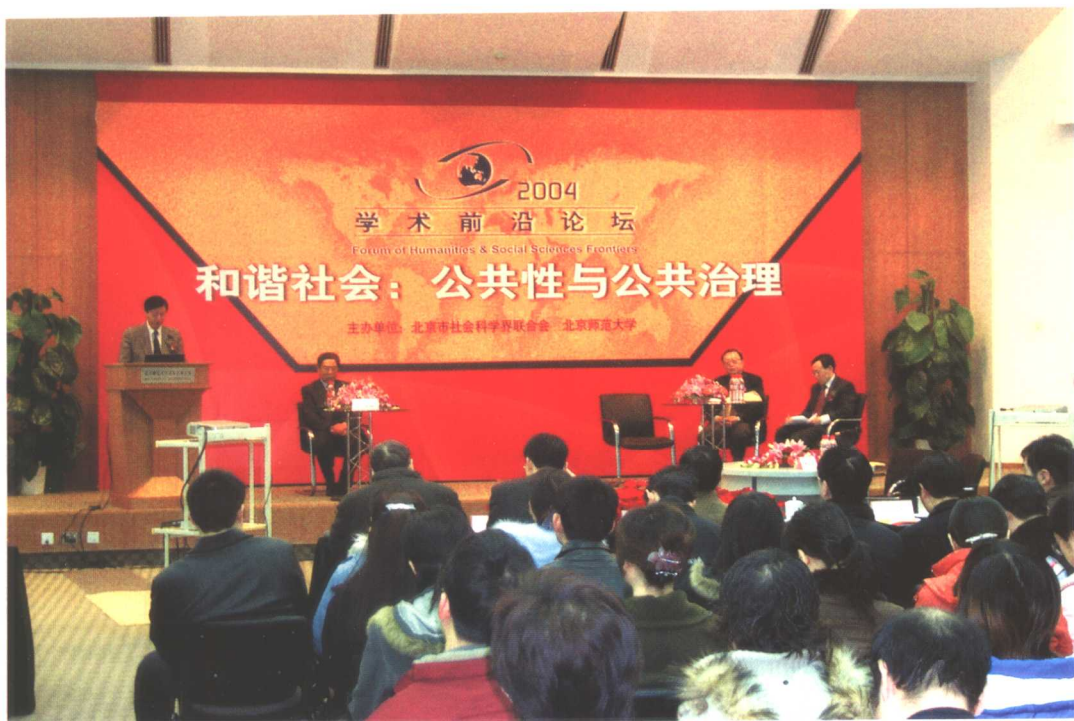
2004年12月18日，北京市社会科学界联合会与北京师范大学共同举办“2004·学术前沿论坛”。上图为以“和谐社会：公共性与公共治理”为主题的主论坛 下图为部分分论坛