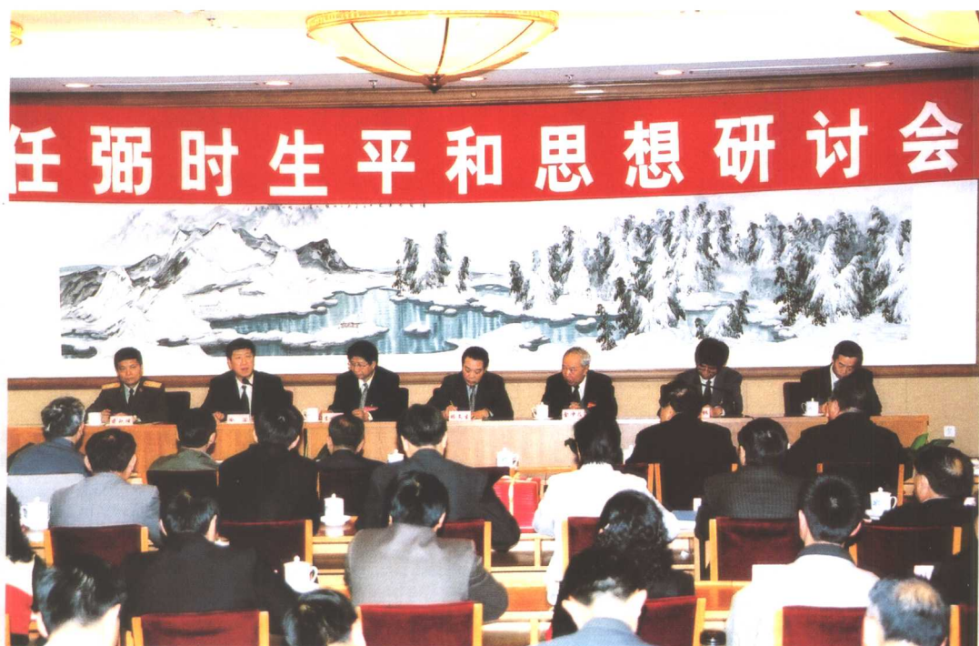
2004年4月28日至30日，中共中央组织部、中共中央宣传部、中共中央党校、中共中央文献研究室、中共中央党史研究室、共青团中央、教育部和解放军总政治部在北京联合召开“任弼时生平和思想研讨会”