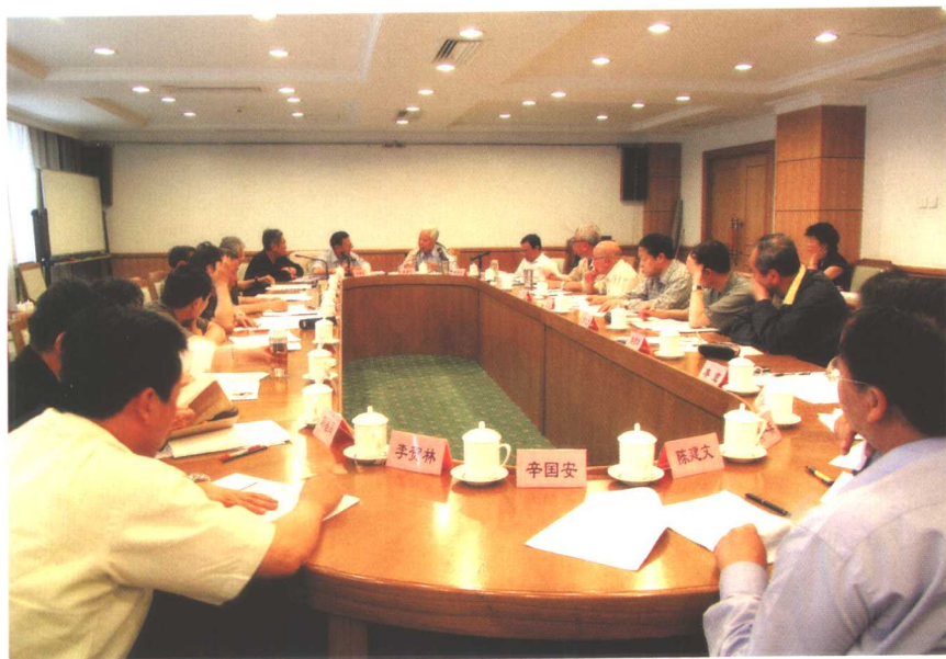
2004年，党中央开始实施马克思主义理论研究和建设工程，北京市邓小平理论和“三个代表”重要思想研究中心承担了此项工程的两项重大课题。图为课题组专家学者研究课题撰写工作