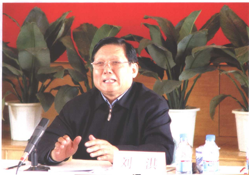
2004年4月8日，市委书记刘淇同志到北京市社科院、北京市社科联、北京市社科规划办公室等单位调研并召开了座谈会。刘淇同志在座谈会上做重要讲话