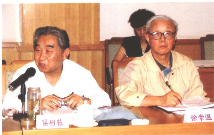
咨询组成员在研讨会上发表意见