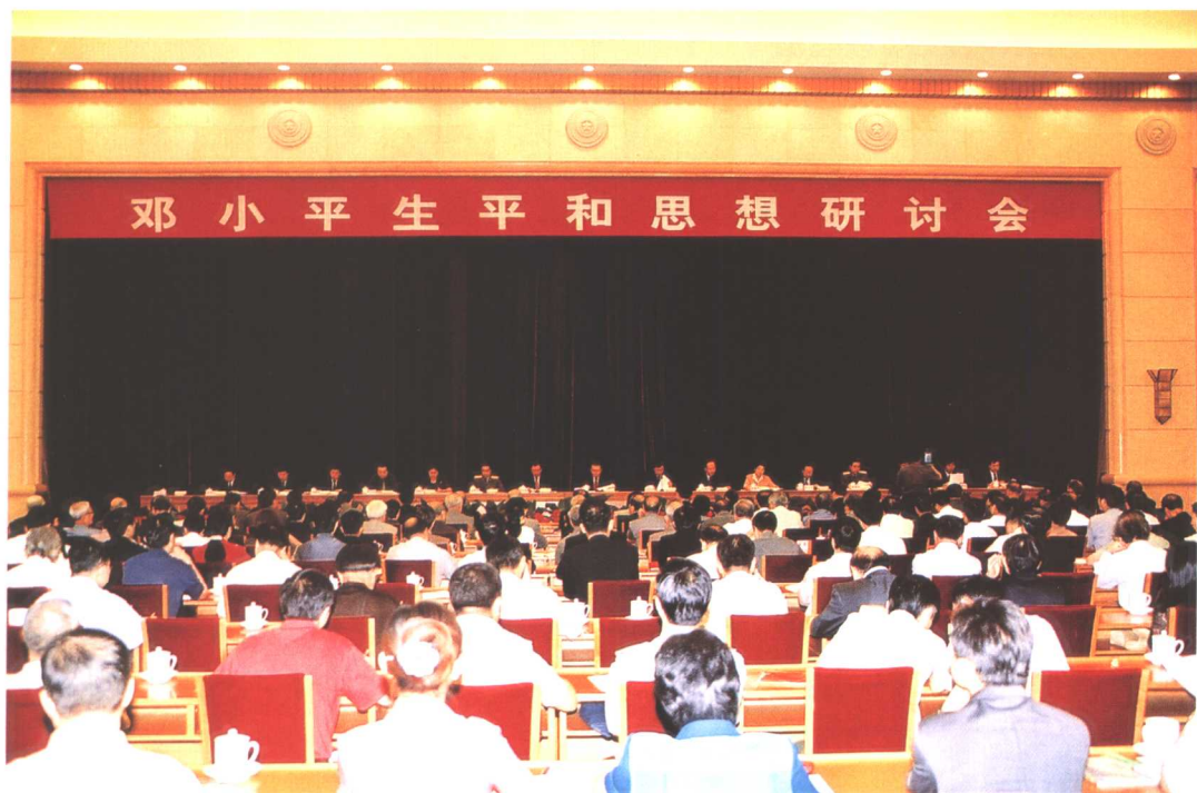
2004年8月21日至24日，中共中央宣传部、中共中央党校、中共中央文献研究室、中共中央党史研究室、教育部、中国社会科学院和解放军总政治部在北京联合召开“邓小平生平和思想研讨会”