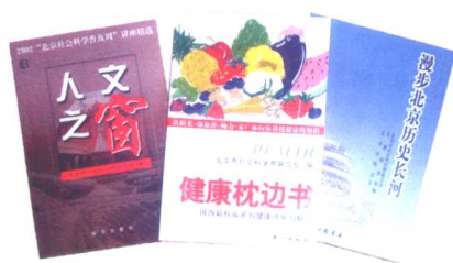
北京市社会科学界联合会将科普讲座的部分内容编纂成书，出版发行，深受广大读者的欢迎