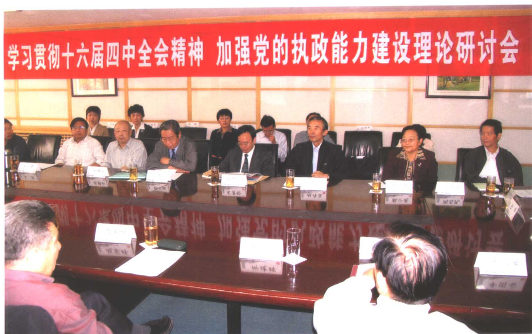
2004年9月23日，中共北京市委宣传部、北京市邓小平理论和“三个代表”重要思想研究中心、北京大学邓小平理论研究中心在北京大学联合召开“学习贯彻十六届四中全会精神，加强党的执政能力建设理论研讨会”