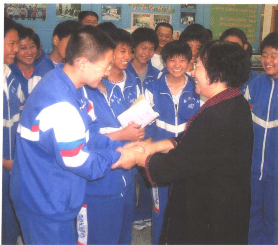
同学们感谢学者传授社科知识