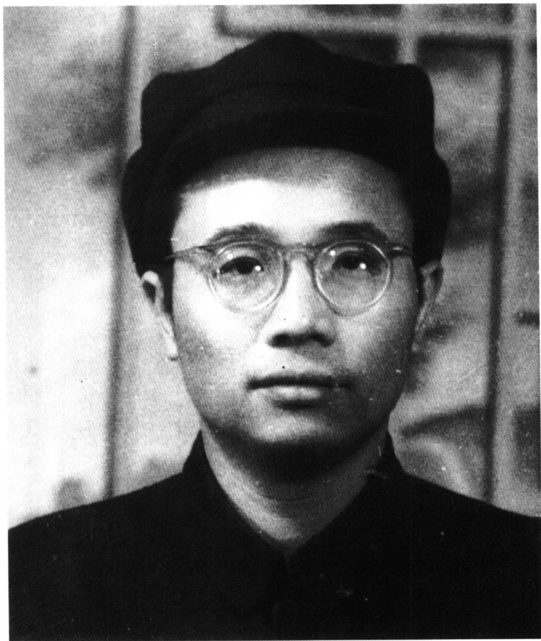
1948年，何其芳在河北省平山县。