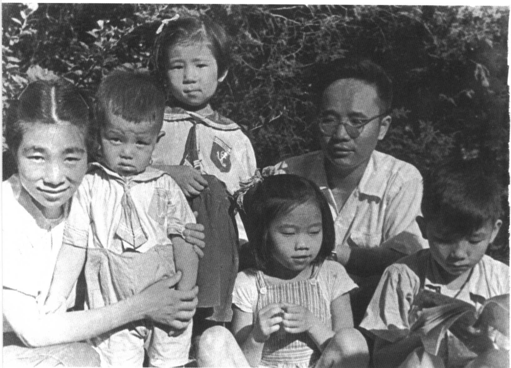
1953年，何其芳全家摄于北京大学燕东园。