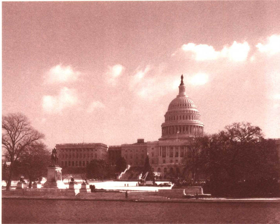
大洋彼岸的美利坚合众国

一公关’，形象很好，我的形象不如他好。”引起大家哈哈大笑。接着，蔡武严肃起来，他说，这次赴美交流是我们完善新闻发布制度的一个重要举措。我国普遍推行新闻发言人制度，在国际国内反映都很好，创造了良好的舆论环境，对依法执政、民主执政很有意义。这次与美国同行沟通，是中国政府新闻发言人在美国的群体亮相，我们既要认真学习别人有益的经验，也要充分展示自己的形象，这个形象应该是民主开放的形象、积极正面的形象、幽默机敏的形象、博学多才的形象。他要求大家利用一切机会宣传中国，宣传中国走和平发展之路，利用全球和平发展自己，以自己的发展促进全球和平。要让美国各界人士相信这一点，中国正在迅速发展，但是中国的发展对任何国家都不构成威胁，而是对所有国家提供合作交流的机会。我们希望各国都发展，这符合中国的根本利益，也符合中华民族的民族性格和民族文化。比如郑和下西洋，带去的是瓷器和丝绸，没有带去