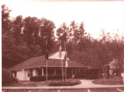
杜克大学校园的森林木屋

从北京抵达纽约，我们未出机场便转机飞往北卡罗莱纳州，一个小时的夜航便到目的地。杜克大学已派人接机。我们下榻在风光旖旎、舒适恬静的学校森林别墅。