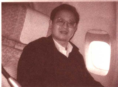
作者在北京飞往美国的航班上

北京首都机场，阳光灿烂，晴空万里。一架银白色波音747飞机，伴随着巨大的轰鸣声，从跑道上翘首而起，冲向蓝天，向着太平洋彼岸的美利坚合众国飞去。