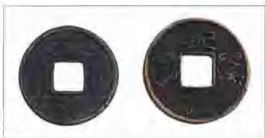
北朝周 “五行大布”、“永通万国”

钱。周武帝更铸钱，文曰布泉，以一当五，与五铢钱并行，更铸五行大布钱，以一当十，与布泉钱并行。至宣帝大象元年十一月，铸永通万国钱，以一当十，与五行大布钱并行。