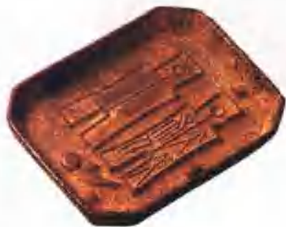
新 “大布黄千”铜母范

寸五分，重十五铢，文曰小布一百；自小布以上，各相长一分，相重一铢，文名为其布名，值各加一百，上至大布，长二寸四分，重一两而值千钱矣。是为布十品，皆为铜铸，遂废汉之五铢钱。