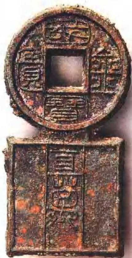
新 “国宝金匱直万” 可能是与布货十品相配合使用