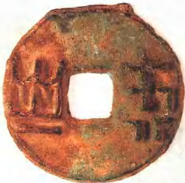
秦 半两钱 秦惠文王二年制。