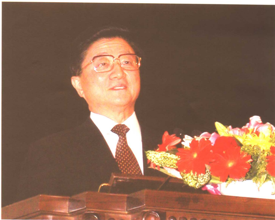
2004年4月28日，中共中央政治局常委、国务院副总理黄菊出席中国就业论坛开幕式并致辞。