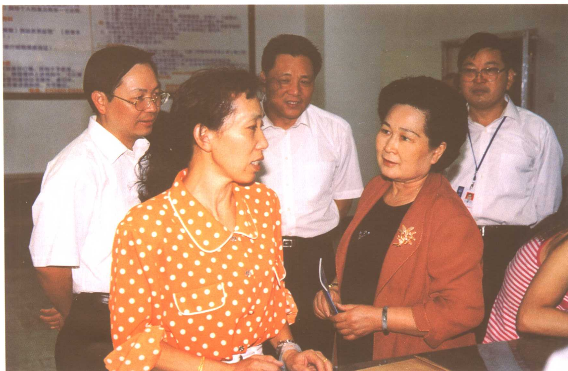
2004年10月，劳动保障部副部长华福周考察福建省厦门市劳动力市场。