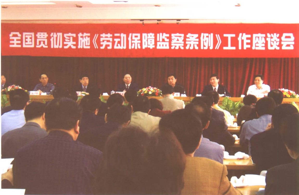
2004年11月22日至23日，全国贯彻实施《劳动保障监察条例》工作座谈会在福建省厦门市召开，劳动保障部副部长步正发出席会议并讲话。