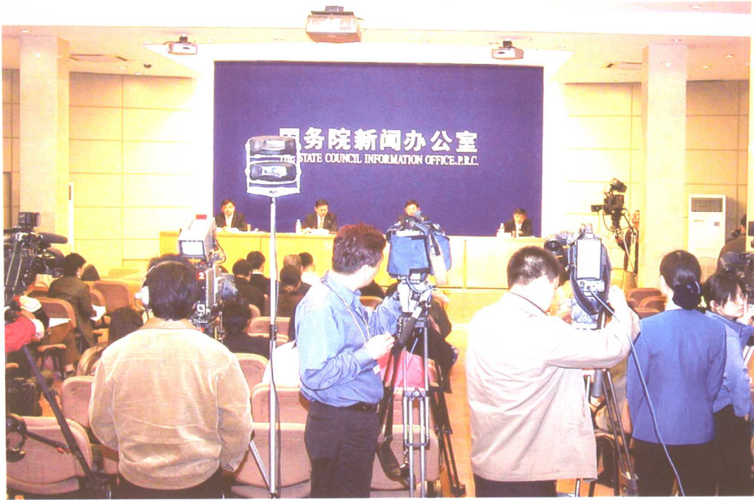
2004年4月26日，国务院新闻办公室召开《中国的就业状况和政策》白皮书新闻发布会，这是中国政府发表的第一部专门阐述中国就业问题的白皮书。