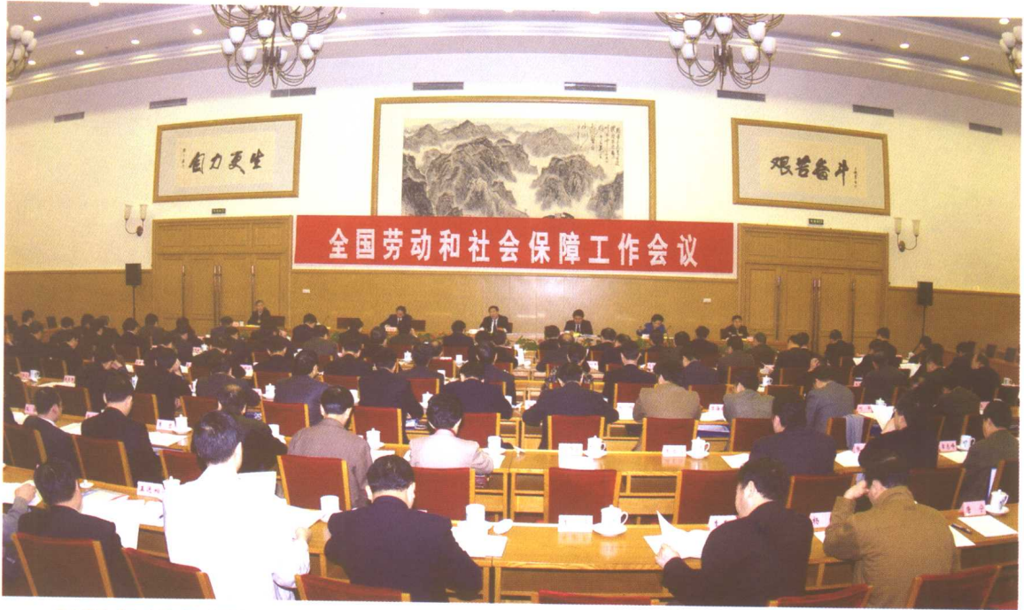
2004年12月17日至18日，全国劳动和社会保障工作会议在北京召开。劳动保障部部长郑斯林作了题为《立足当前 着眼长远 努力开创劳动保障工作的新局面》的工作报告。劳动保障部副部长王东进作总结讲话。副部长步正发、华福周、张小建、刘永富，中纪委驻部纪检组组长崔会烈等出席会议。