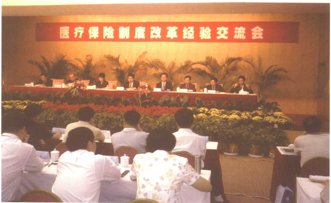
2004年9月20日至24日，中国医疗保险制度改革论坛和医疗保险制度改革经验交流会在江苏省镇江市召开，劳动保障部副部长王东进出席会议并讲话。