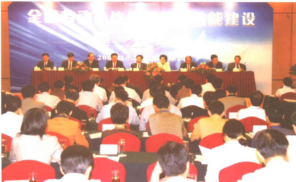
2004年10月27日至28日，全国劳动争议仲裁机构效能建设座谈会在广东省深圳市召开，劳动保障部副部长王东进、华福周出席。会上，王东进同志讲话，华福周同志作总结。