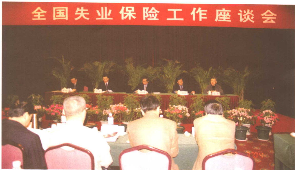
2004年3月18日至19日，全国失业保险工作座谈会在山东省青岛市召开，劳动保障部副部长张小建出席会议并讲话。