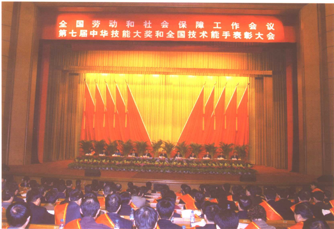
2004年12月17日，第七届中华技能大奖和全国技术能手表彰大会在北京召开。中共中央政治局常委、国务院副总理黄菊出席会议并讲话。20名中华技能大奖获得者、433名全国技术能手、55家获得技能人才培养突出贡献奖的单位受到表彰。