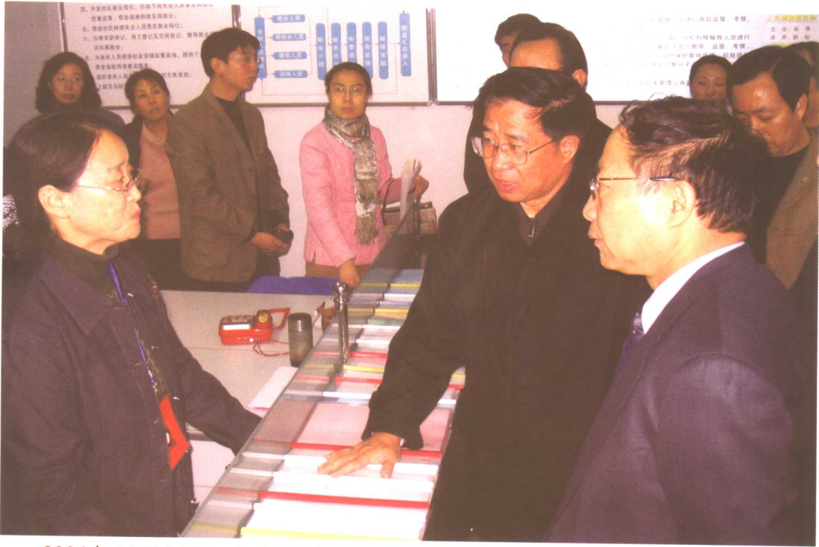
2004年11月21日，劳动保障部副部长张小建在山西省太原市迎泽区老军营街道桃园南路二社区劳动保障工作站调研。