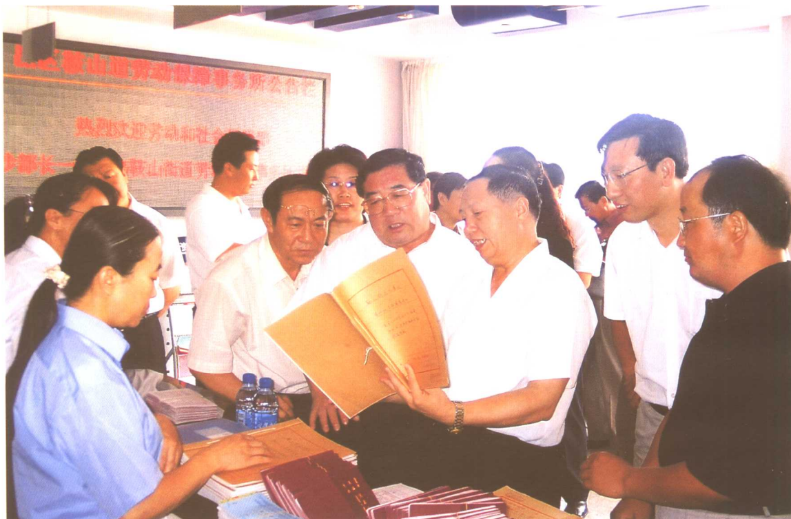
2004年7月，劳动保障部副部长步正发考察内蒙古包头市鞍山道劳动保障事务所。