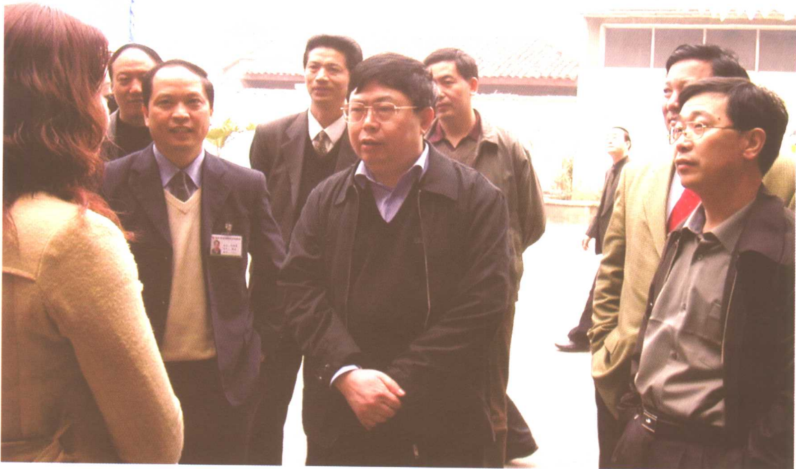
2004年2月，劳动保障部副部长刘永富在四川省成都市考察街道社区劳动保障工作。