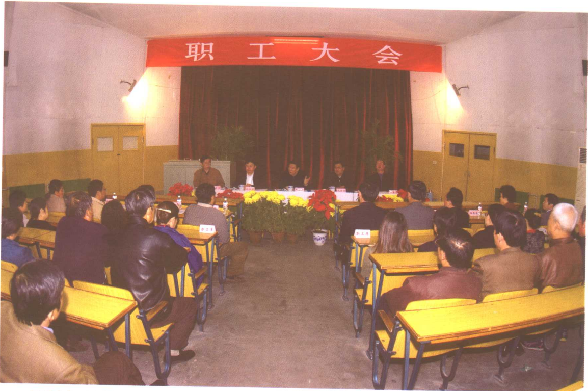
2004年11月18日，经中央机构编制委员会办公室批准，劳动保障部社会保障能力建设中心成立。图为劳动保障部部长郑斯林、副部长刘永富出席能力建设中心首次职工大会。