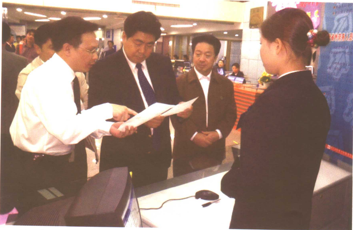
2004年10月21日，劳动保障部副部长王东进考察江西省南昌市劳动力市场。