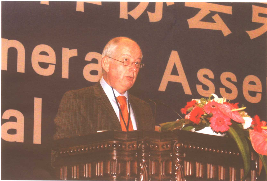
2004年9月12日，国际社会保障协会主席约翰·维斯雷腾在国际社会保障协会第28届全球大会开幕式上讲话。