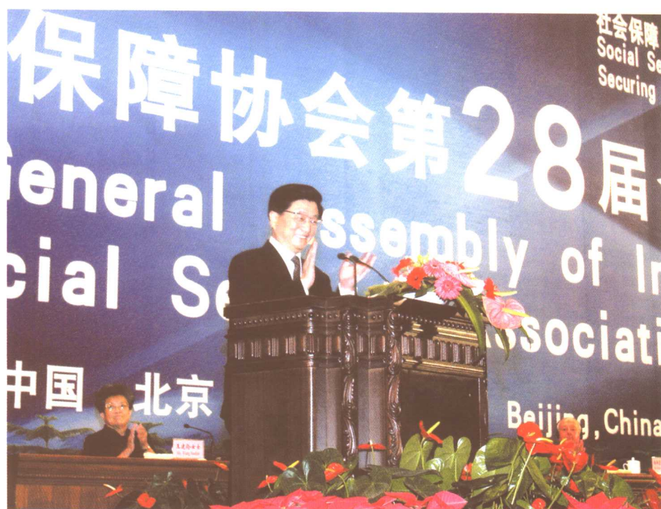
2004年9月12日，中共中央政治局常委、国务院副总理黄菊出席国际社会保障协会第28届全球大会开幕式并致辞。