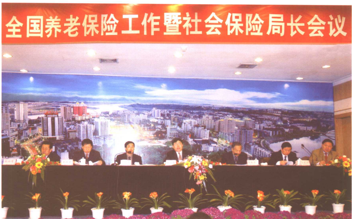
2004年2月24日至27日，全国养老保险工作暨社会保险局长会议在四川省召开，劳动保障部副部长刘永富出席会议并讲话。