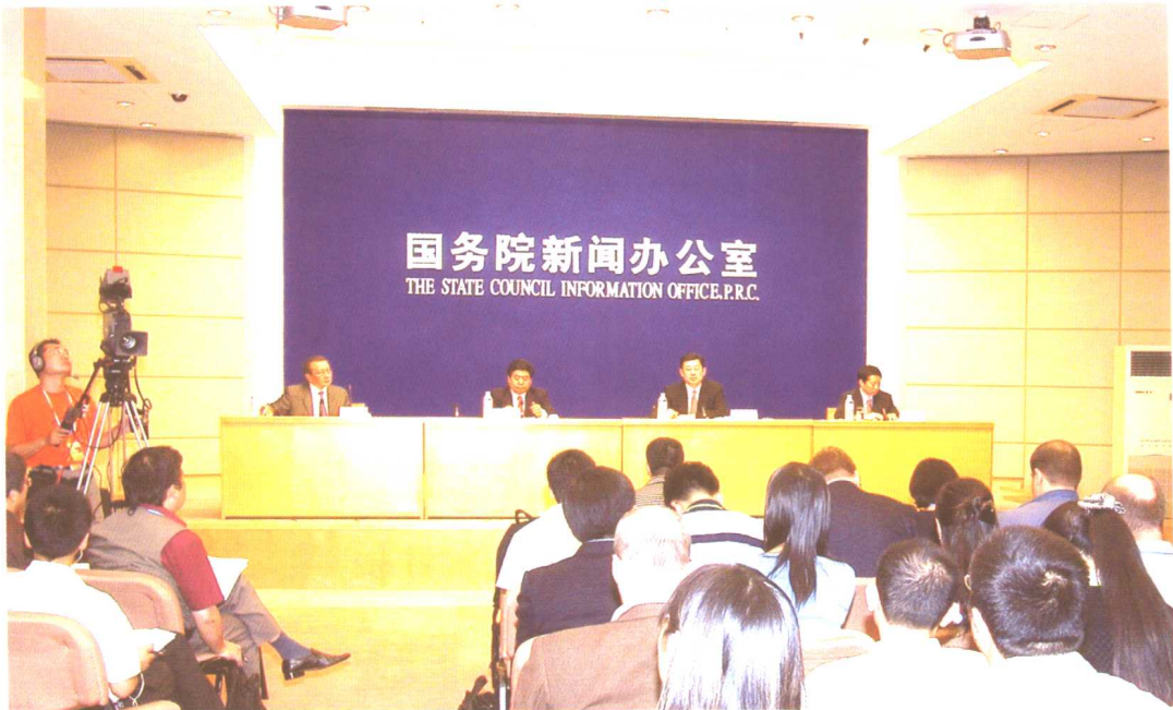
2004年9月7日，国务院新闻办公室召开《中国的社会保障状况和政策》白皮书新闻发布会，这是中国政府发表的第一部专门阐述中国社会保障问题的白皮书。劳动保障部副部长王东进出席发布会并向与会人员介绍有关情况，回答中外记者提问。