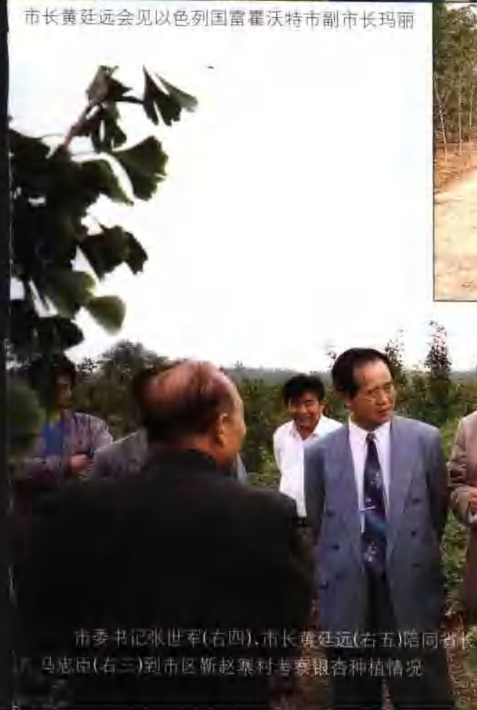
市委书记张世军(右四)、市长黄廷远(右五)陪同省长马忠臣(右三)到市区靳赵寨村考察银杏种植情况