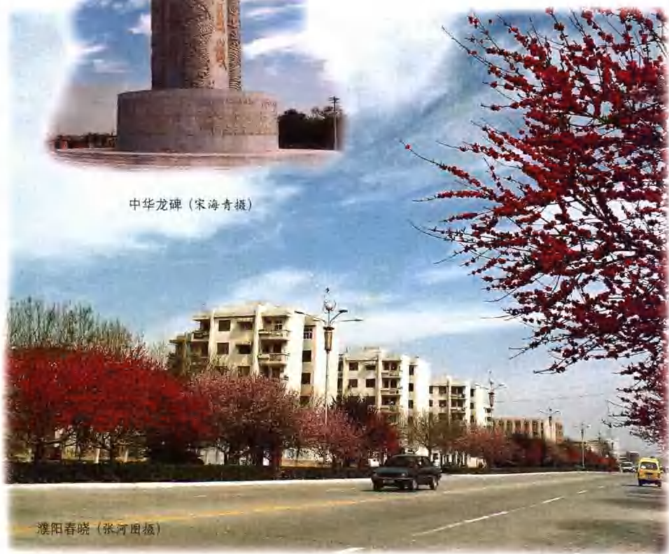
濮阳春晓