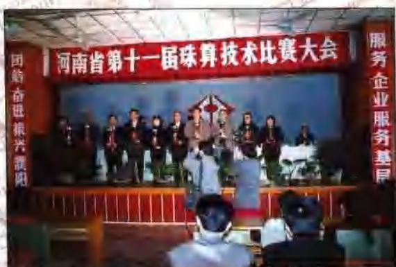
河南省第十一届珠算技术比赛大会在濮阳市召开