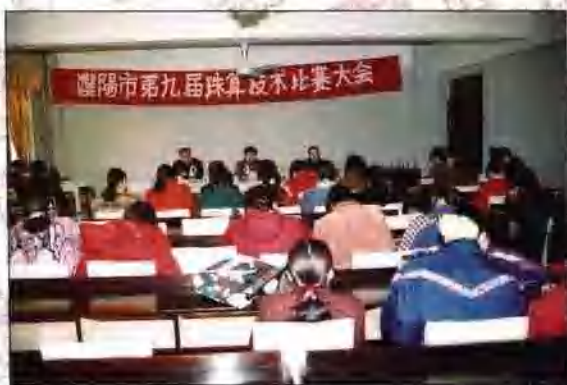
濮阳市第九届珠算技术比赛大会