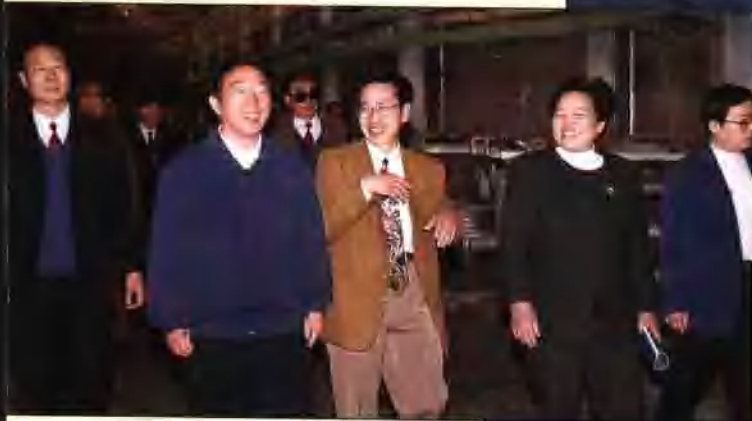
市人大主任吴贵增（右五） 深入工厂调查研究，指导工作