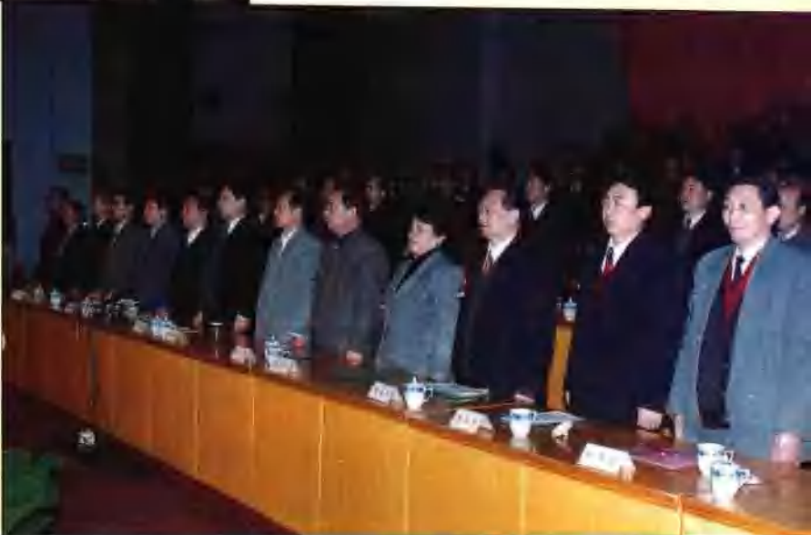
濮阳市第三届人民代表 大会第四次会议开幕式