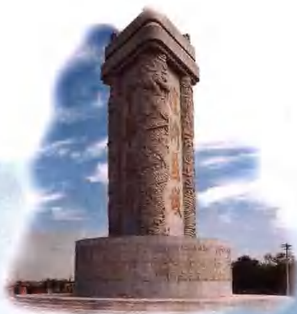
中华龙碑