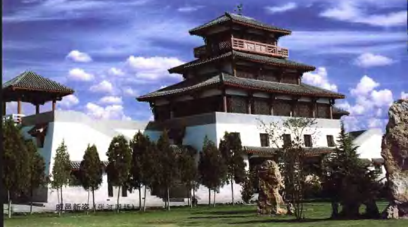
殿邑新姿