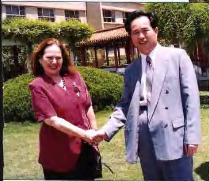
市长黄廷远会见以色列国雷霍沃特市副市长玛丽