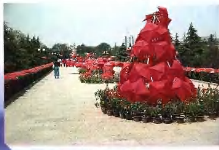
大地正红