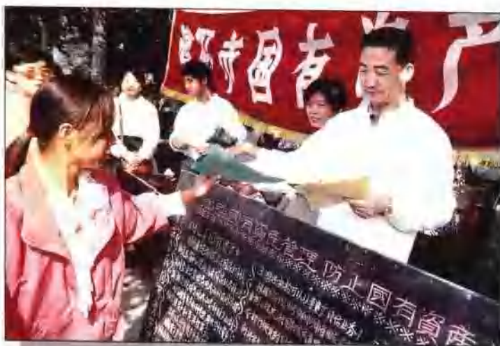
国有资产宣传月活动