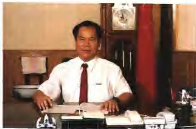
党组书记、院长杨克信

1996年两级人民法院坚持“两手抓，两手都要硬”的方针，紧紧围绕经济建设这个中心，充分发挥审判职能作用，依法从重从快判处了一批严重刑事犯罪分子，促进了社会稳定；审理了大量民事、经济纠纷案件，消除不安定因素，促进了市场