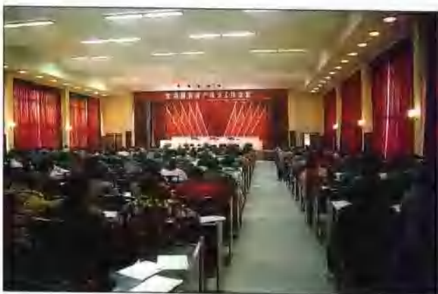
全市国有资产统计工作会议