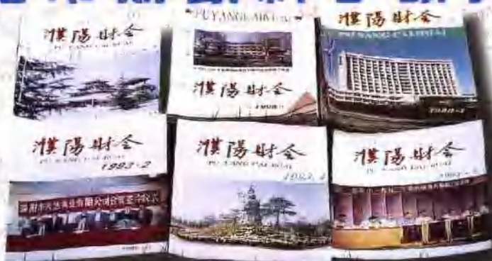
由该所主办的《濮阳财会》

市财政科研所是负责全市财政科研，财政学会、会计协会、珠算协会工作的正科级事业单位，成立于1990年，编制5人。