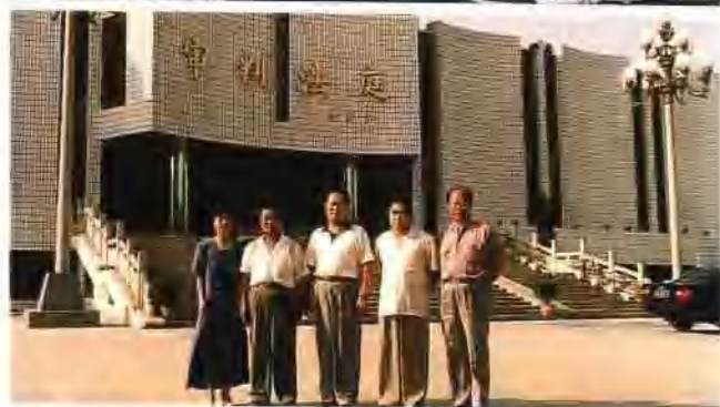
濮阳市中级人民法院领导班于（左起：副院长吴华、宋荣道、院长杨克信、副院长张兴武、纪检书记张秋月）

1996年两级人民法院坚持“两手抓，两手都要硬”的方针，紧紧围绕经济建设这个中心，充分发挥审判职能作用，依法从重从快判处了一批严重刑事犯罪分子，促进了社会稳定；审理了大量民事、经济纠纷案件，消除不安定因素，促进了市场