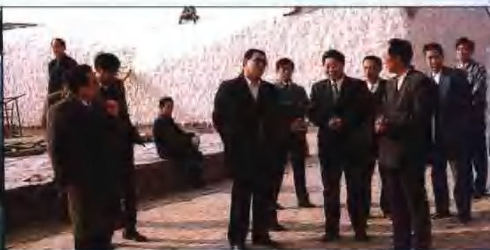
副市长李秀生(右七)在濮阳县检查棉花收购工作