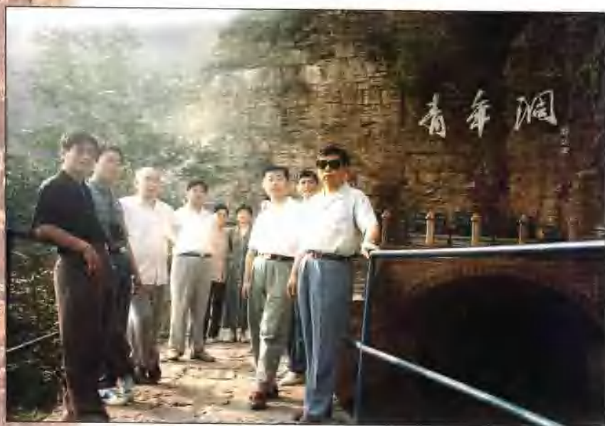
参观红旗渠青年洞学习林县人民艰苦奋斗精神

濮阳市财政局狠抓财源建设，努力增收节支，使市财政状况有了较大的改善，财政实力明显增强。1996年全市财政收入完成50116万元，首次突破5亿元大关，比上年增长27.4%，实现了收支平衡。1991年以来连续被河南省委、省政府命名为省级“文明单位”。