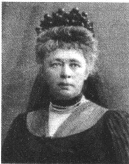
1905年获得诺贝尔和平奖的贝尔塔·苏特纳

贝尔塔的外公是一个想当诗人而又没当成的落拓之人，而且他那诗人常有的异端邪思，更是不被贵族社会所接纳。也许受诗人父亲的影响，贝尔塔的母亲的思想也非