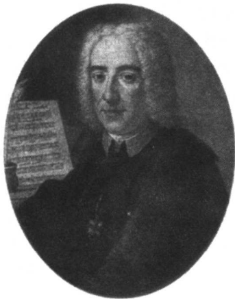
亚历山德罗·斯卡拉蒂的画像

1620 年意大利作曲家 A. 格兰迪在其独唱用的《康塔塔与咏叹调》中，首先运用此名以称呼他所作的与文艺复兴时期单音音乐一脉相承的独唱曲。17 世纪 40 年