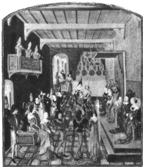
在乐师的伴奏下，勃艮第宫廷里的贵族们正在跳低步舞。

歌曲还可按它所起的作用，群众对它的熟悉程度以及演唱方式（由群众自己演唱或由演唱者演唱给群众欣赏）而分为两类：一类通称为群众歌曲，另一类通称为艺术歌曲。