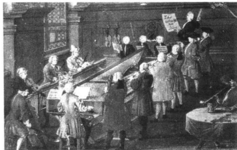
水彩画《清唱剧排练》（绘于1775年）

清唱剧的产生与13、14世纪的神迹剧或神秘剧有关，其正式形成则在16世纪末。在祈祷室中所唱的宗教歌曲劳达是清唱剧的直接来源。1600年在罗马演出的E. de 卡瓦列里的《灵魂和肉体的表白》，