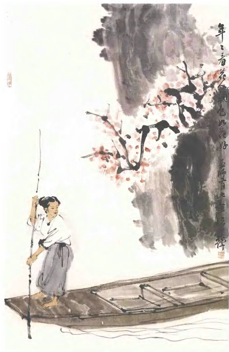
年年看花人 顏色如花好