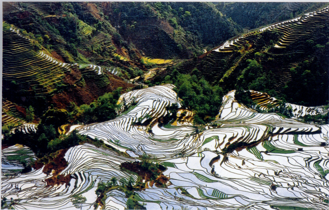
元阳·老虎嘴梯田