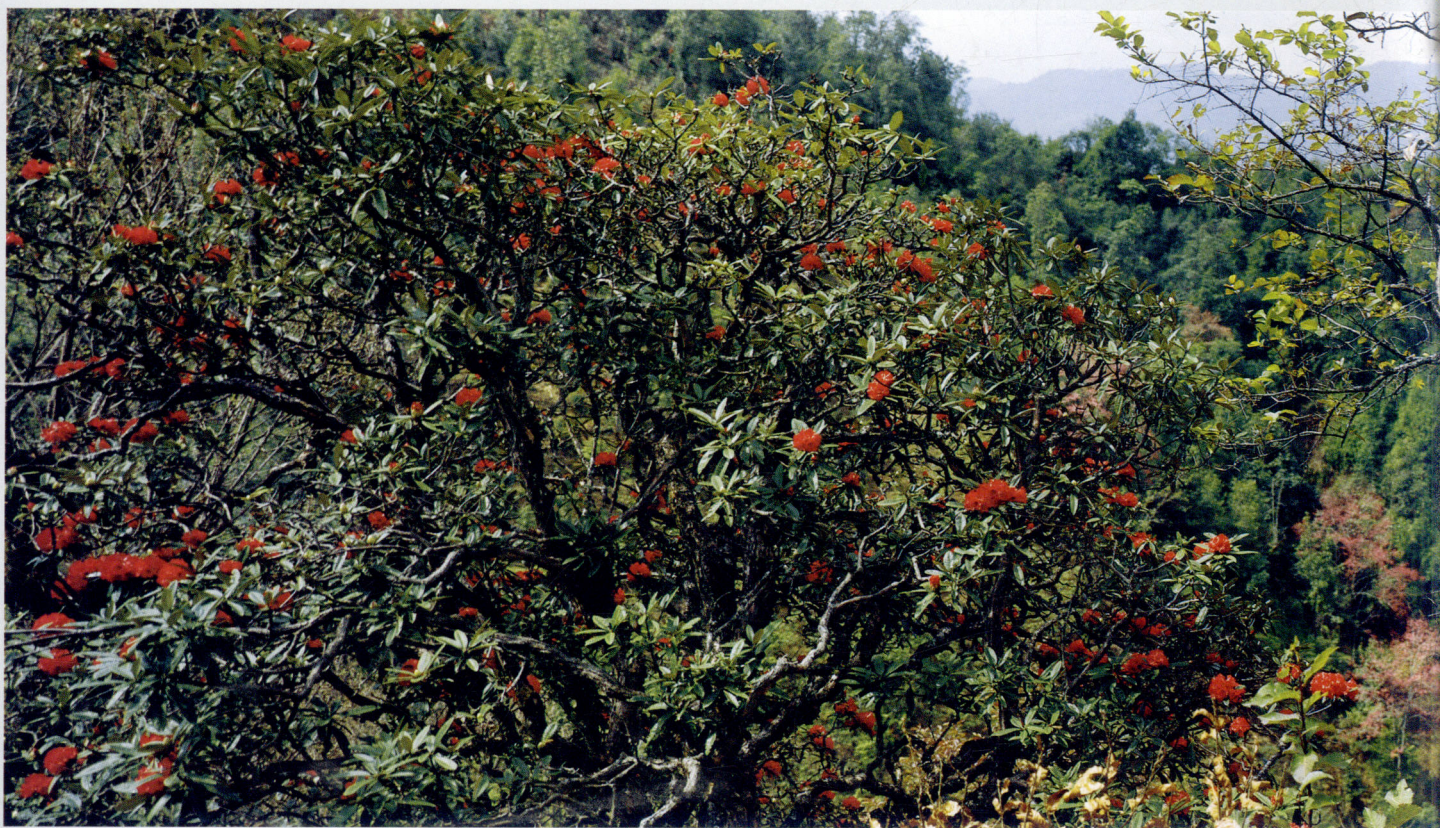
腾冲·茶花