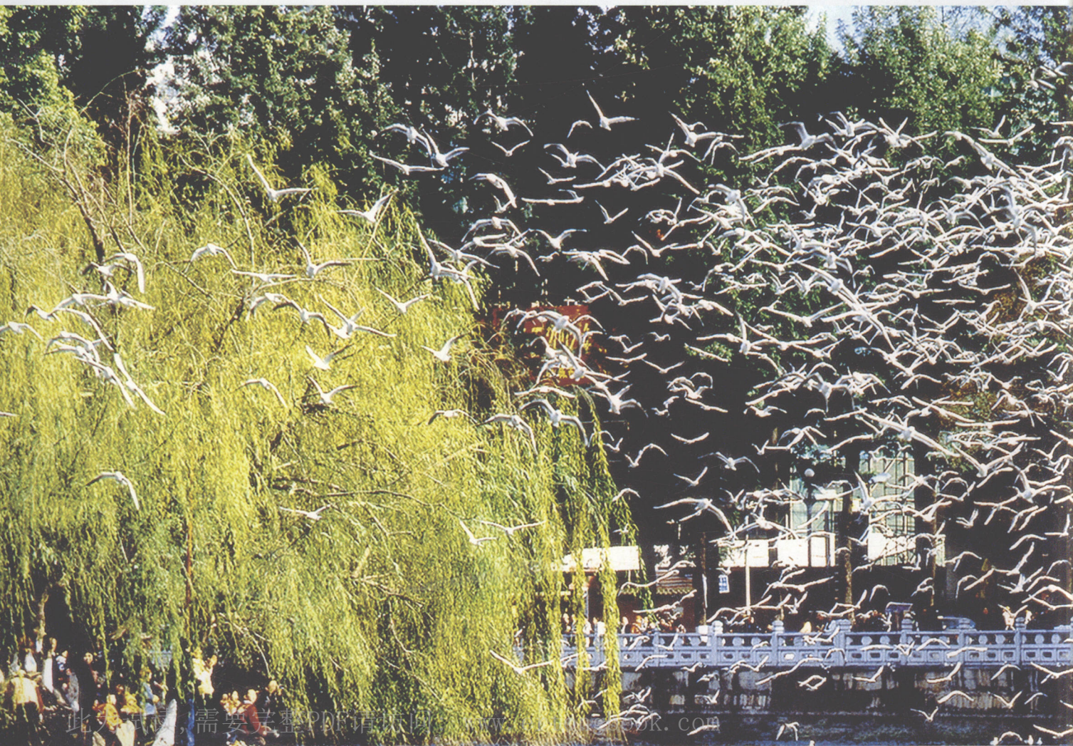
昆明·翠堤鸥湖似云行