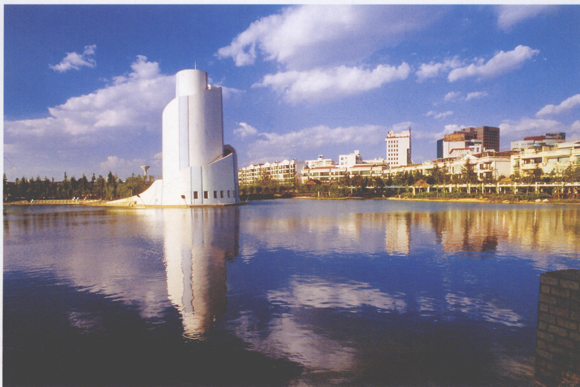
昆明·宝海公园 昆明摄影家协会会员 山峰