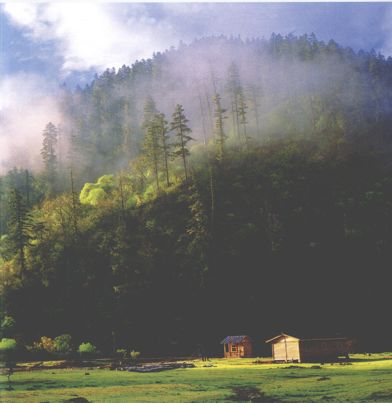
香格里拉·藏族民居