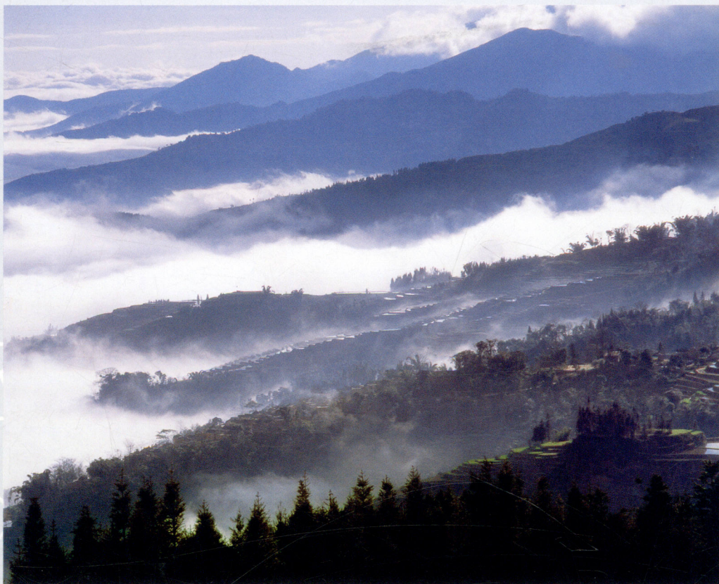
元阳·哈尼云海 云南省摄影家协会会员、昆明摄影家协会会员 窦维扬