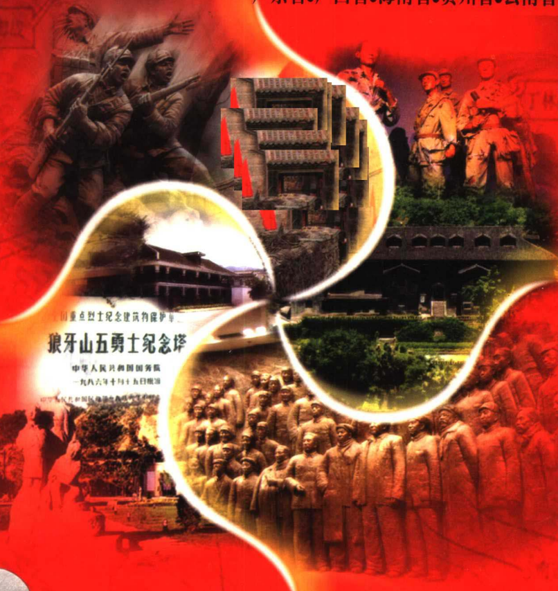
国家重点烈士纪念建筑物保护单位 狼牙山五勇士纪念碑 中华人民共和国国务院 一九八六年十月十五日颁布