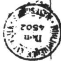
平板扫描仪位图模式扫描的敦煌文献之二 为使亮处的字迹清晰可读，暗光部位的字迹糊成一团。

也賦歛元度效傑元上形諫者並賢士是以山崩川涸 動不息野無百踰故世治即愚者不得獨亂世亂即 賢者不能獨治故聖人和愉寧生也志得道行命也故 生遭命而后能行命生而后能明必有其世然後 有其人 文子問聖智老子曰聞而知之聖也見 而知之智也聖人當聞禍福所生而擇道智者當見禍 福成形而擇行聖人知天道吉凶改知禍福所生智者先 見成形故知禍福也聞未生聖也先見成形智也元聞見者愚也 老子曰君好知則信時而任己棄姦不用思物博知