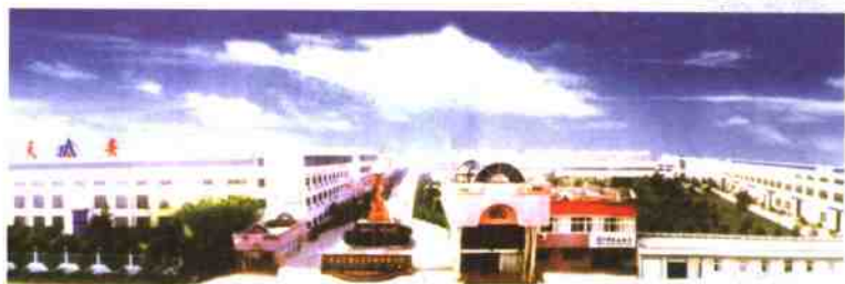
天安集团园区一角

丹东、丹西街道工业基础较好,科技实力雄厚,拥有输变电、电子、电器、针织服装、机械模具、食品加工等数百家工业企业,著名的有国家重