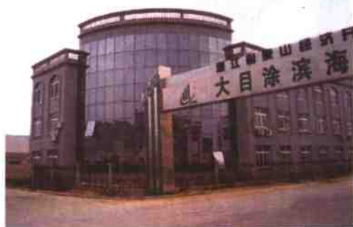
大目涂滨海工业园区

东陈工业还十分重视产业链的延伸。2004年富宏公司成功并购新疆沙雅恒棉业公司,形成了从棉花收购到成衣出口的一条龙生产体系。健鹰公司除生产成衣外,又开发了袜子生产线。2004年,这两家企业均跻身全国针织企业50强。