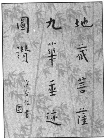
▲弘一法师所书《地藏菩萨九华垂迹图赞》

六日，晴暖，晚半阴，五十六度。断食正期第一日。八时起床。三时醒，心跳胸闷，饮冷水桔汁及梅茶一杯。八时起床，手足乏力，头微晕，执笔作字殊乏力，精神不如昨日。八时半饮梅茶一杯。脑力渐衰，眼手不灵，写日记时有误字，多遗忘。九时半后精神稍可。十时后精神甚佳，口渴已愈。数日来喉中肿烂亦愈。今日到大殿去二次，计上下廿四级石级四次，已觉足乏力，为以往所无。是日共饮梨汁一个，桔汁二个。傍晚精神不衰，较胜昨日，但足乏力耳。仍时流鼻涕，晚间精神尤佳。是日不觉如何饥饿。晚有便意，仅放屁数个，仍无便。是夜能安眠，前半夜尤稳安舒泰。眼前以棉花塞耳，并诵神人合一之旨。夜间腿痛已愈，但左肩微痛。七时就床，梦变为丰颜之少年，自谓系断食之效。