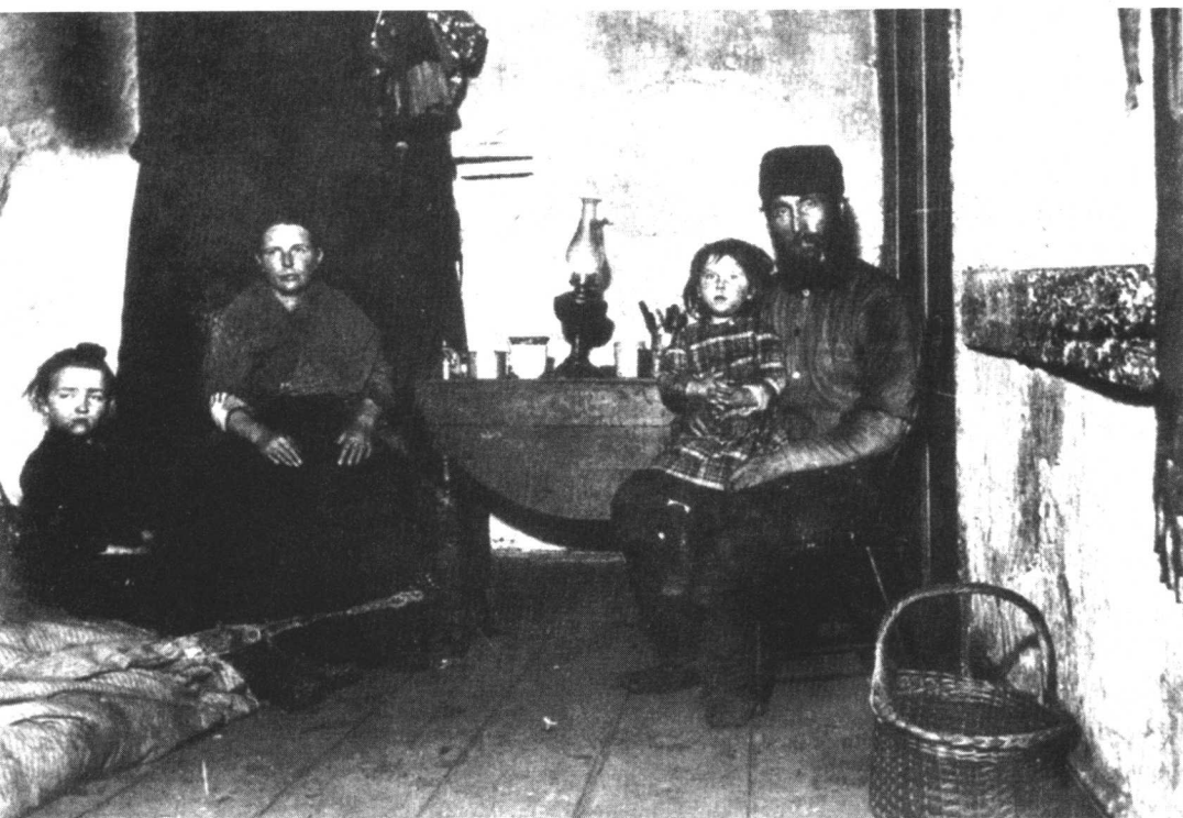
美国是梦想的开始，也是生存奋斗的开始。移民们必须在美国找到工作和住所。 此图是欧洲移民，1900年摄于纽约的。