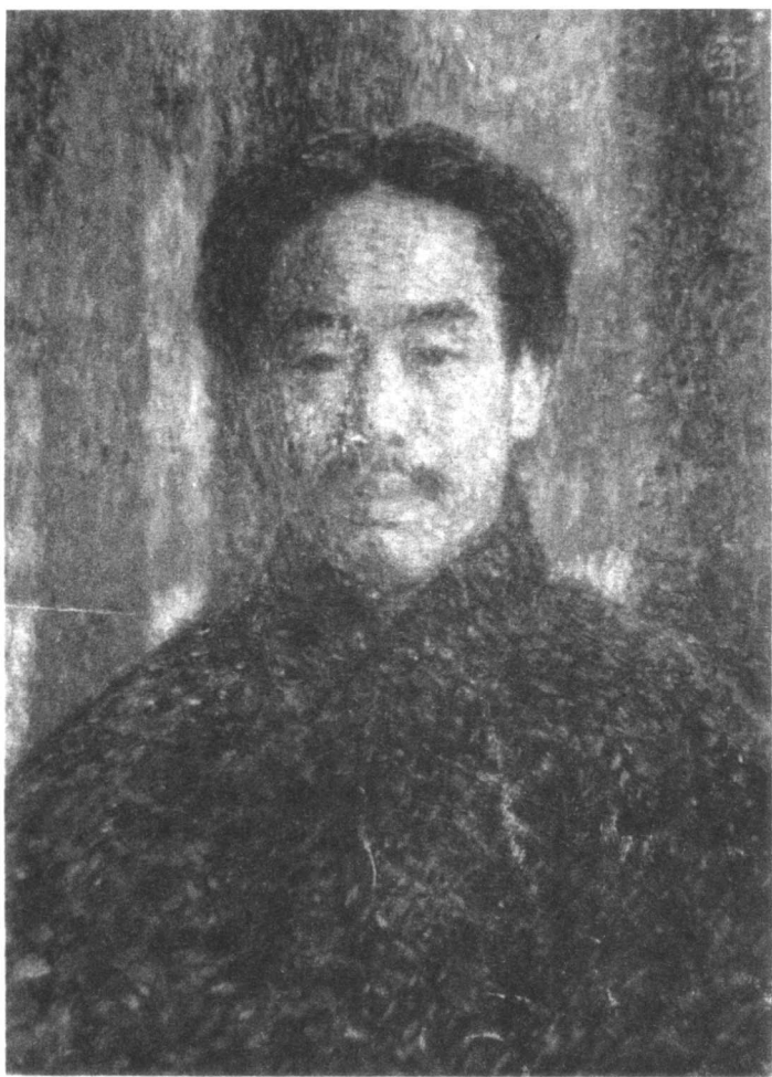
李叔同自画像（油画）