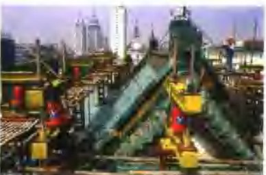
集团公司承建的安徽省图书馆主楼仿古屋顶整体提升技术改造工程造价获合肥市建筑工程“装饰杯”奖