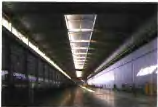
集团公司承建的南京浦镇车辆厂铝合金车体及总装厂房获全国优秀焊接工程奖