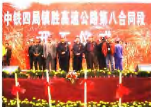
由集团电气化公司承建的国家重点工程沪(上海)-瑞(金)国道主干线贵州省境内镇(宁)胜(镇关)高速公路八标和二十四标段于10月18日相继开工建设