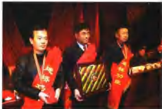
由于卓越的项目管理绩效和突出的建设成果，集团公司杭州湾跨海大桥经理部荣获全国“五一”劳动奖状