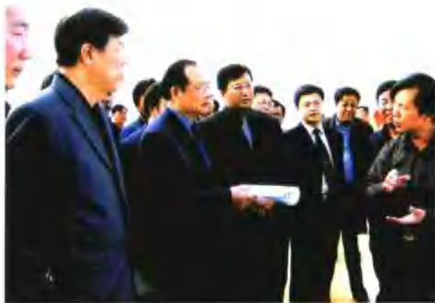
5月11日，铁道部副部长陆东福在集团公司总经理戴和根陪同下 检查武九铁路中铁四局集团工地