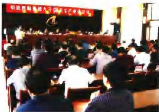
8月29日，集团公司开展了大干120天活动，提出了“双百亿”的奋斗目标