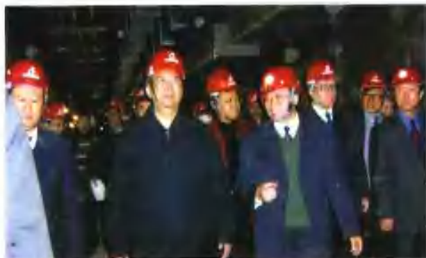
元月26日，中共中央政治局委员、国务院副总理曾培炎视察集团公司深圳地铁工程工地