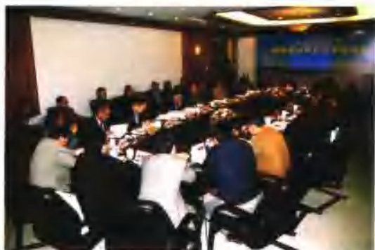
4月16日，集团公司承办的杭州湾跨海大桥南浔超长桥论证会在宁波召开