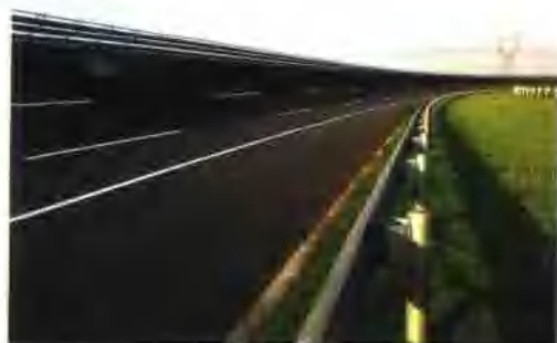
集团公司承建的上海大众汽车试跑高速环道工程获中国建筑工程施工奖