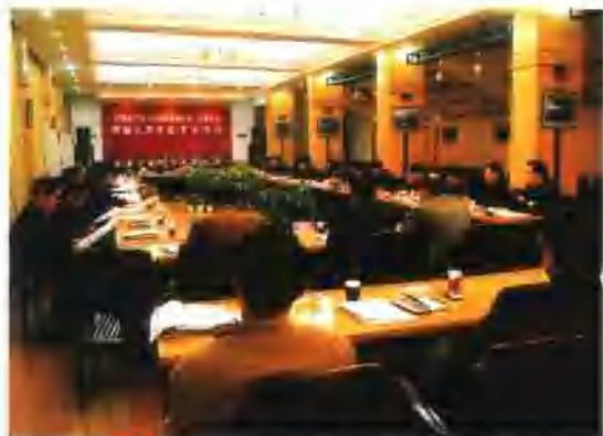
2月26日，集团公司党委在合肥召开了四届六次全委(扩大)会议