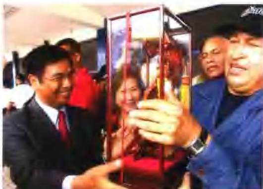
集团公司承建的委内瑞拉铁路大修工程，深受委内瑞拉政府的高度关注。图为查韦斯总统亲临现场视察