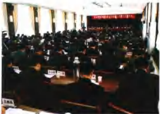
2月25日-27日，集团公司合肥召开了首届三次职工代表大会