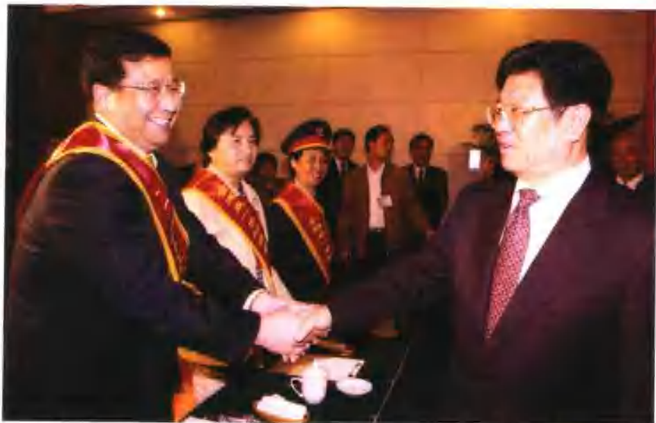
4月26日，集团公司总经理戴和根作为安徽省唯一的荣获“全国‘五一’劳动奖状”先进集体代表出席了在北京人民大会堂召开的“庆祝‘五一’国际劳动节”大会，受到了中共中央政治局委员、全国人大常委会副委员长，中华全国总工会主席李建国等中央领导的亲切接见。