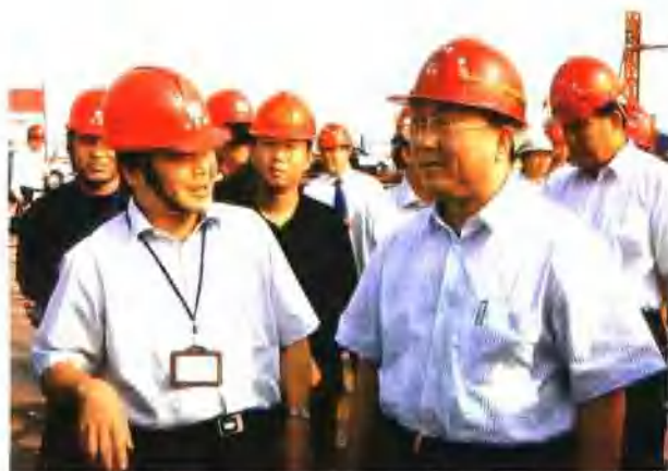
8月2日，中国科学院院长路甬祥在宁波市委常委、杭州湾跨海大桥工程指挥长王勇陪同下视察大桥建设工地 杭海桥