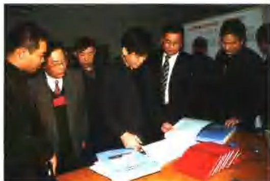
12月，国家统计局视查司司长及凤祥一行到集团公司机关检查经济普查工作