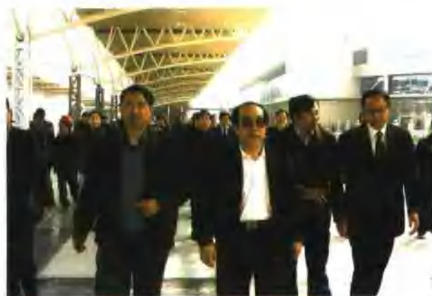
3月16日，铁道部部长刘志军在江苏省、上海铁路局、宁启铁路公司、扬州市及有关方面主要领导陪同下视察中铁四局集团电气化公司参建的扬州站铁路建设，充分肯定了电气化公司电力工程的质量