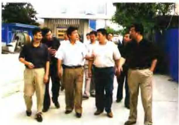
9月13日，中国铁路工程总公司总经理秦家铎视察中铁四局集团 八分公司安徽省合肥技术培训工地