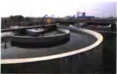
集团公司承建的巢湖污水处理厂一期工程获安徽省建筑工程“黄山杯”优质工程