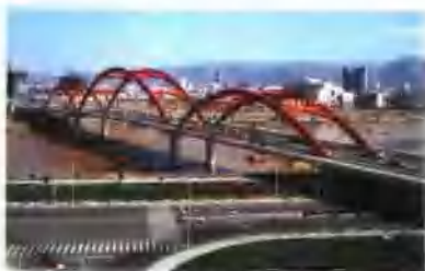
集团公司承建的兰州雁滩黄河大桥工程获全国优秀焊接工程奖