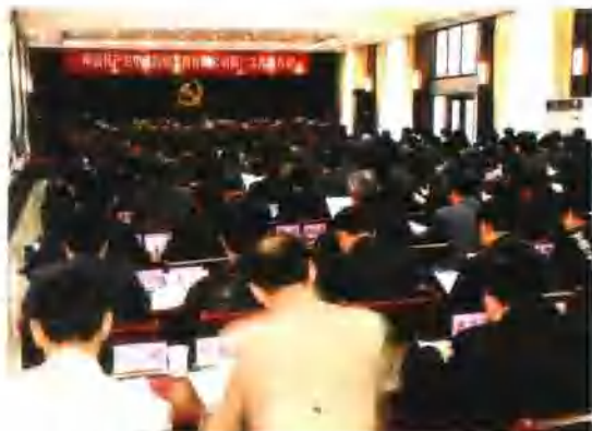
12月2日，中国共产党中铁四局集团有限公司第一次代表大会在合肥隆重召开