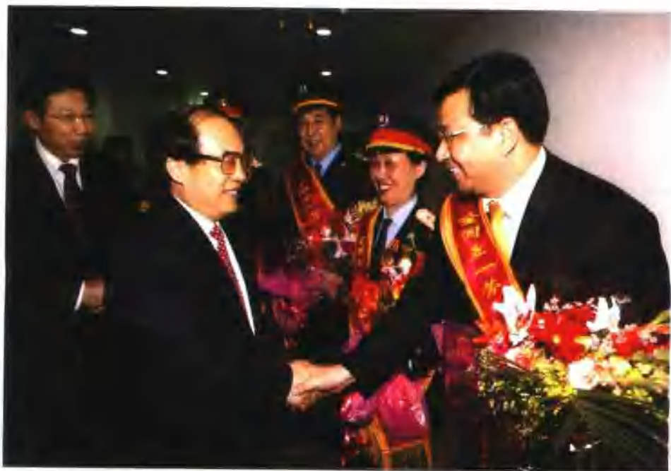
4月29日，铁道部召开了铁路系统出席“庆祝‘五一’国际劳动节”的先进集体和个人代表座谈会，铁道部部长刘志军，副部长陆东福、孙永福，王秉成和全国铁路总工会主席黄四川等领导与集团公司总经理戴和根等先进集体和个人代表进行了亲切交谈。