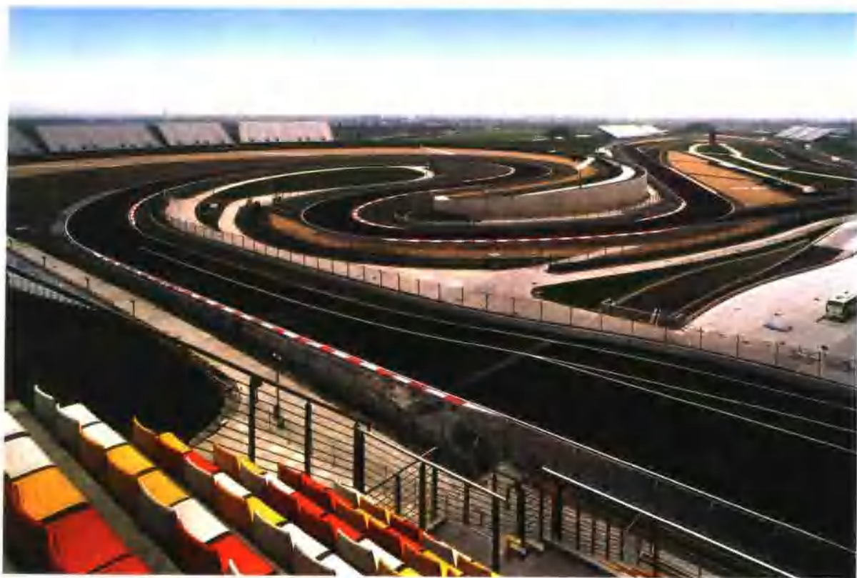
集团公司承建的具有世界先进技术水平的上海F1国际赛车场自竣工以来承办了大型国际赛车比赛，获得了国内外专家的好评