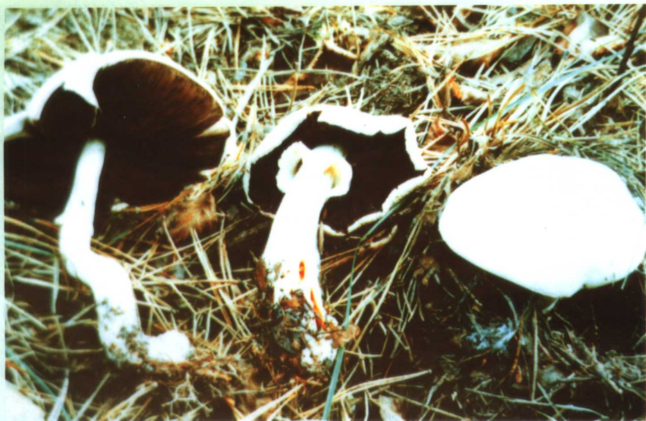
25. 蘑菇