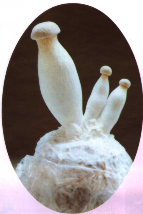
4. 白阿魏蘑 (白灵菇)