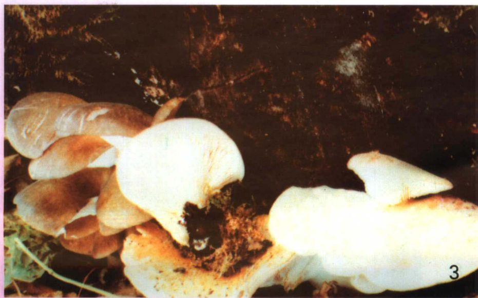
8. 元蘑