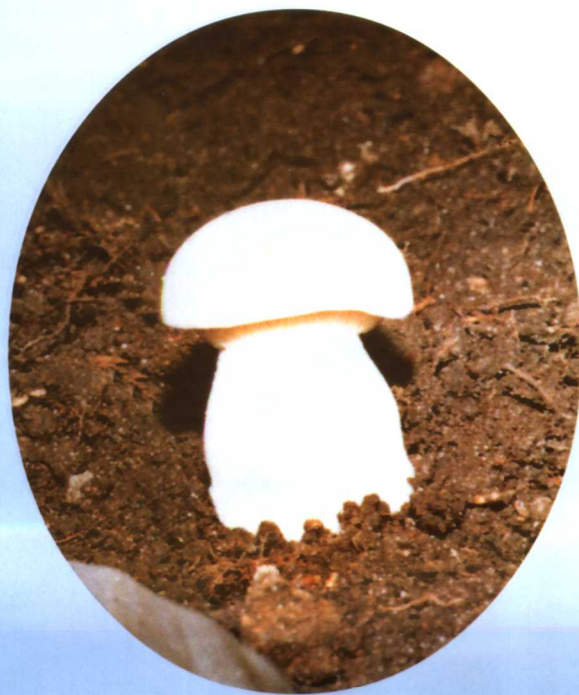
12. 蒙古口蘑