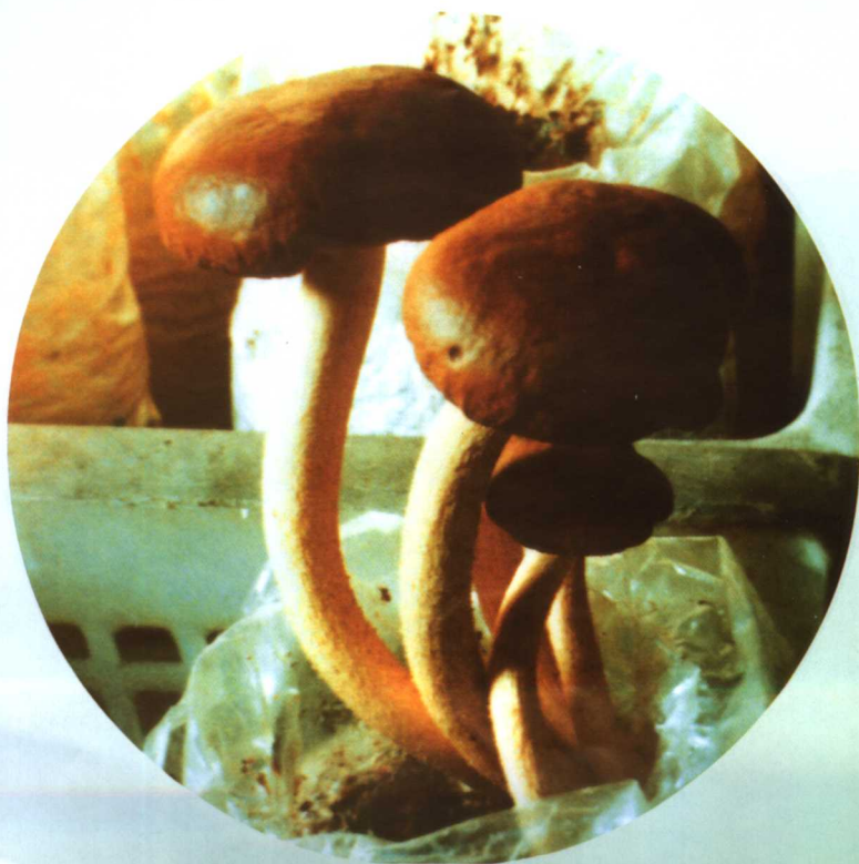
26. 大球盖菇