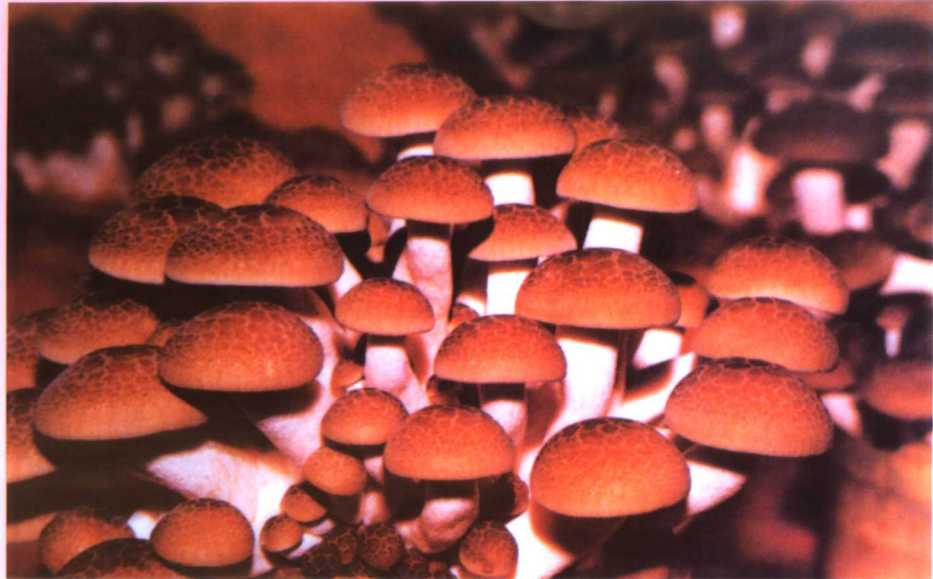
9. 玉蕈