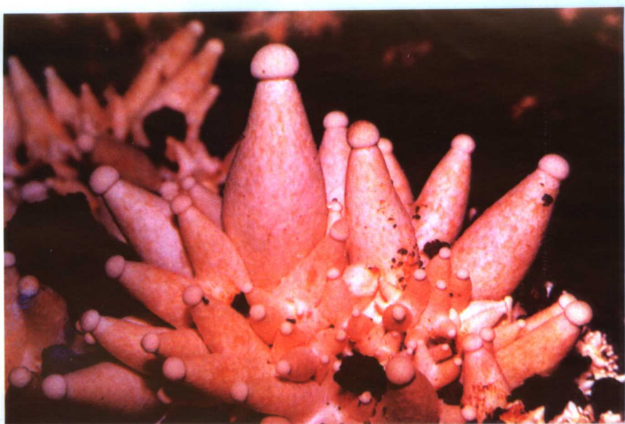
15. 巨大口蘑