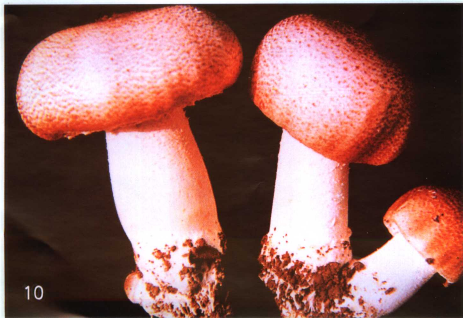
22. 巴西蘑菇