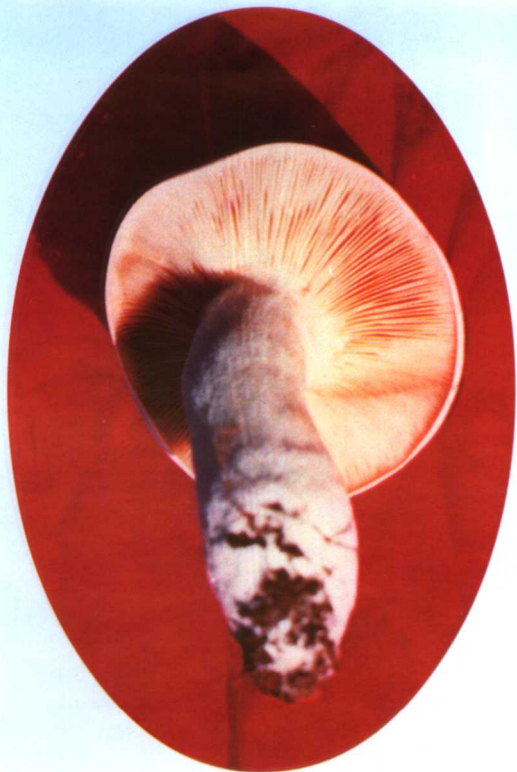
13. 香杏口蘑