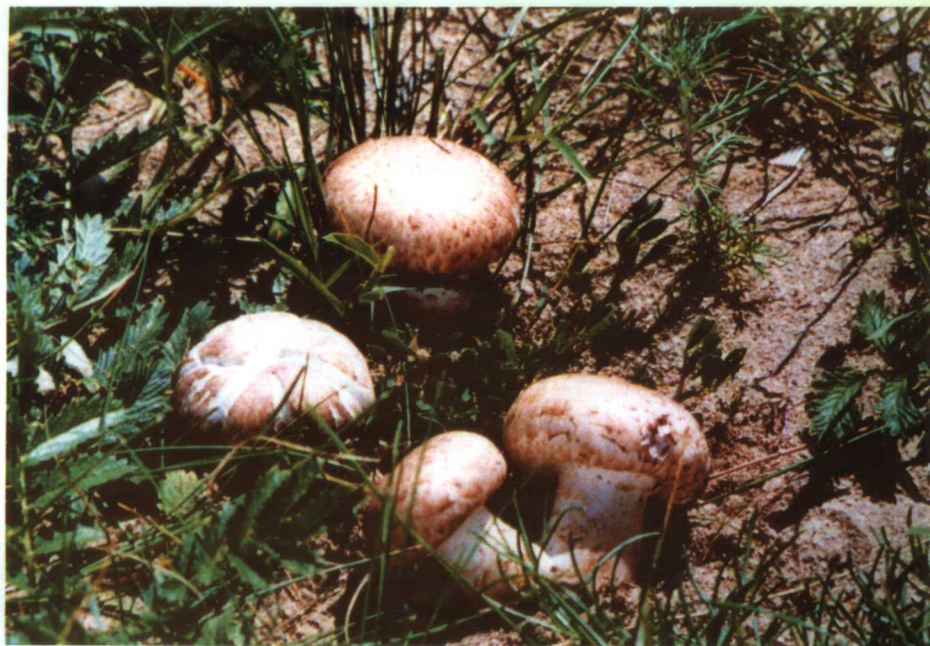
23. 褐蘑菇