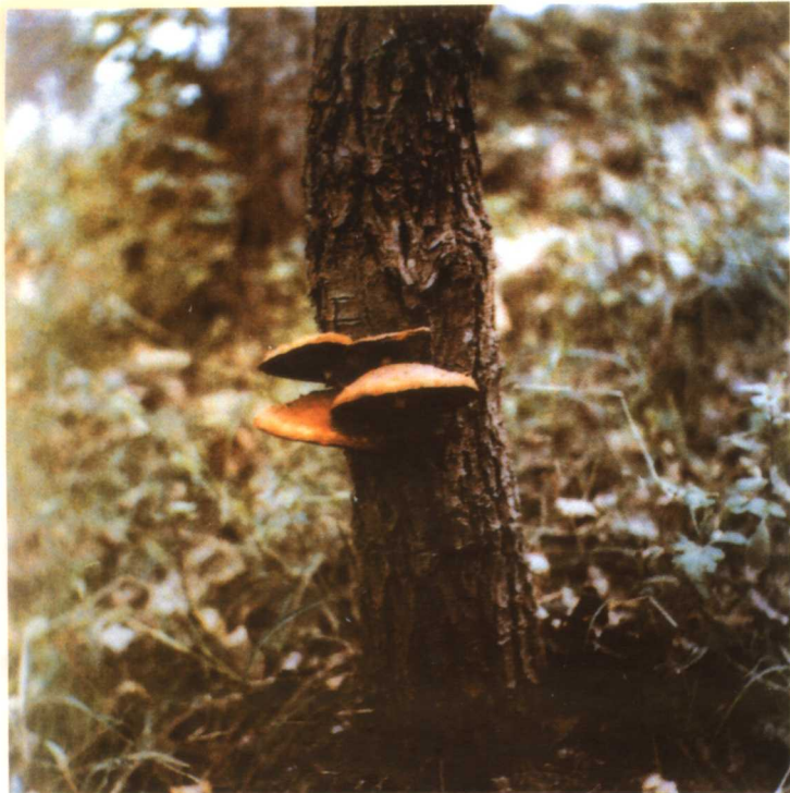
29. 杨树菇