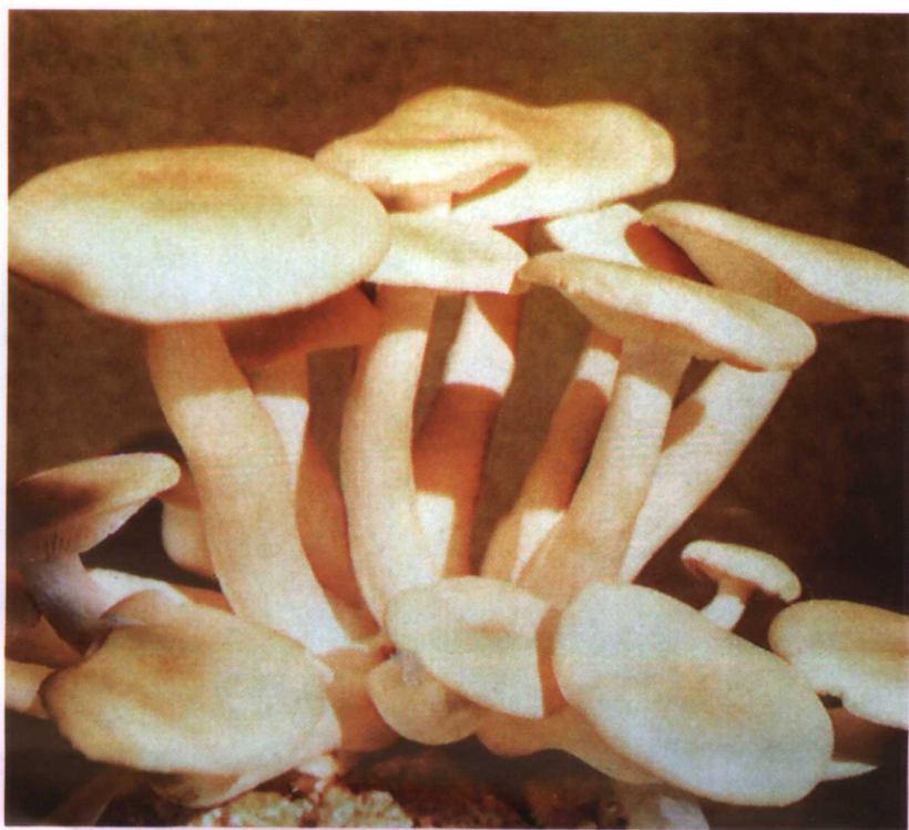
10. 榆干离褶伞