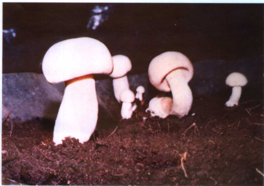
14. 大白桩菇