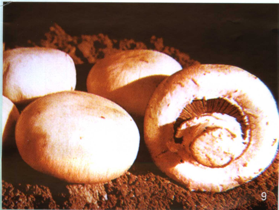
20. 大肥菇