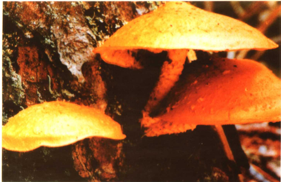
27. 黄伞