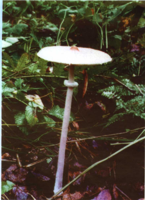
17. 高大环柄菇