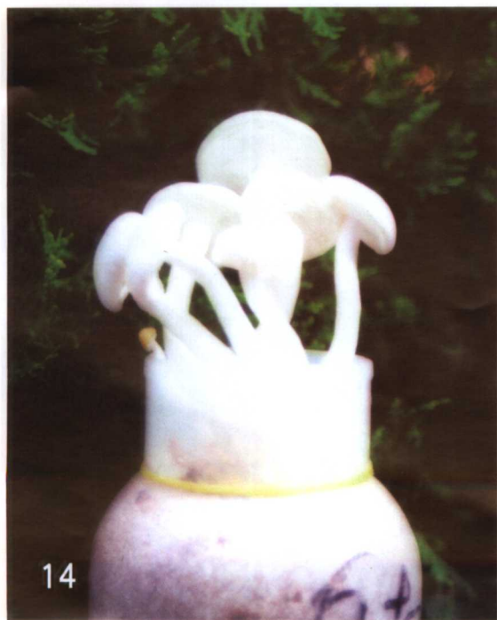
30. 白杨树菇