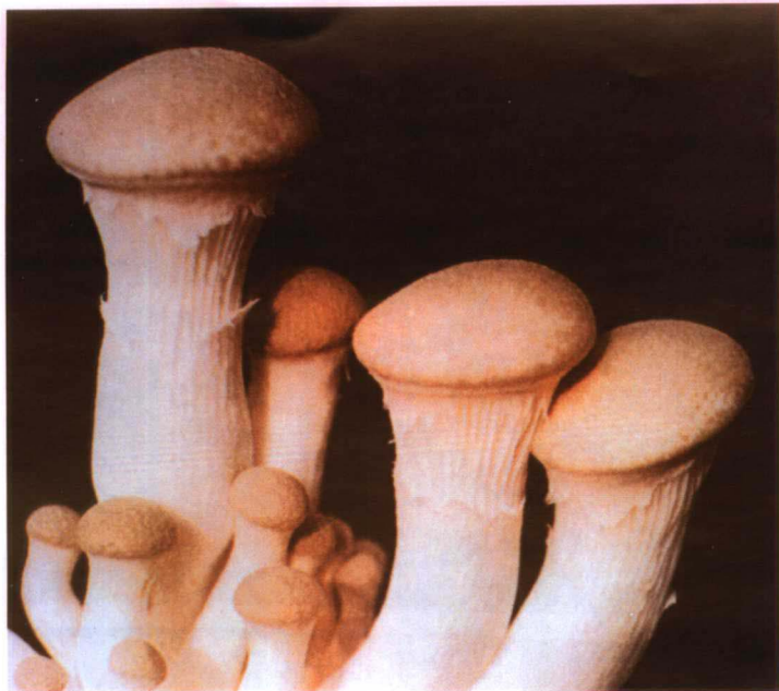
7. 幕仙菇