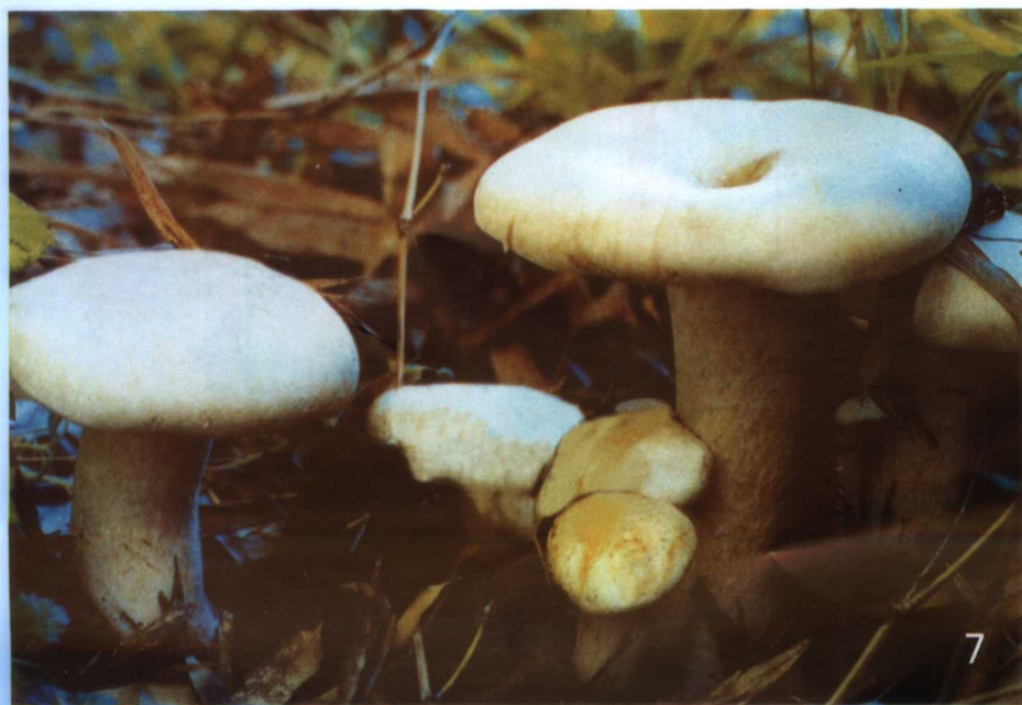
16. 大杯蕈