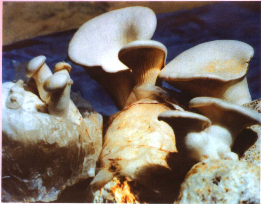
3. 白阿魏蘑