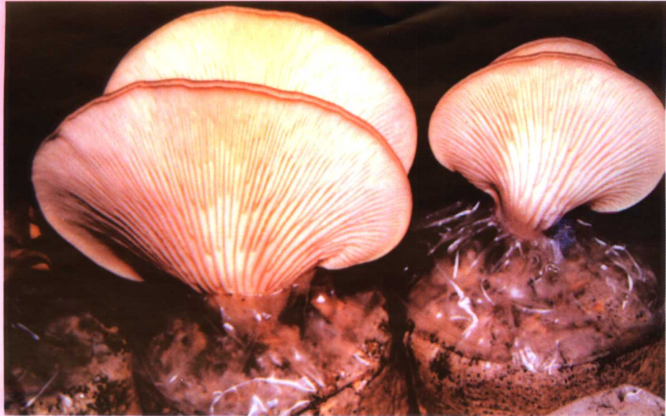
5. 鲍鱼菇