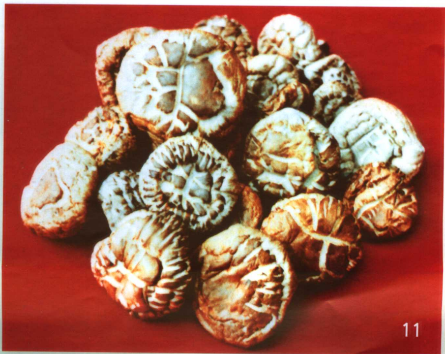
24. 褐蘑菇干制“花菇”