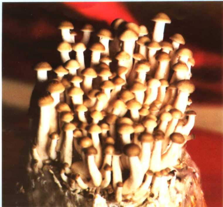
11. 灰离褶伞