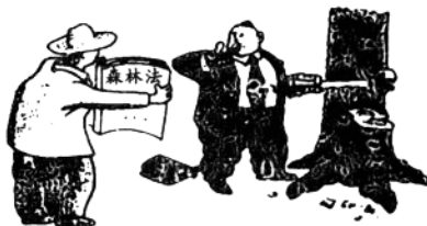
在这儿我说的就是伐(法)

15. (2002 年上海市) 据报道, 本市某居民在五楼阳台晒被子时, 不慎将夹在被子里的数万元钱撒落在马路上。路过这里的行人, 有