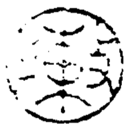
《青溪旧屋仪征刘氏五世小记》封面