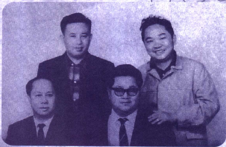
左上 卧龙生，前右 诸葛青云，右上 古龙。