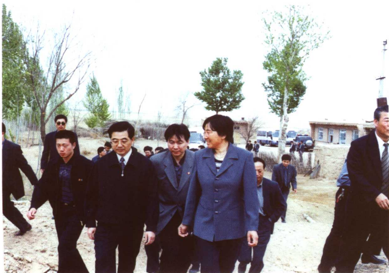
2001年5月5日,时任中共中央政治局常委、国家副主席的胡锦涛同志视察白春兰的林场,亲切地称白春兰是“国家治沙功臣”。