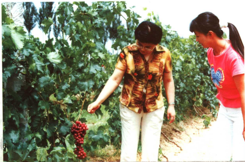
宁夏回族自治区副主席刘惠到海澜葡萄园参观指导。