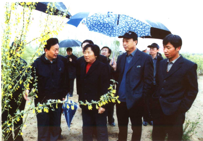
宁夏回族自治区党委书记陈建国同志到白春兰林场视察指导工作。