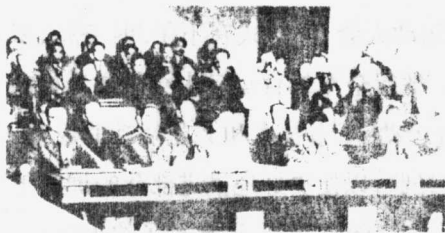
中国政府代表团在日内瓦会议上