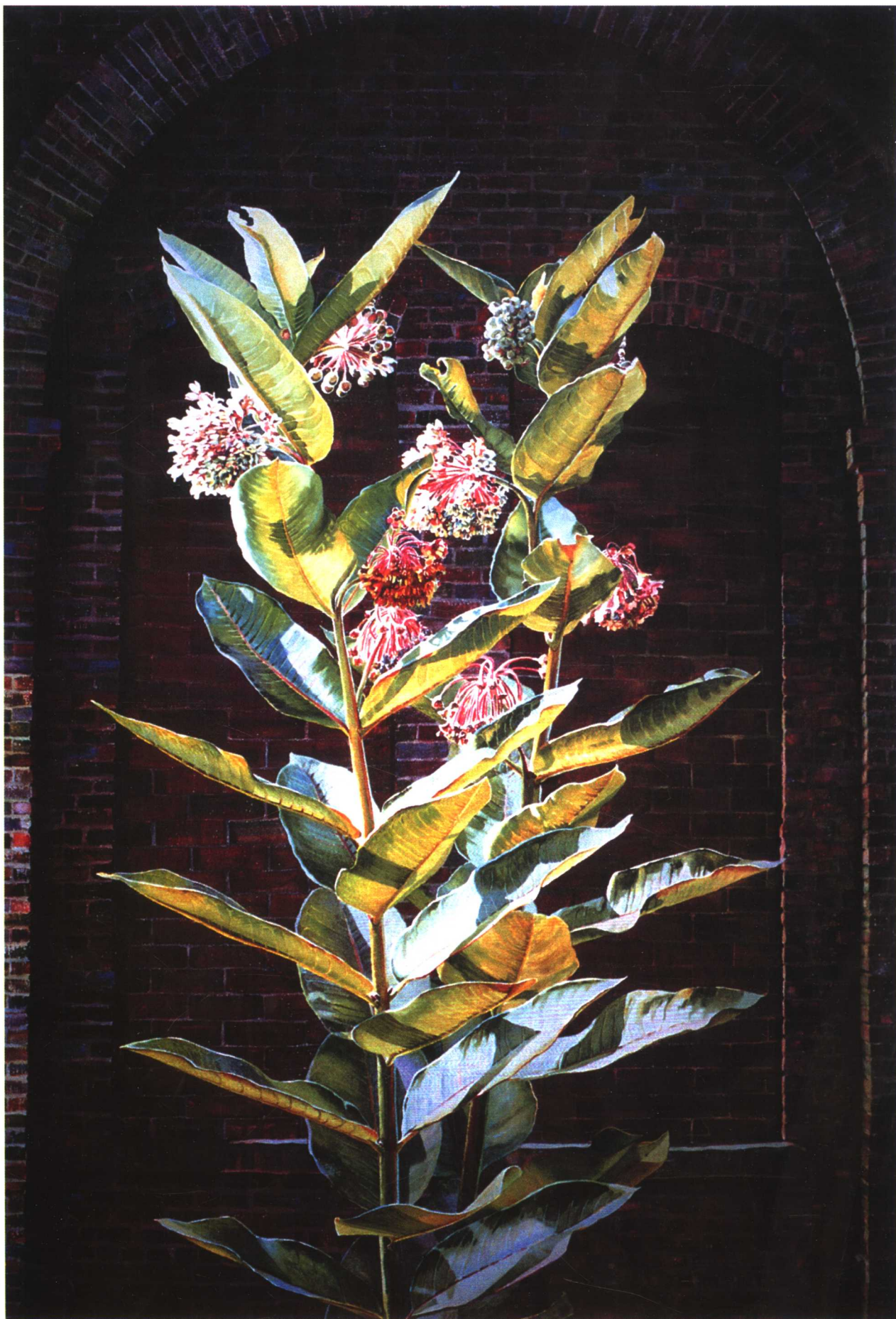
花和拱门 玛丽·洛·弗伯特 (美国)