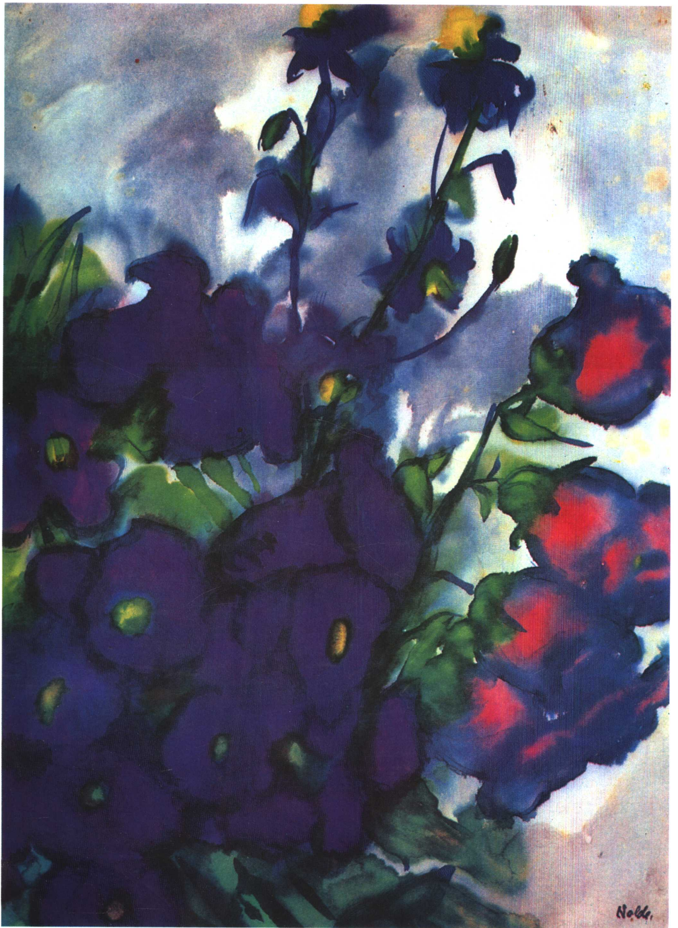
钟形花 艾米尔·诺尔德（美国）