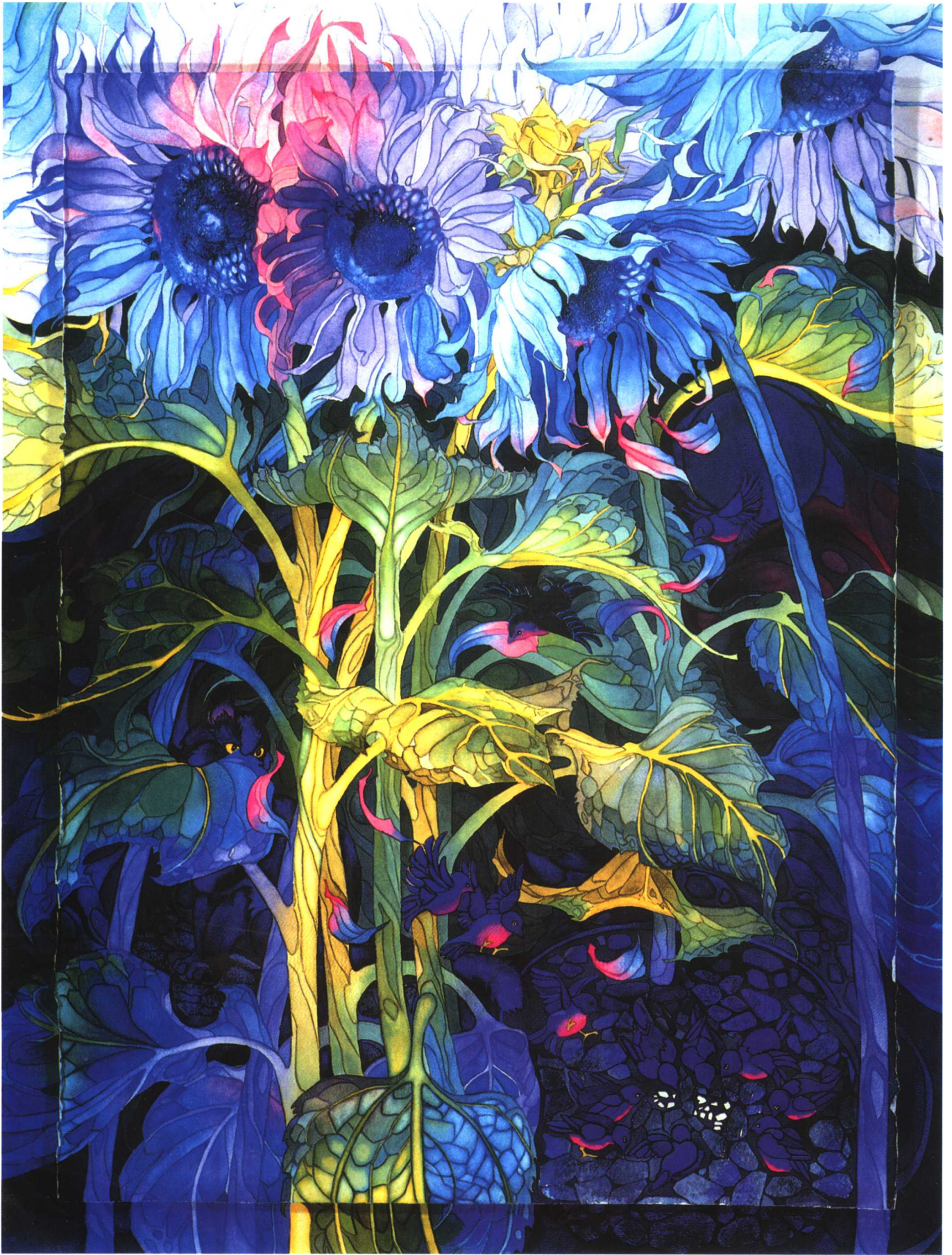
小夜曲 (96.5cm × 76.2cm) 伊丽莎白·格弗斯 (北美)