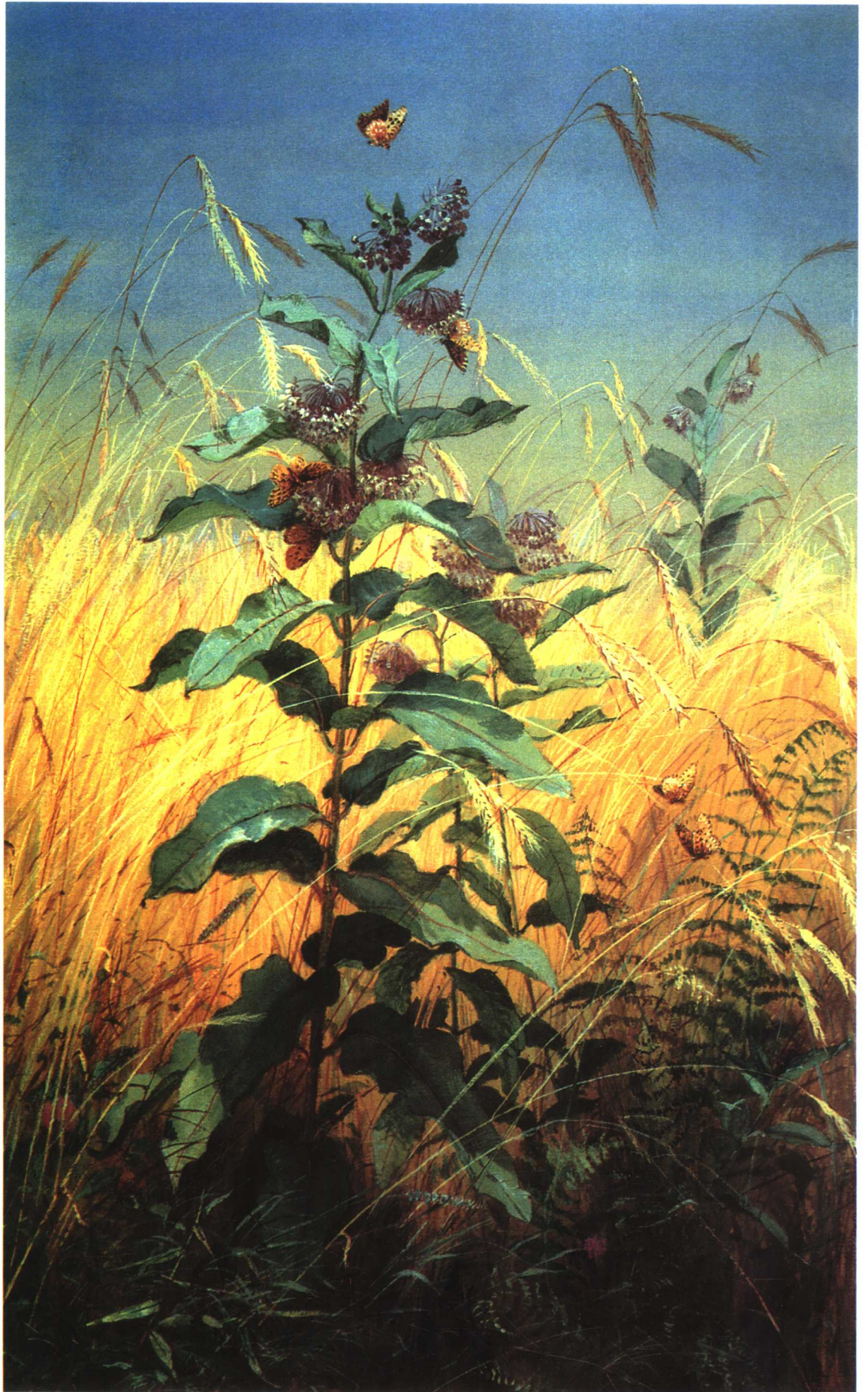
马利筋 (16cm × 9.5cm)