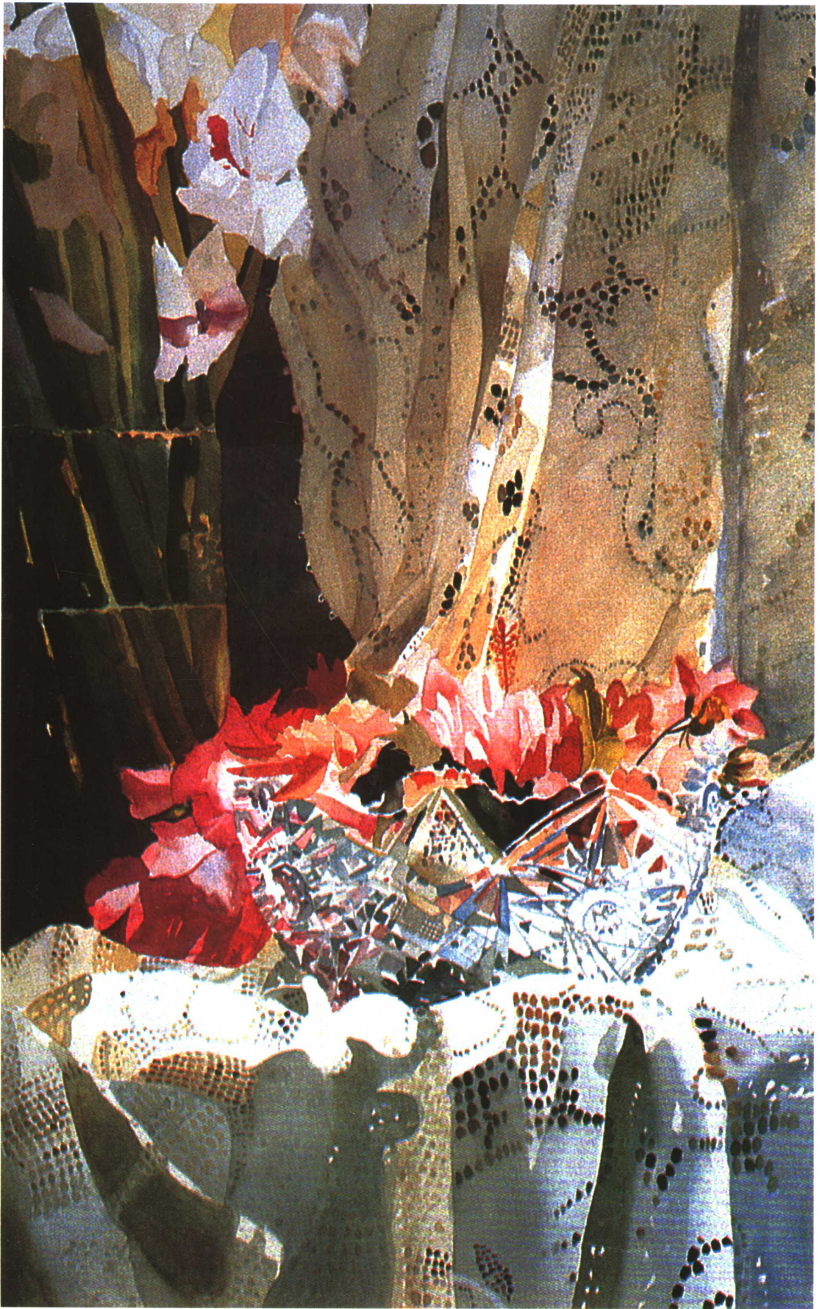
玻璃盆中的鲜花 (76.2cm X 55.9cm)