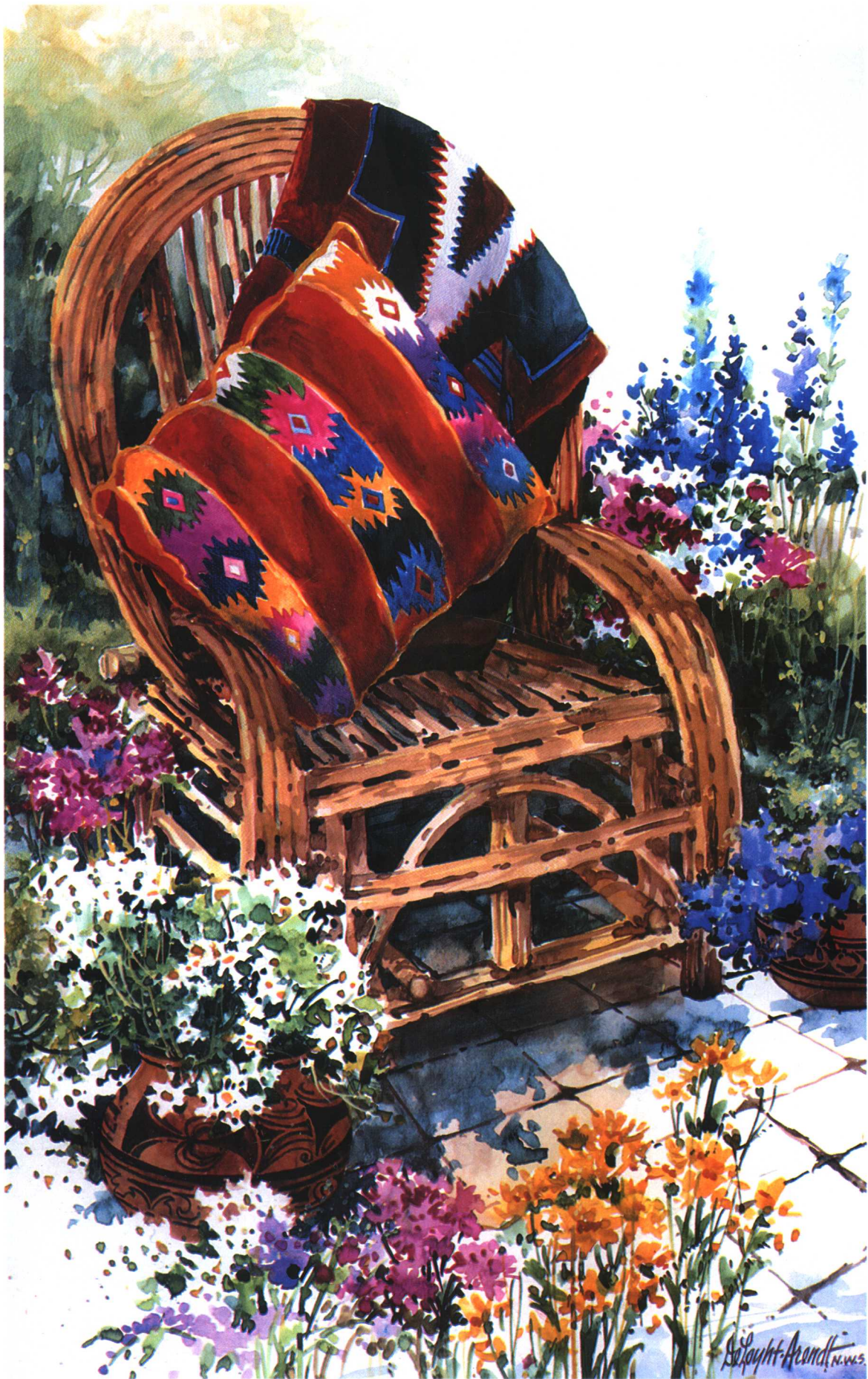
藤椅和缤纷的小花 (58.4cm × 35.6cm)