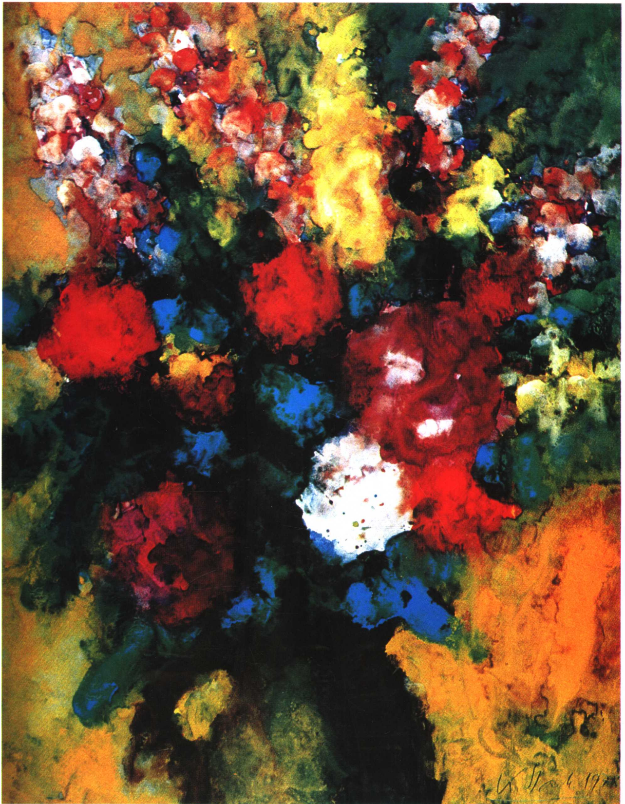
黄色背景的缤纷花朵 卡尔·史塔克