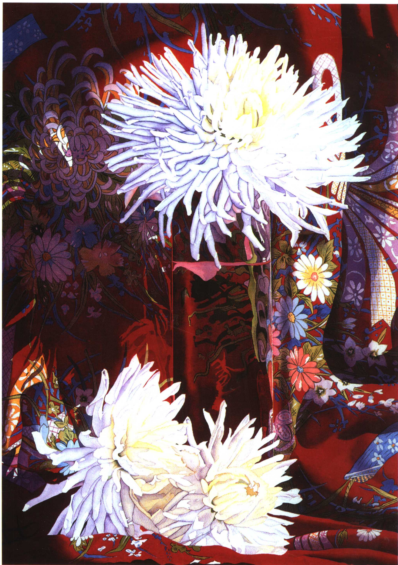
红丝绸与白色大丽花 (99.1cm × 71.1cm)