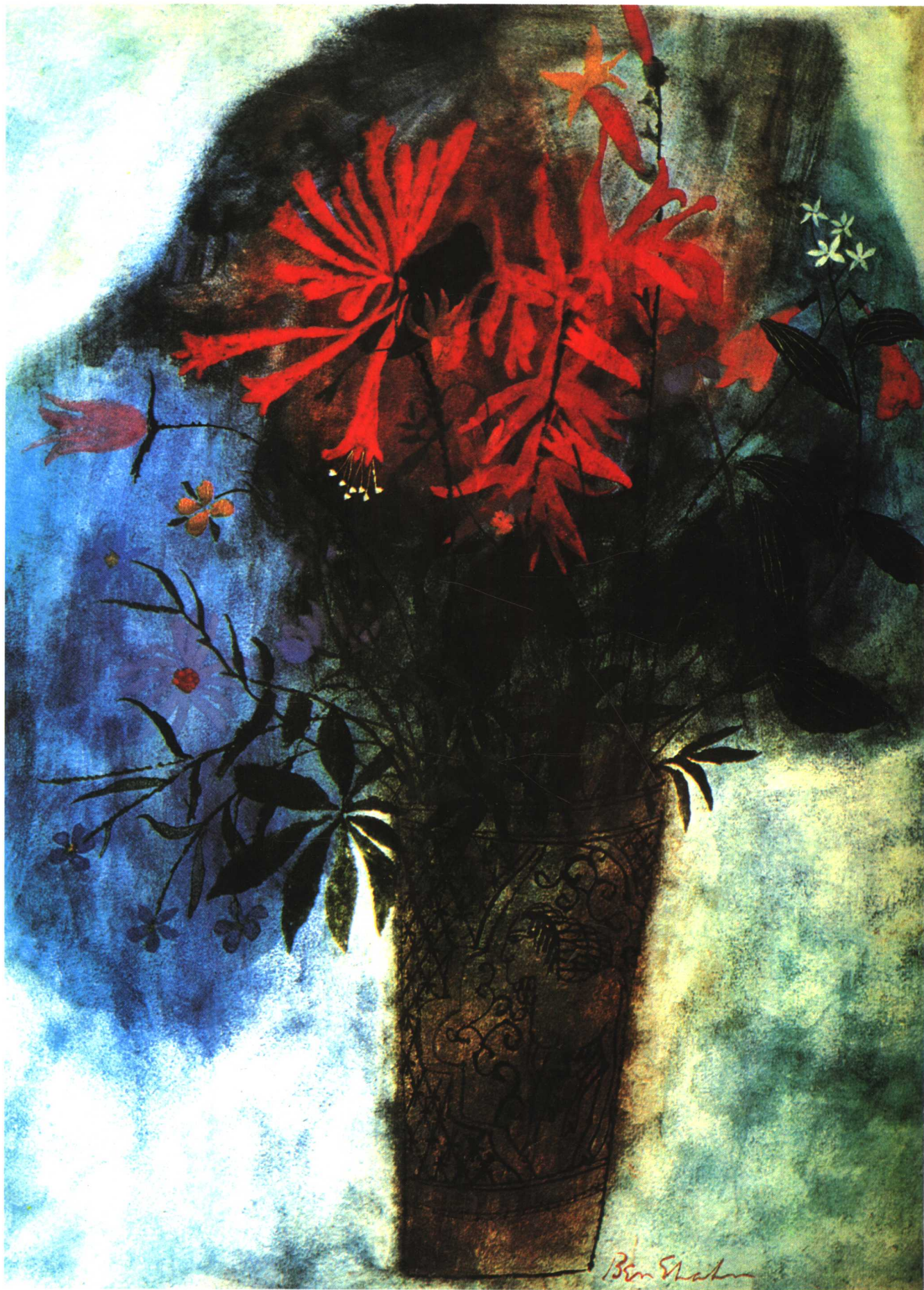
波斯花瓶静物 班·夏恩 (美国)