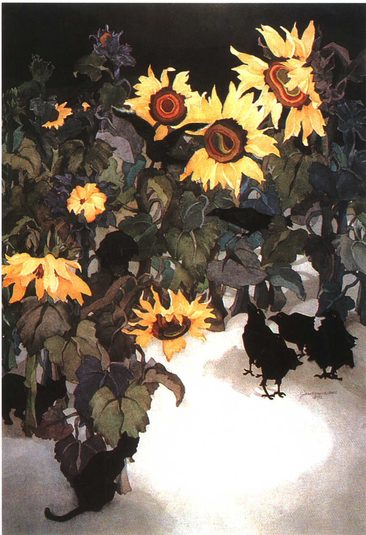
伺机而动 (76.2cm × 101.6cm) 珍妮特·B·沃什 (美国)