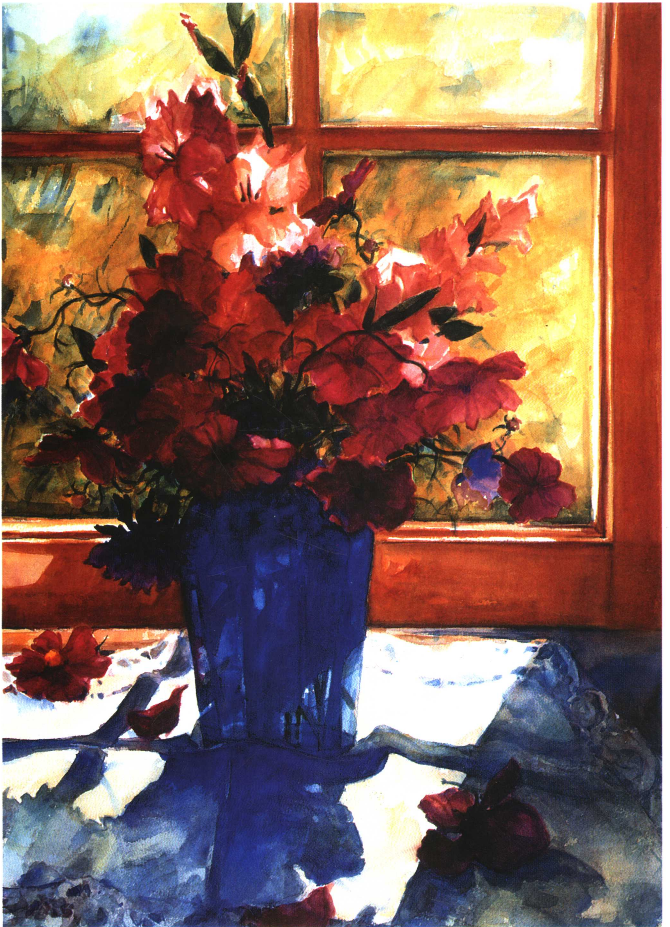
生意盎然 (54cm × 74.3cm)