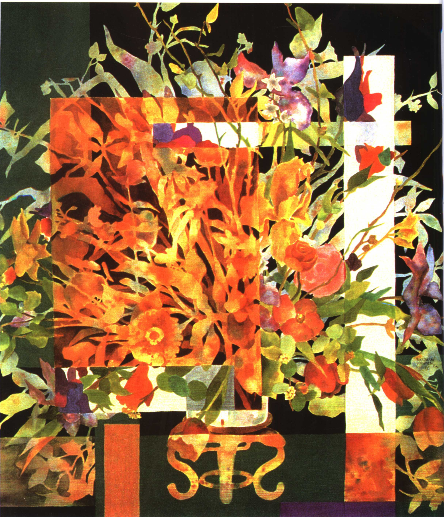
翡翠花园 芭芭拉·瓦格纳 (美国)