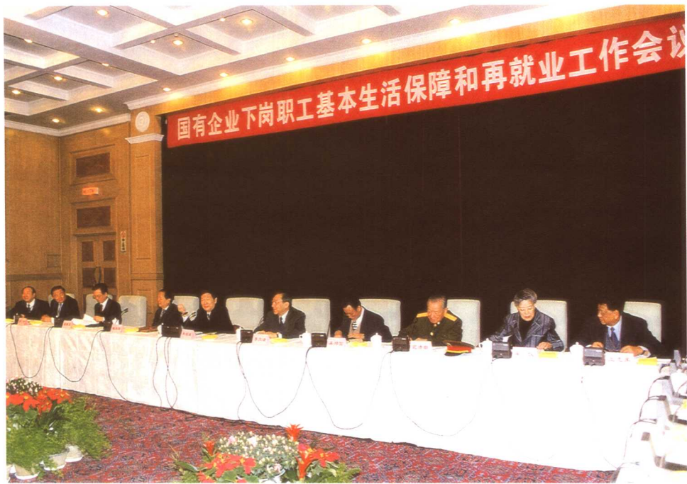
朱镕基、李岚清、钱其琛、吴邦国、温家宝、迟浩田、罗干、吴仪、司马义·艾买提、王忠禹等国务院领导出席国有企业下岗职工基本生活保障和再就业工作会议。