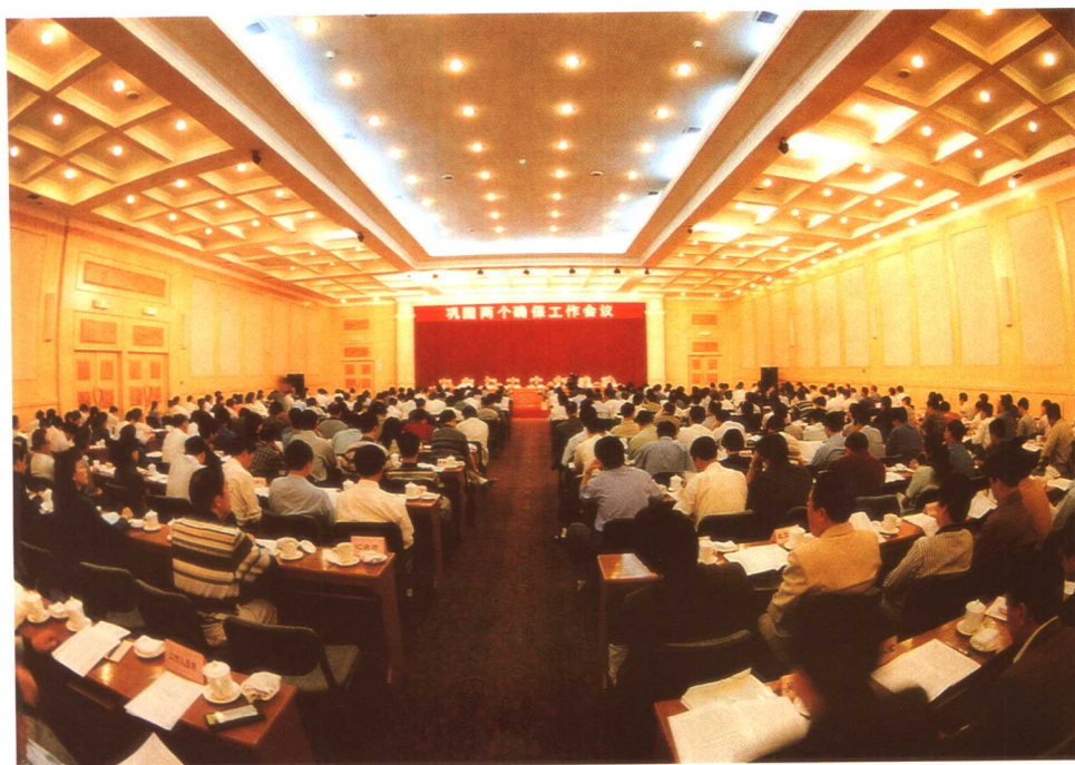
1999年5月23日至24日，劳动保障部、财政部在京联合召开巩固两个确保工作会议。图为会议场景。