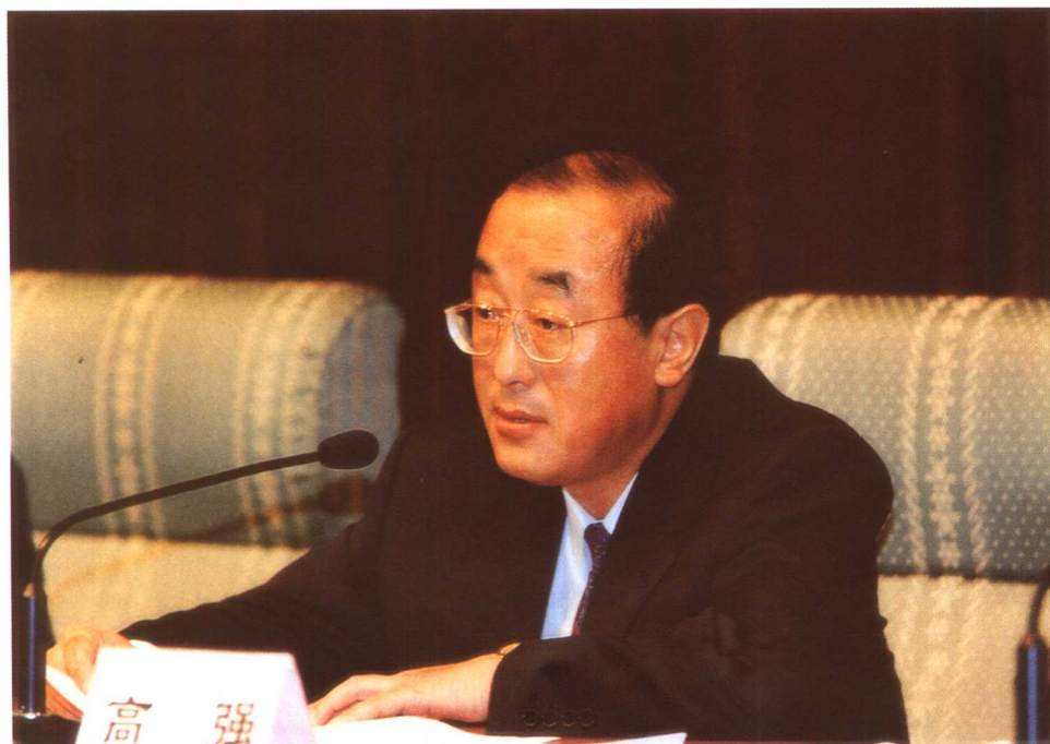
财政部副部长高强作题为《从国家和人民的根本利益出发全力实现两个确保》的讲话。