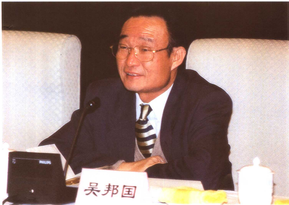
中共中央政治局委员、国务院副总理吴邦国在会上作工作报告。