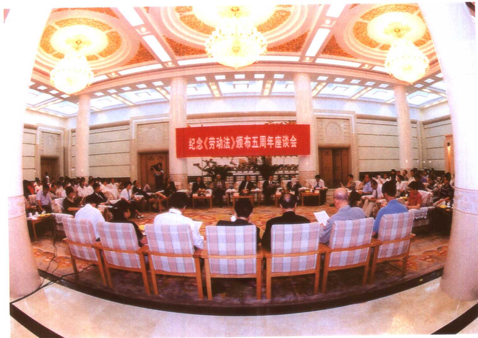
图为纪念《劳动法》颁布五周年座谈会场景。