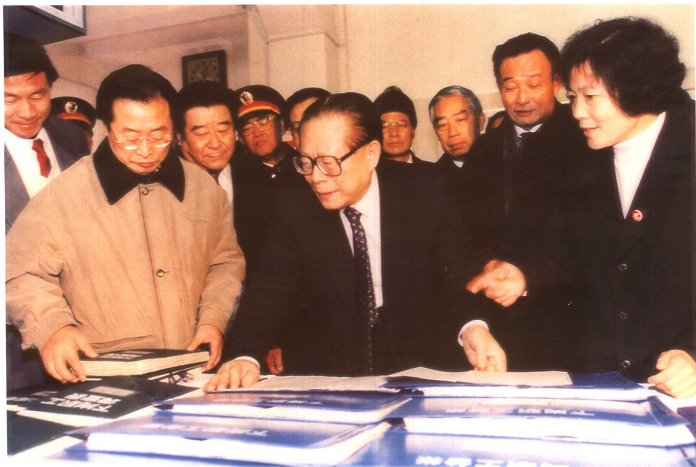
1999年1月28日至2月1日，中共中央总书记、国家主席江泽民在内蒙古自治区视察工作，先后到内蒙古一机厂、二机厂看望慰问下岗职工，视察了包头市东河区再就业服务中心、包头市再就业工程培训基地。图为江泽民总书记在吴邦国副总理的陪同下，视察包头市东河区再就业服务中心的情形。