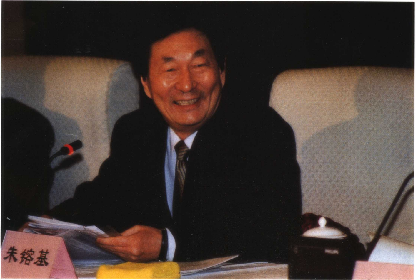
1999年1月12日至13日，国务院在北京召开国有企业下岗职工基本生活保障和再就业工作会议。图为中共中央政治局常委、国务院总理朱镕基在13日的闭幕会上同与会同志进行座谈并作重要讲话。