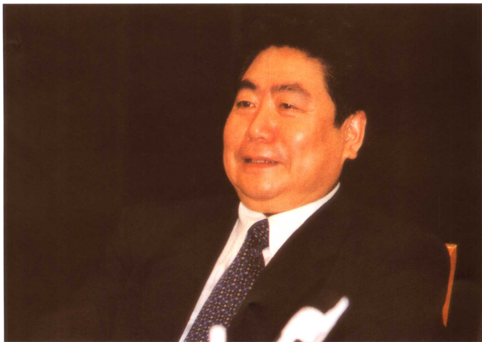
1999年7月22日，王东进副部长出席医疗保险配套文件出台新闻发布会并讲话。