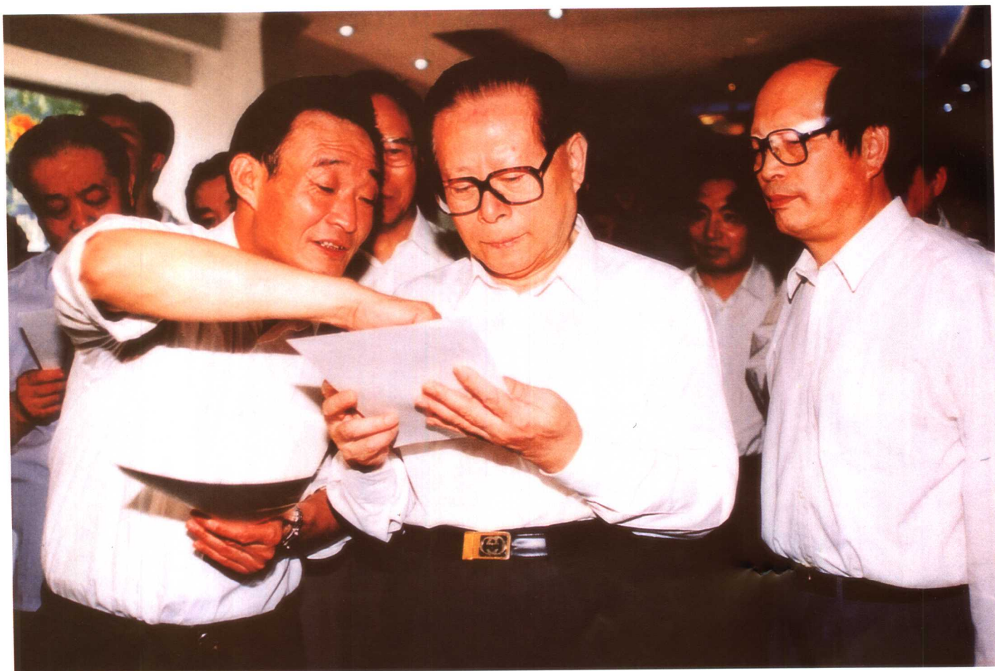
1999年5月28日下午，江泽民总书记到武汉劳动力市场，了解武汉市再就业工作及劳动力市场建设和管理情况，并与武汉市国有企业下岗再就业职工代表进行了座谈。图为江泽民总书记在吴邦国副总理的陪同下，在武汉劳动力市场交流一厅服务台前仔细查看下岗职工求职登记表。