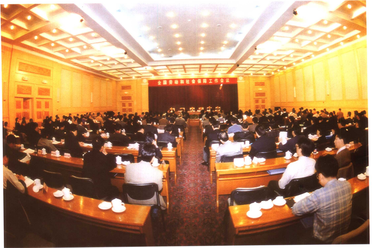
1999年1月13日至15日，全国劳动和社会保障工作会议在北京召开。图为会议场景。