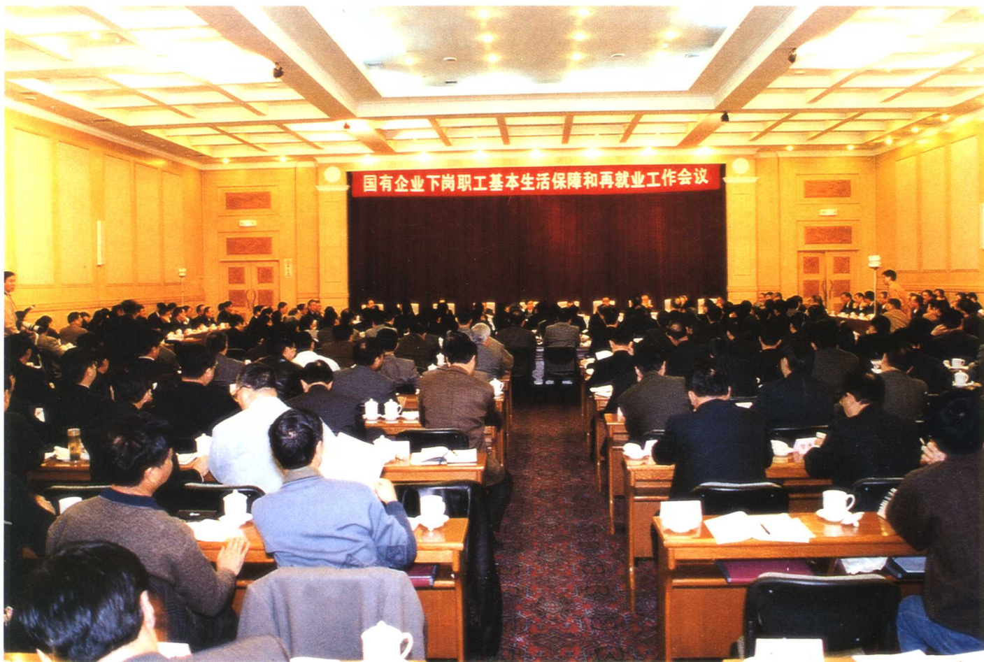
图为国务院在京召开的国有企业下岗职工基本生活保障和再就业工作会议场景。