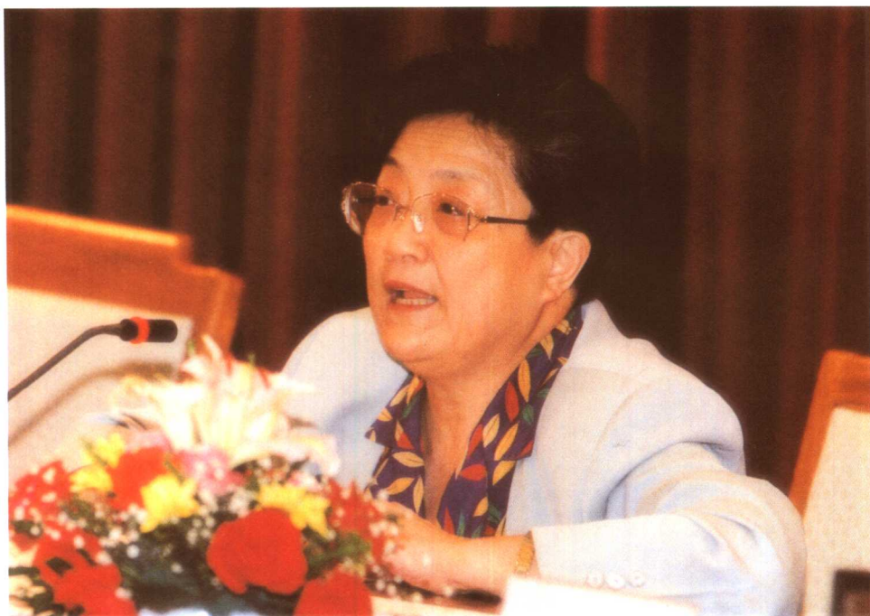
1999年5月24日，王建伦副部长在全国扩面征缴工作会议上讲话。