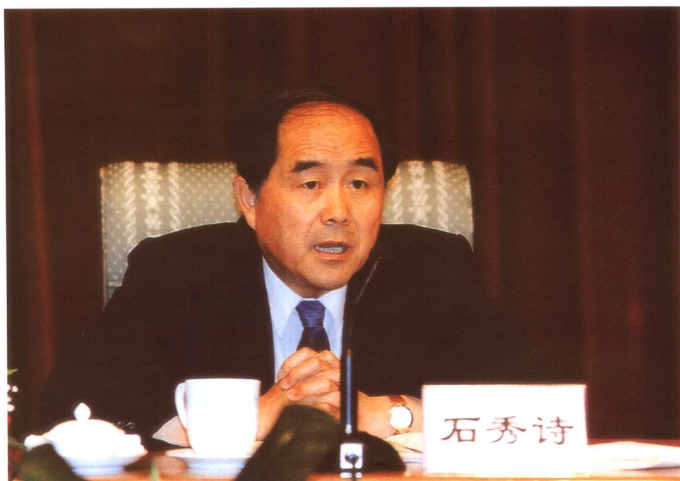
国务院副秘书长石秀诗主持会议并宣读了吴邦国副总理对会议的重要指示。