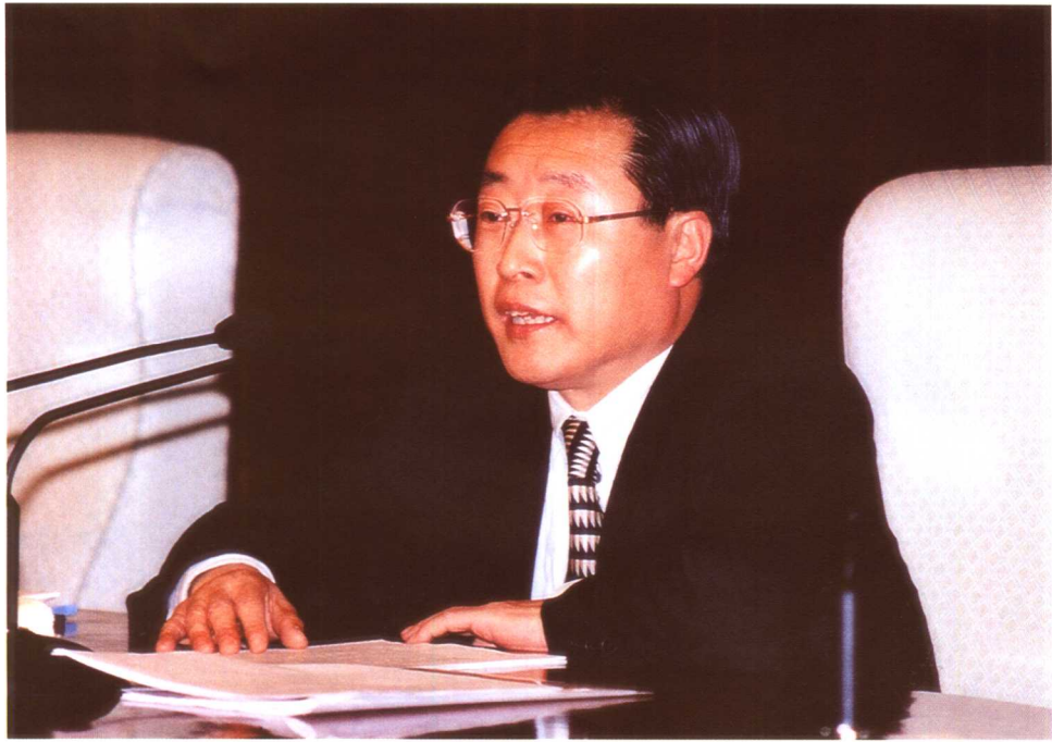
张左己部长在全国劳动和社会保障工作会议上作工作报告。