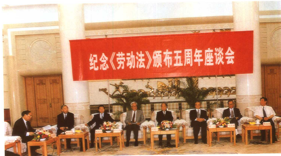
1999年7月5日，劳动保障部、国家经贸委、全国总工会在北京人民大会堂召开纪念《劳动法》颁布五周年座谈会。中共中央政治局常委、中央书记处书记、全国总工会主席尉健行出席座谈会并作重要讲话。