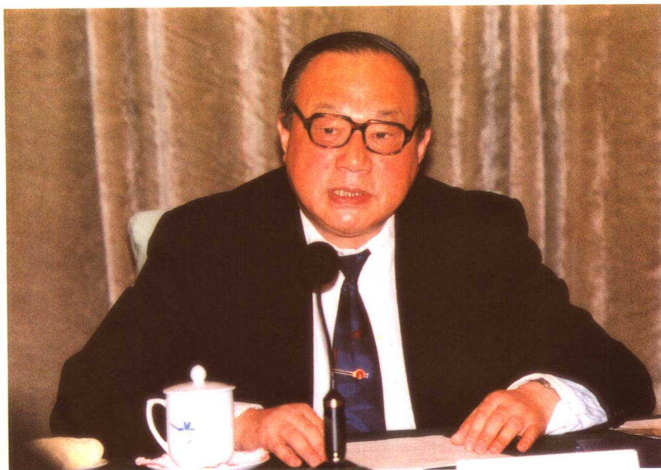
1999年10月11日，林用三副部长在劳动保障部、国家计委、民政部、中国残联共同召开的全国残疾人就业工作会议上讲话。