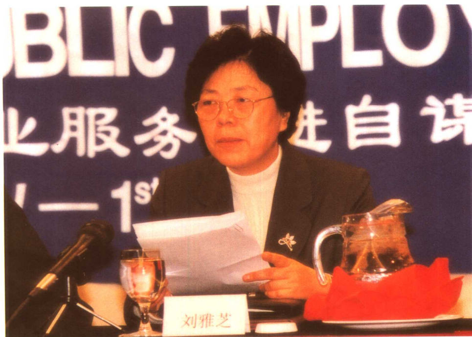
1999年11月29日，刘雅芝副部长出席公共就业服务促进自谋职业国际研讨会。