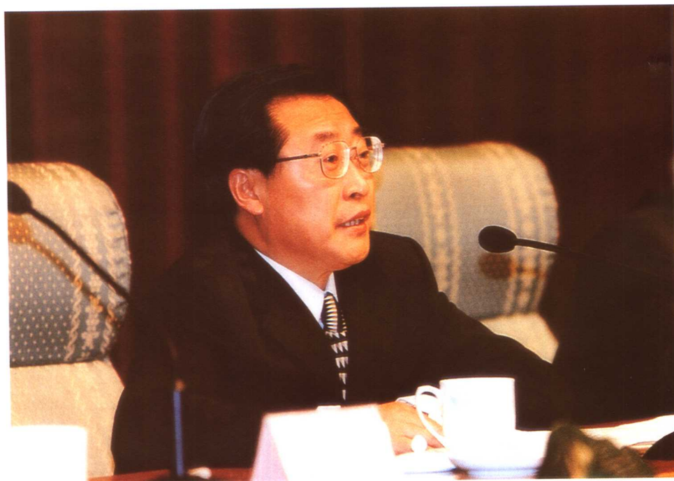
张左己部长在会上作题为《同心协力 知难而进 切实做好两个确保工作》的讲话。