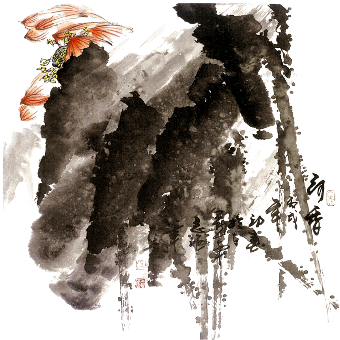
荷香 68cm × 68cm 水墨写意 2006年