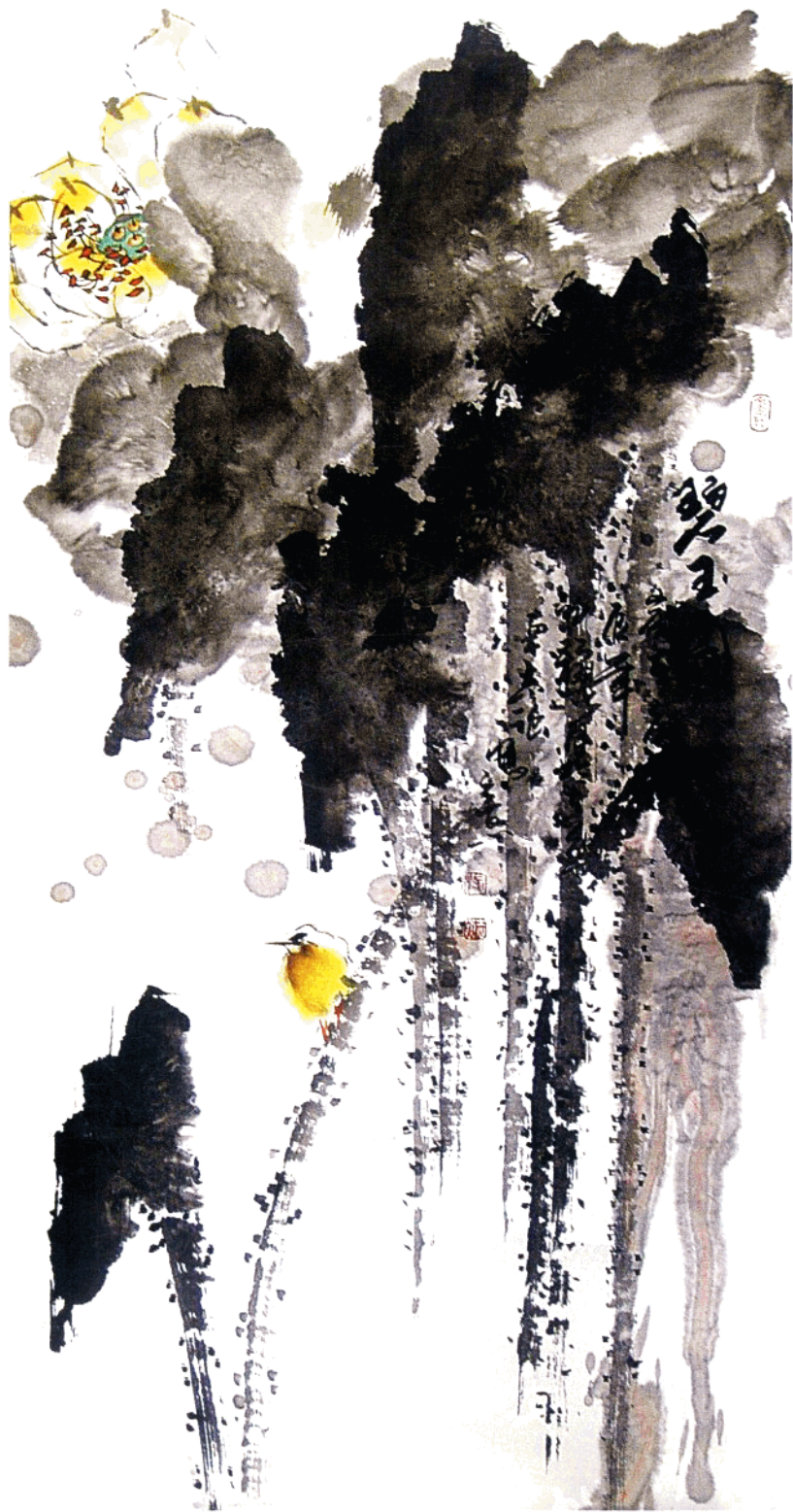
碧玉图 136cm X 68cm 水墨写意 二〇〇六年