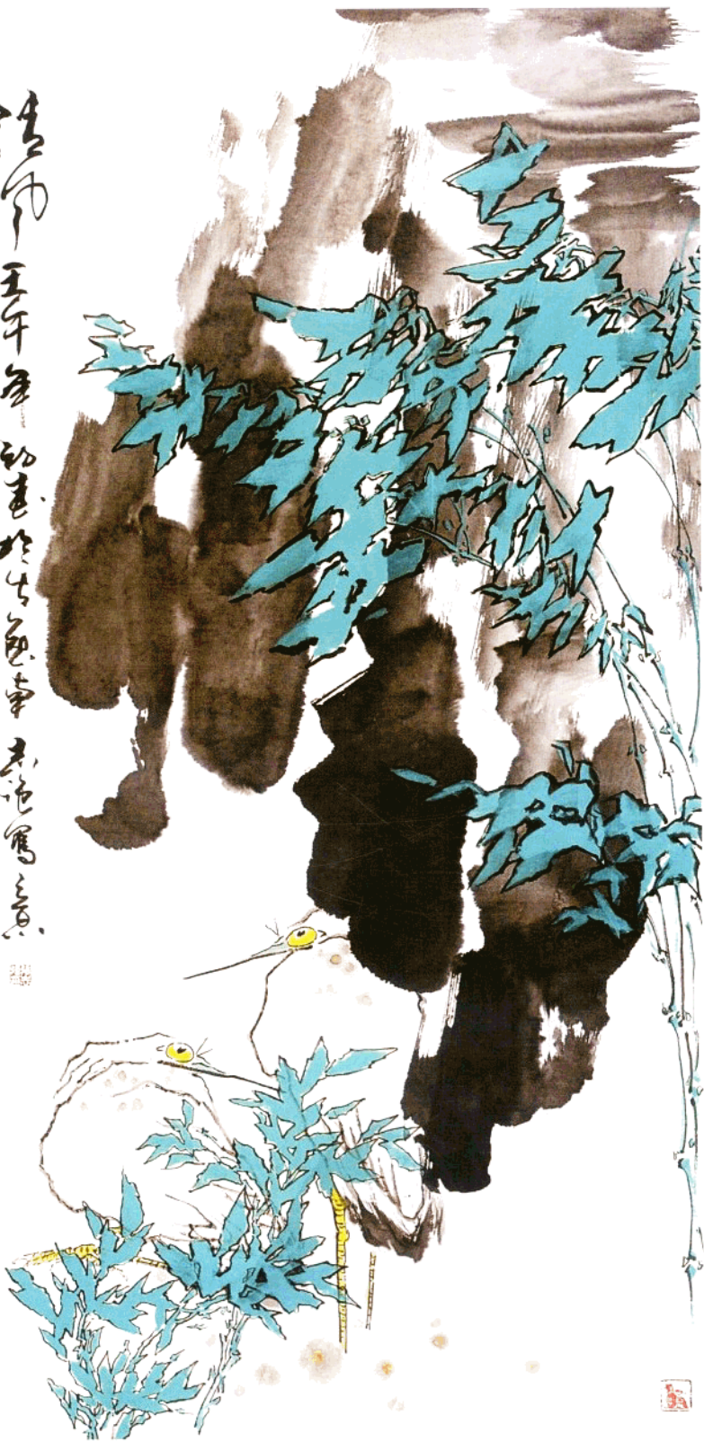
清風 136cm X 68cm 水墨写意 二〇〇二年