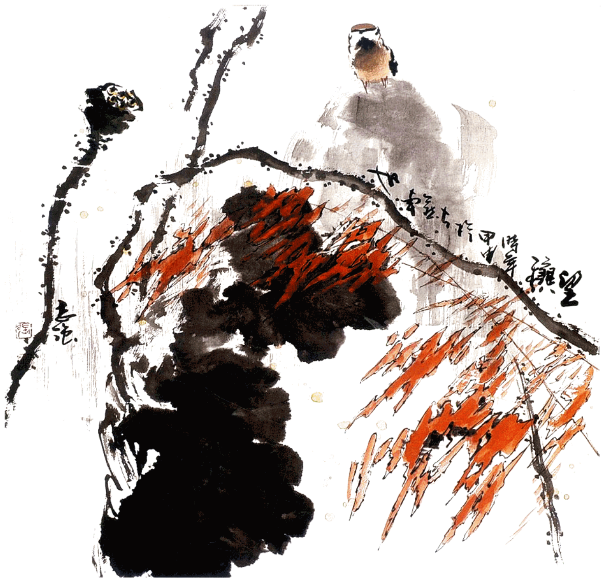
望秋 68cm x 68cm 水墨写意 2004年