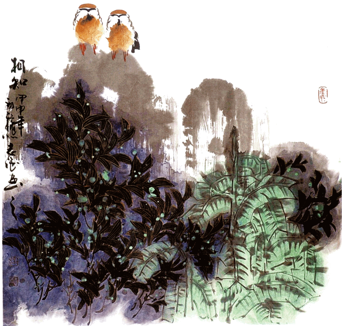
相知 68cm × 68cm 水墨写意 2004年