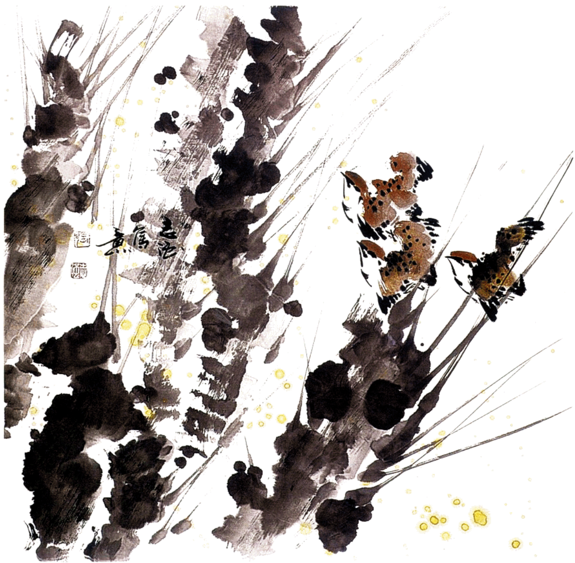
春光 68cm×68cm 水墨写意 2003年