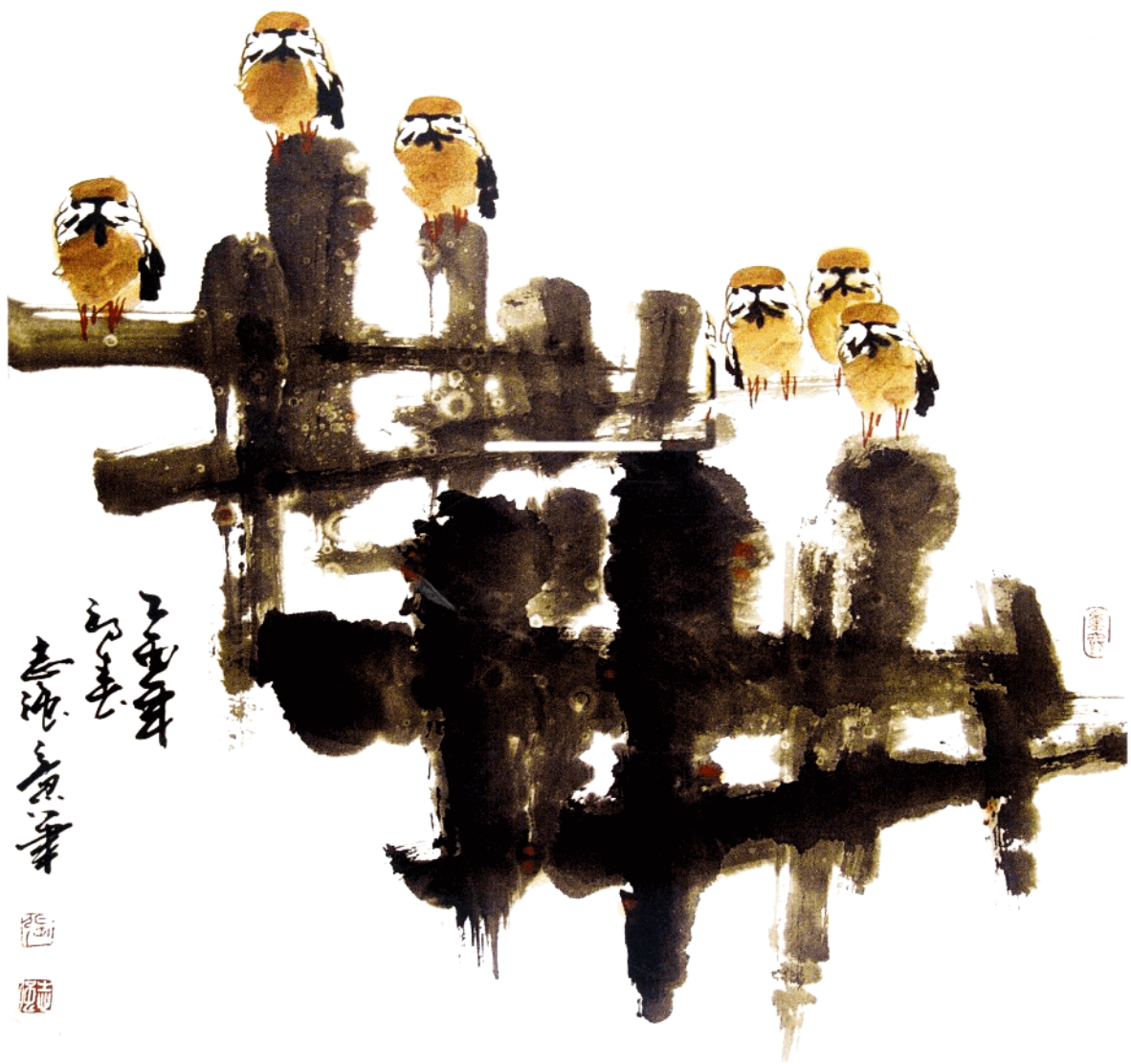
初春 68cm × 68cm 水墨写意 2005年