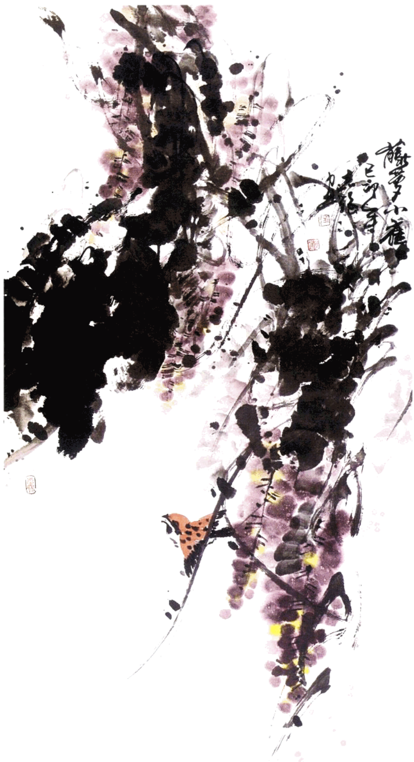
藤萝小雀 136cm X 68cm 水墨写意 一九九九年