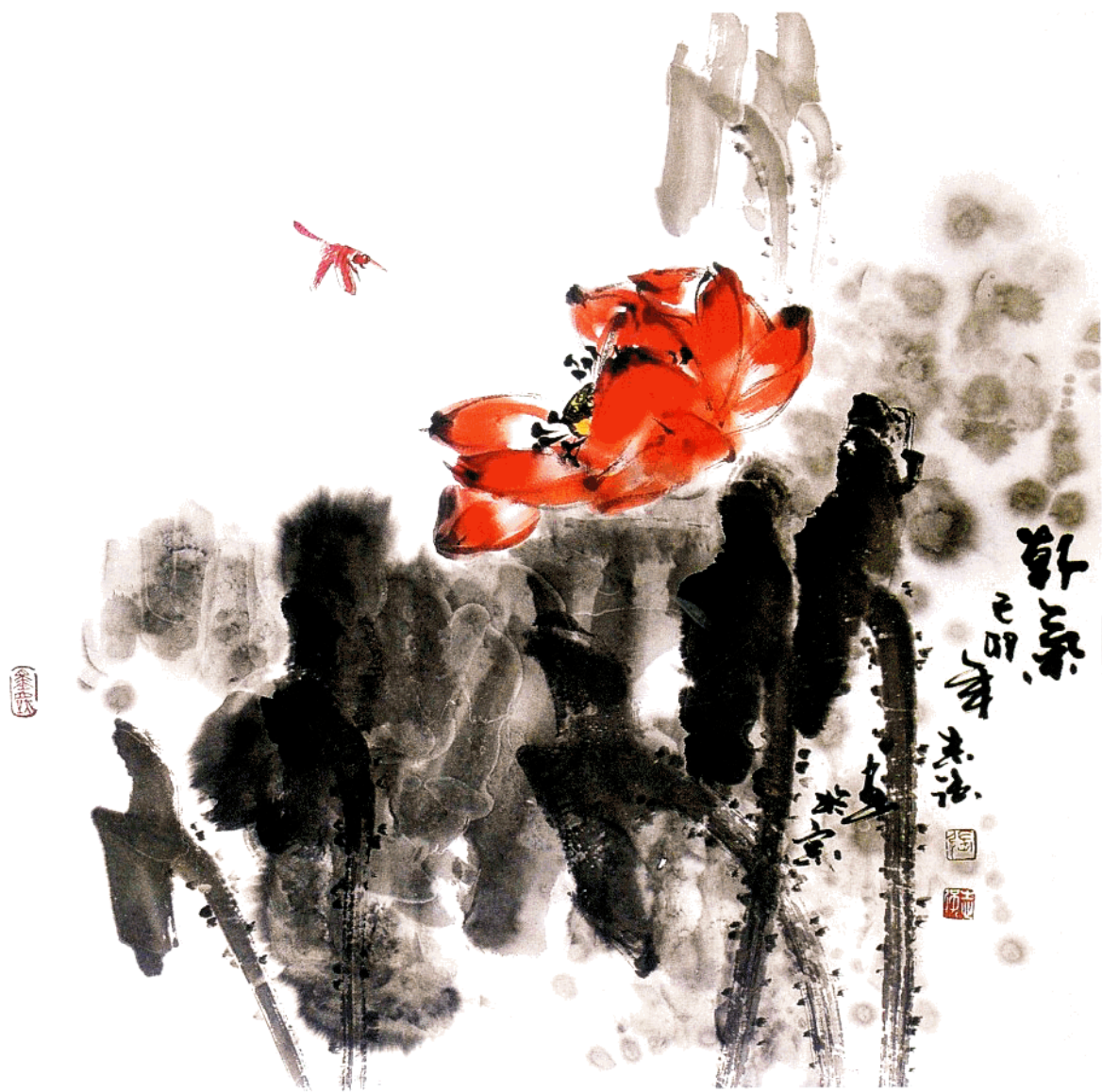
朝气 68cm × 68cm 水墨写意 1999年