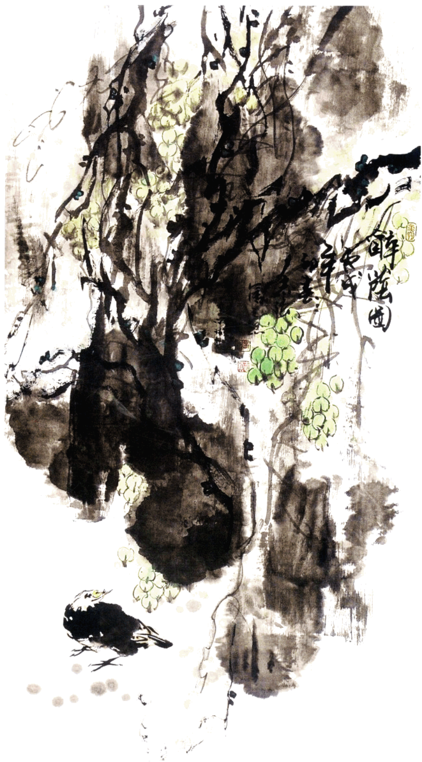
醉明图 136cm x 68cm 水墨写意 二〇〇六年