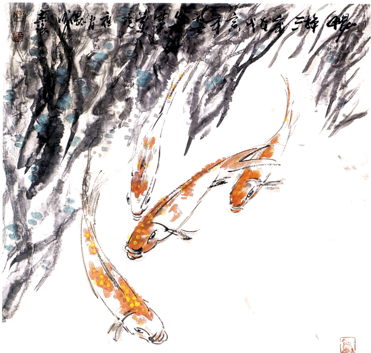
畅游 68cm x 68cm 水墨写意 1998年