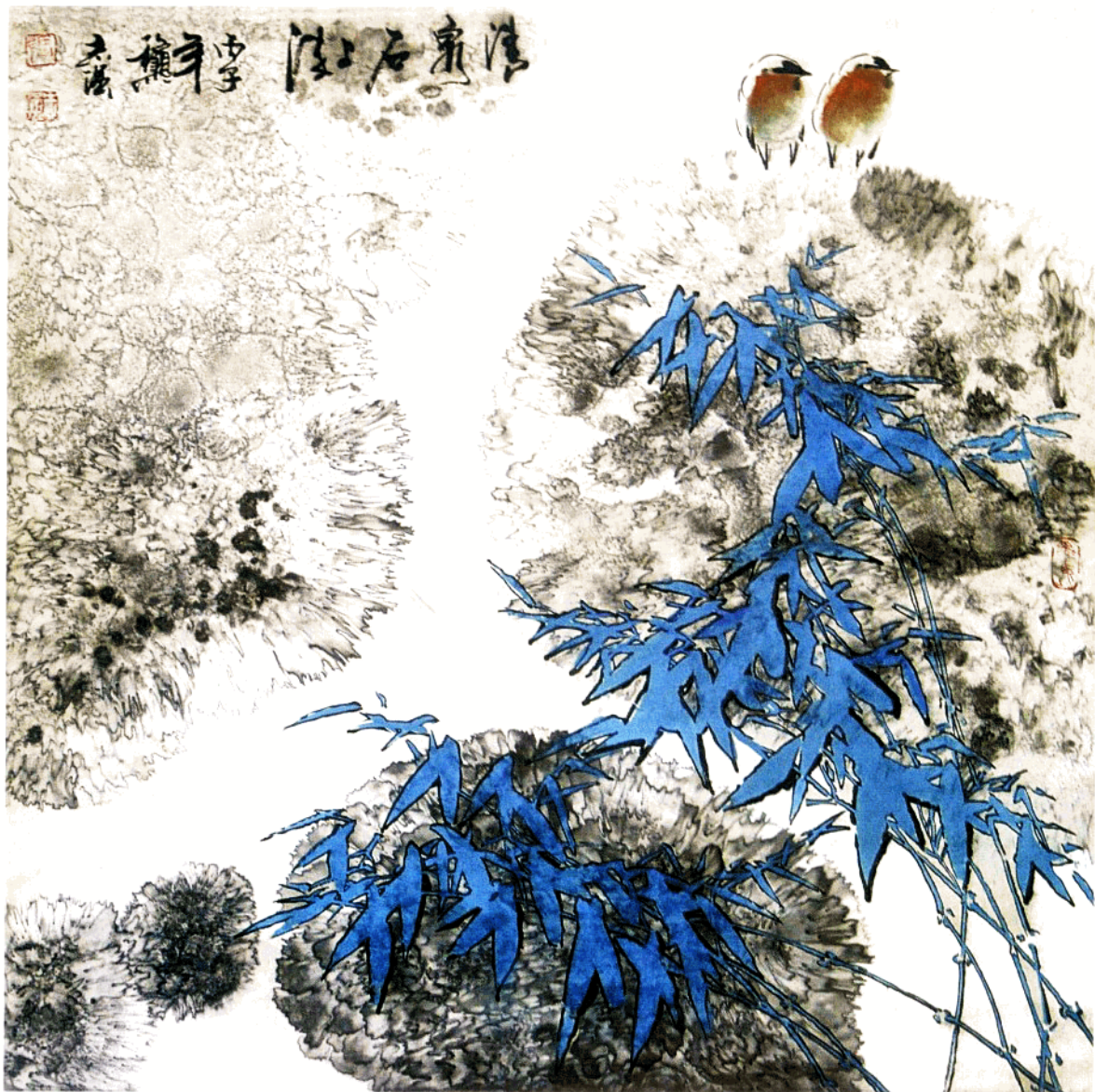
清泉石上流 68cm x 68cm 水墨写意 1996年