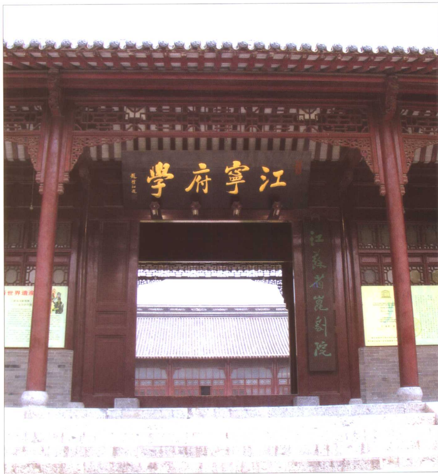
江苏省昆剧院址为清朝原“江宁府学”旧址，座落在南京朝天宫古建筑群落中。