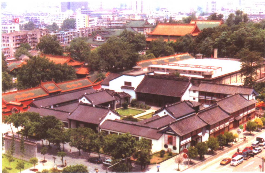
江苏省昆剧院大门，“江宁府学”匾额为赵朴初题，“江苏省昆剧院”为费新我题。