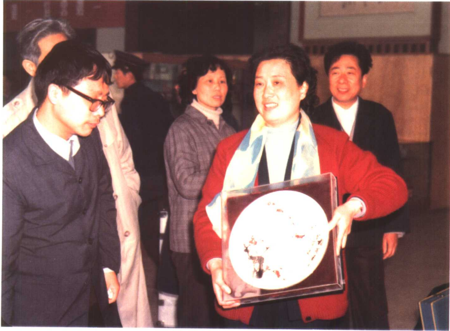
张继青获首届中国戏剧“梅花奖”。