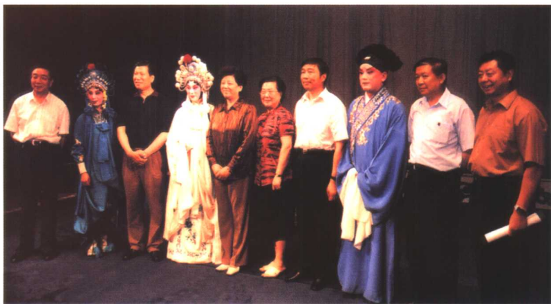
陈至立同志观看江苏省昆剧院的演出后，亲切接见演员们。