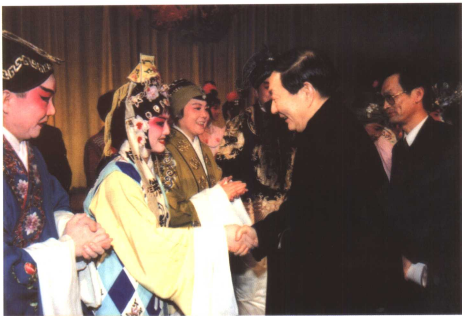
朱镕基、潘震宙同志观看江苏省昆剧院的演出后，亲切接见演员们。