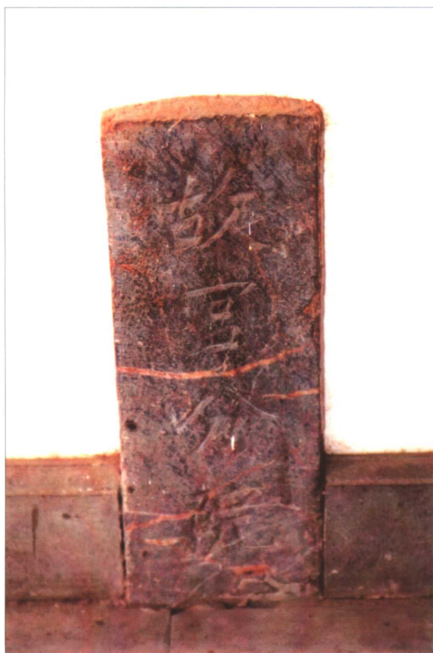
江苏省昆剧院旧址维修改造时，从院内出土的“故宫分院”石刻。