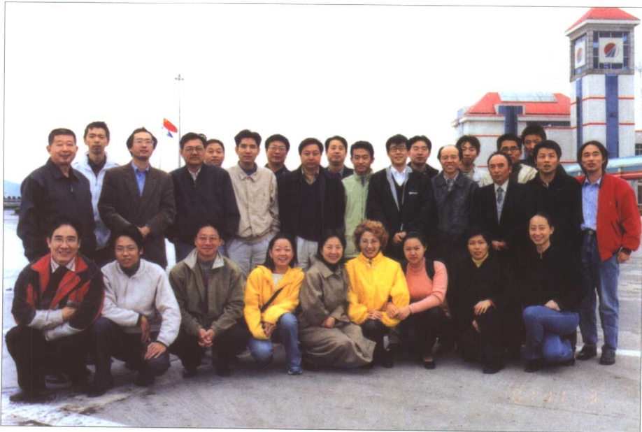
江苏省昆剧院乐队合影。