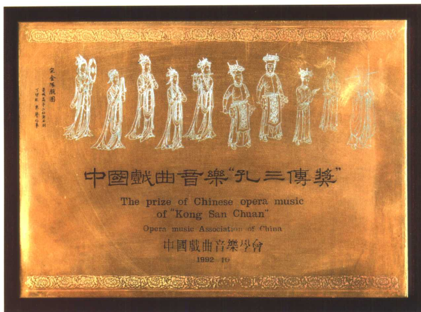
1992年10月江苏省昆剧院获“中国戏曲音乐‘孔三传奖’”牌。