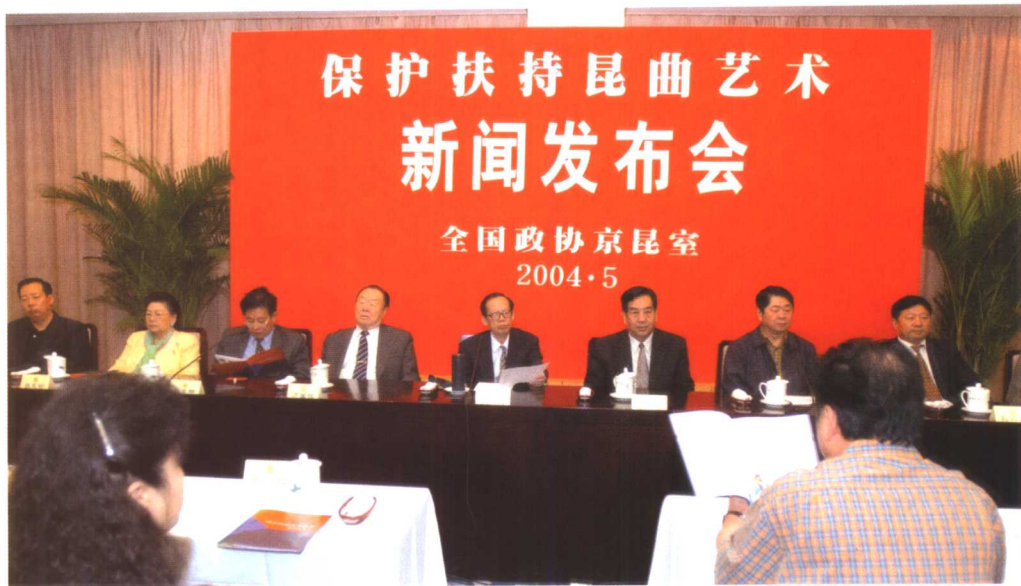
“保护扶持昆曲艺术”新闻发布会 2004年5月12日由王选在全国政协会议中心主持。