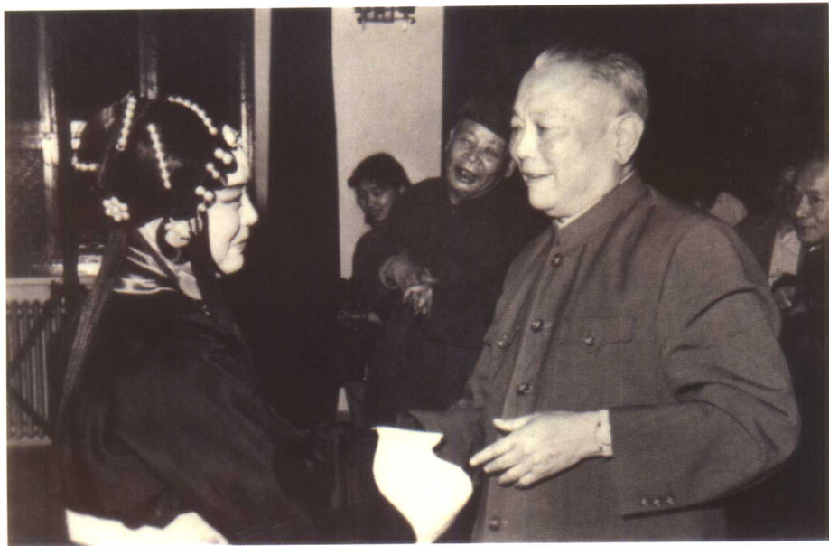
李先念同志观看江苏省昆剧院的演出后，亲切接见演员们。