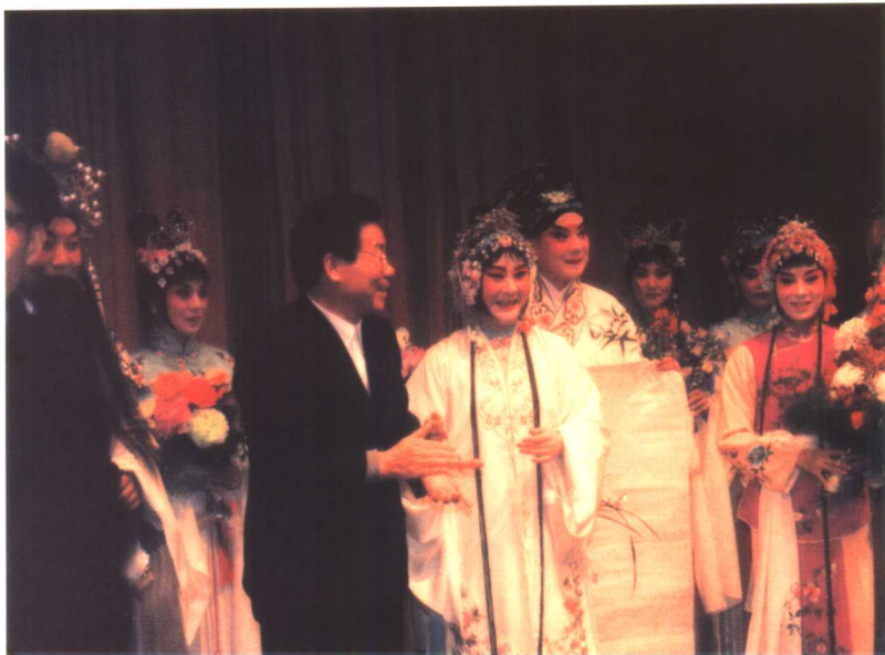
李瑞环同志观看江苏省昆剧院的演出后，亲切接见演员们。