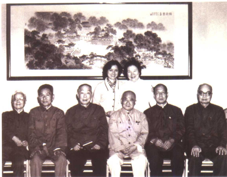
1982年“南昆汇演”期间的合影。前排左起为郑山尊、周传瑛、俞振飞、沈传芷、吴雪、匡亚明。后排起为李蔷华、石小梅。