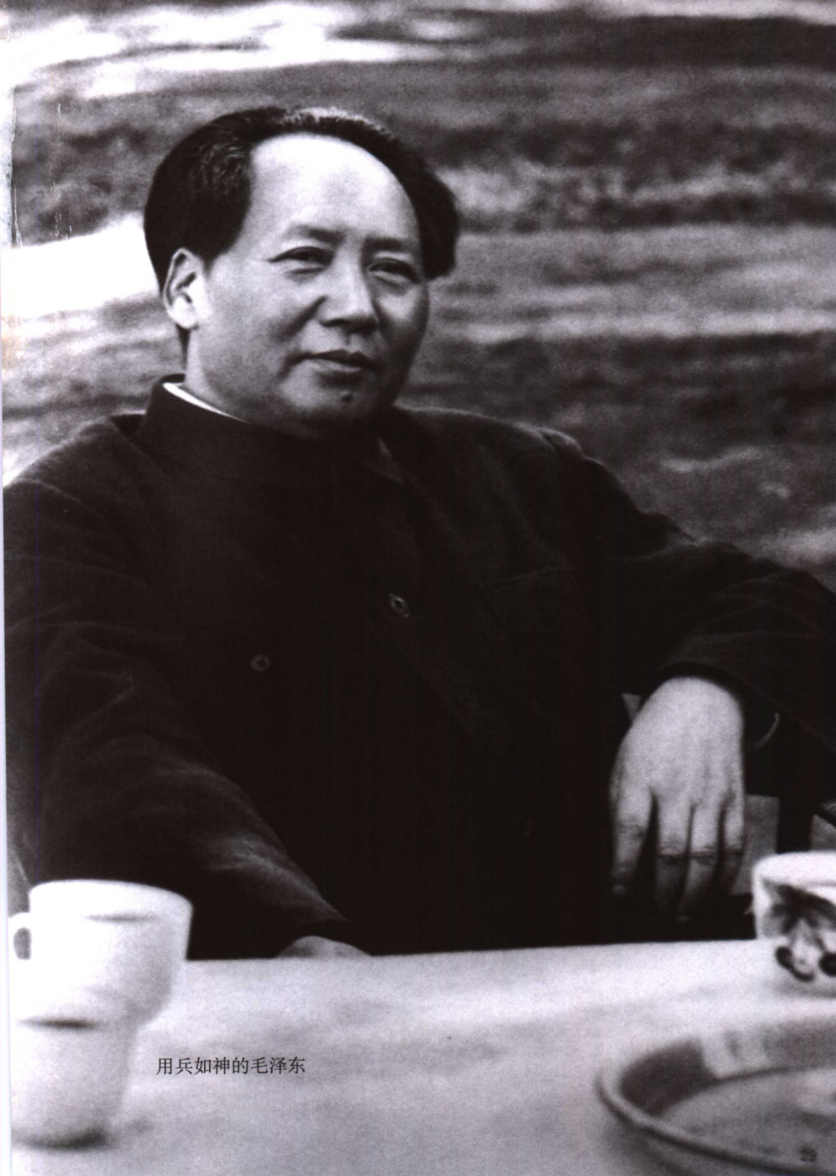
用兵如神的毛泽东