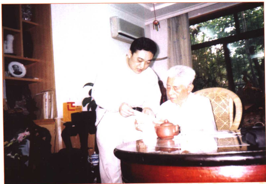
作者向张铨秀将军请教修改书稿的意见