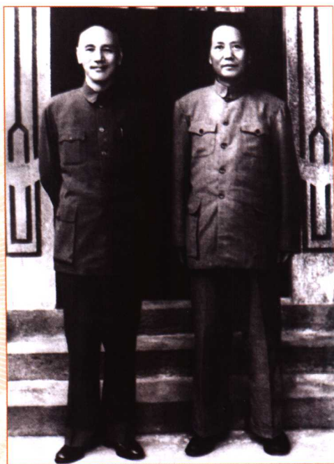
1945年,毛泽东与蒋介石