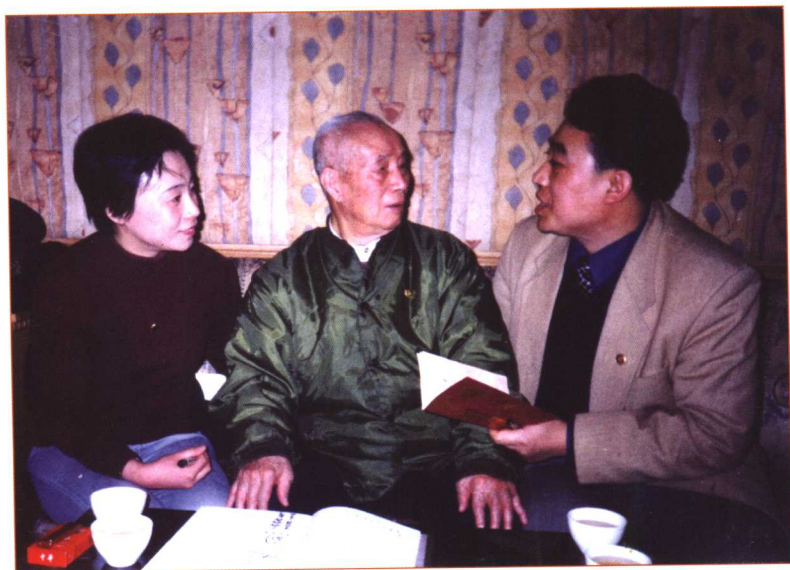
作者与原中国人民解放军二炮司令员吴烈（左二）、记者刘丽杰（左一）亲切交谈