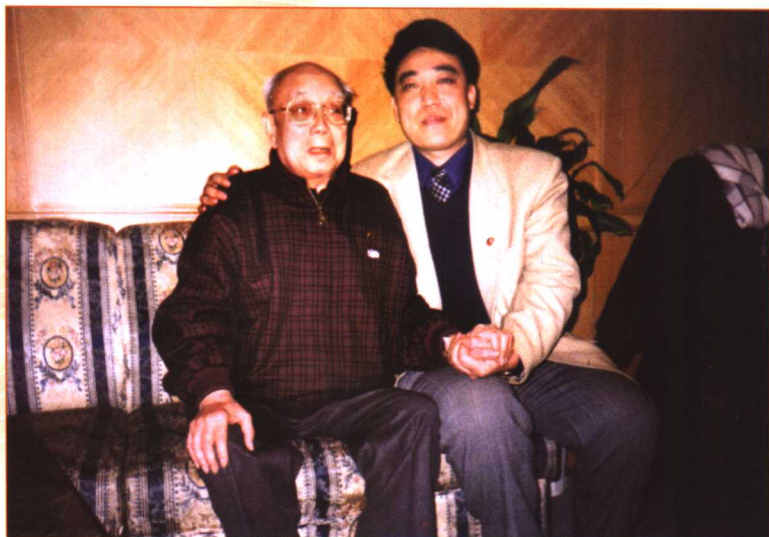
作者与原毛泽东的秘书叶子龙在北京