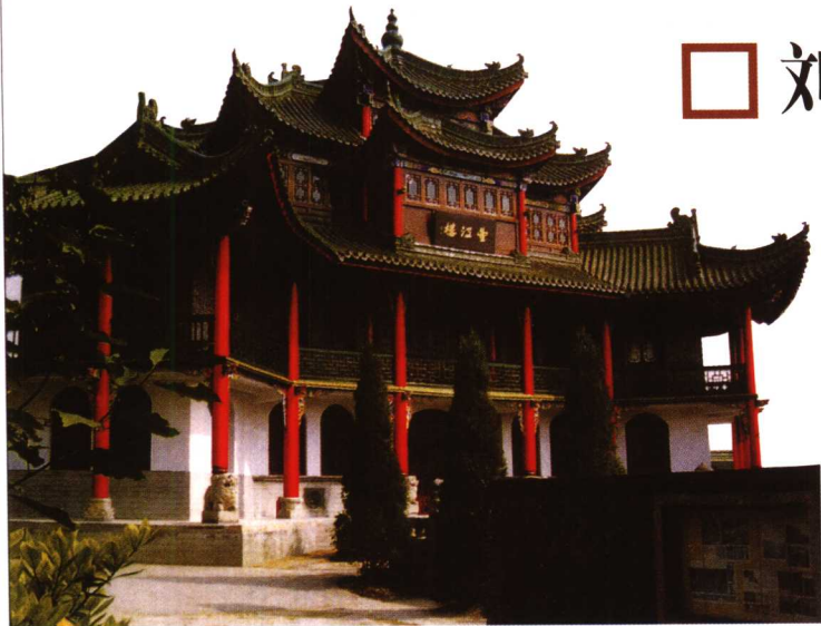
汉中望江楼 汉中位于陕西省，是历史文化名城，汉代刘邦等人曾在此建功立业。

汉王五年正月，被分别立为楚王和梁王的韩信、彭越等诸王上疏，共尊刘邦为皇帝。二月初三，刘邦正式称帝，国号为汉，定都洛阳。吕氏雉为皇后，子刘盈为皇太子。刘邦称帝后，在洛阳南宫举行盛大庆功宴会。会上，刘邦让群臣畅谈汉胜楚败的经验教训。当时高起、王陵等认为刘邦能“与天下同利”，而项羽却“不予人利”，故而失败。盛宴后不久，刘邦采纳娄敬和张良的主张，迁都长安，开始了西汉王朝四百余年的兴衰史。