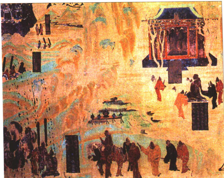
张骞出使西域壁画

张 骞，汉中成固人。汉武帝建元三年奉命出使西域，联络大月氏，夹击匈奴。途中被匈奴截获，拘禁十一年后逃脱继续西行，越葱岭，经大宛、康居，抵大月氏。由于大月氏西迁后定居于此，已无意报复匈奴，所以张骞留大月氏一年多后回返。但途中又被匈奴扣留一年多，于元朔三年才回到长安。后来随卫青击匈奴，被封为博望侯。元狩四年又奉命出使乌孙国。到乌孙后又派副使往大宛、康居、大月氏、安息、身毒等地。元鼎二年张骞与乌孙使者还汉。张骞两次出使西域，是汉人第一次到达中亚各国，打通了汉朝直接通往中亚的道路，史称“凿空”。后来这条经由中亚直通西方欧洲的陆上交通道路就被称为“丝绸之路”。张骞两次出使西域，促进了汉朝和中亚各国的直接联系。从此双方使者往来不断，中国和西方的经济文化交流进入了一个新时期。