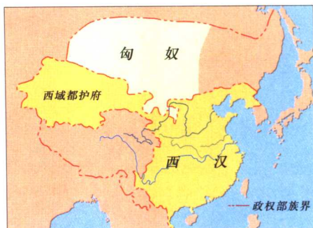
西域都护府位置图