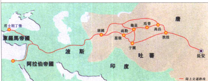
丝路沿线主要国家位置图