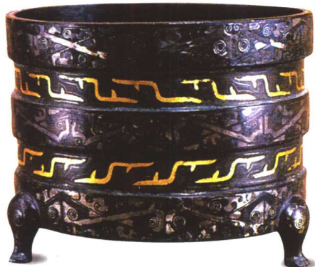
镶嵌云纹铜尊 汉代贵族妇女用来盛梳妆品的容器。