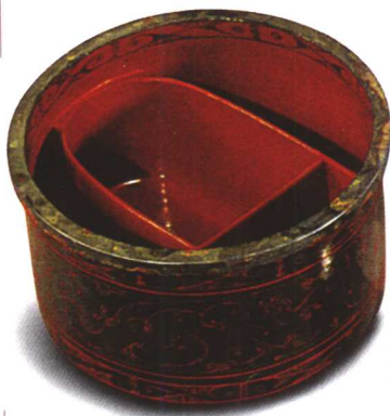
彩绘梳篦漆盒 汉代贵族妇女使用的梳妆盒。