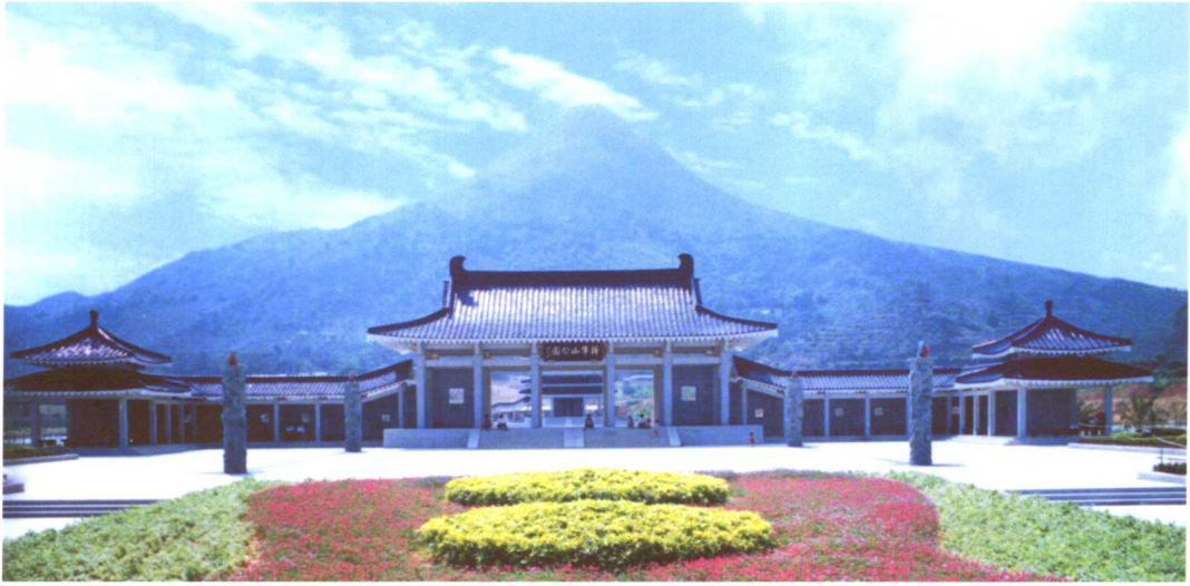
将军山公园东大门全景