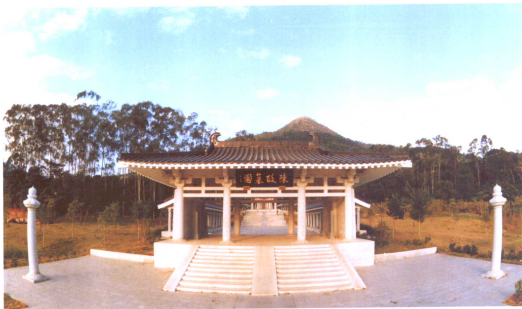
原中共中央政治局委员、中央军委副主席、国务委员兼国防部长迟浩田上将为将军山公园历史文化区陈政墓园题匾