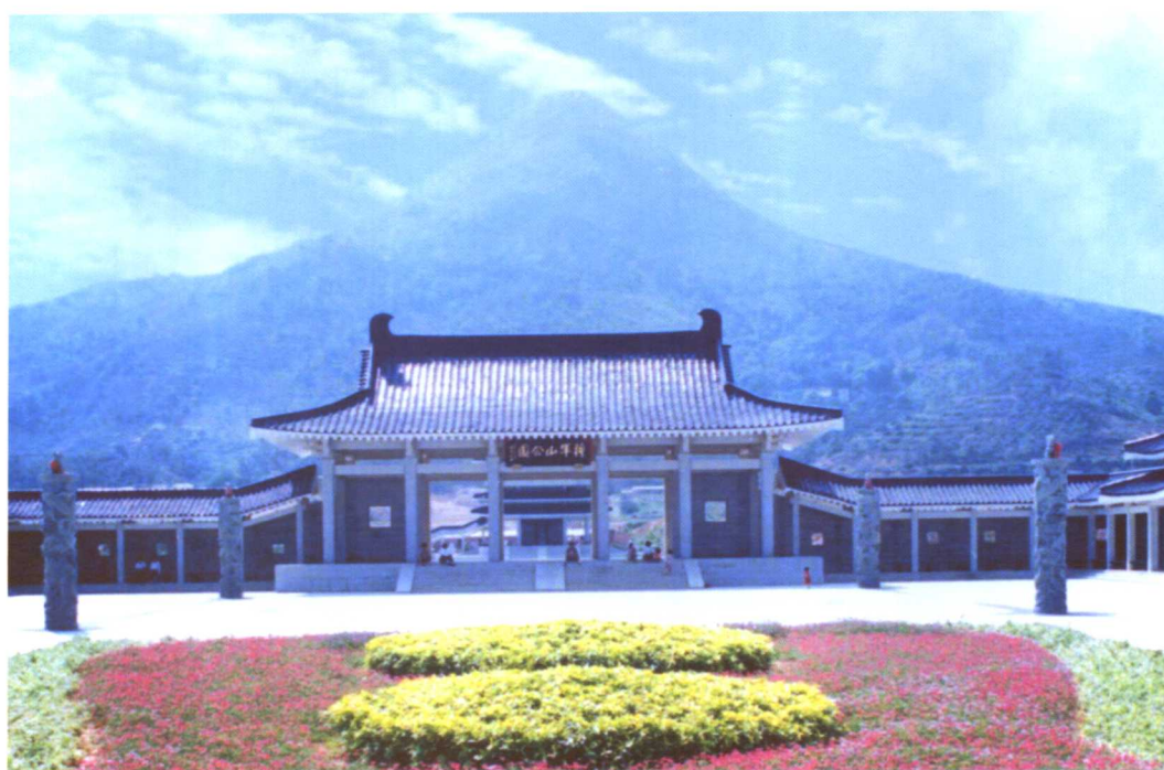
原中共中央政治局常委、中央军委副主席刘华清上将为将军山公园题匾