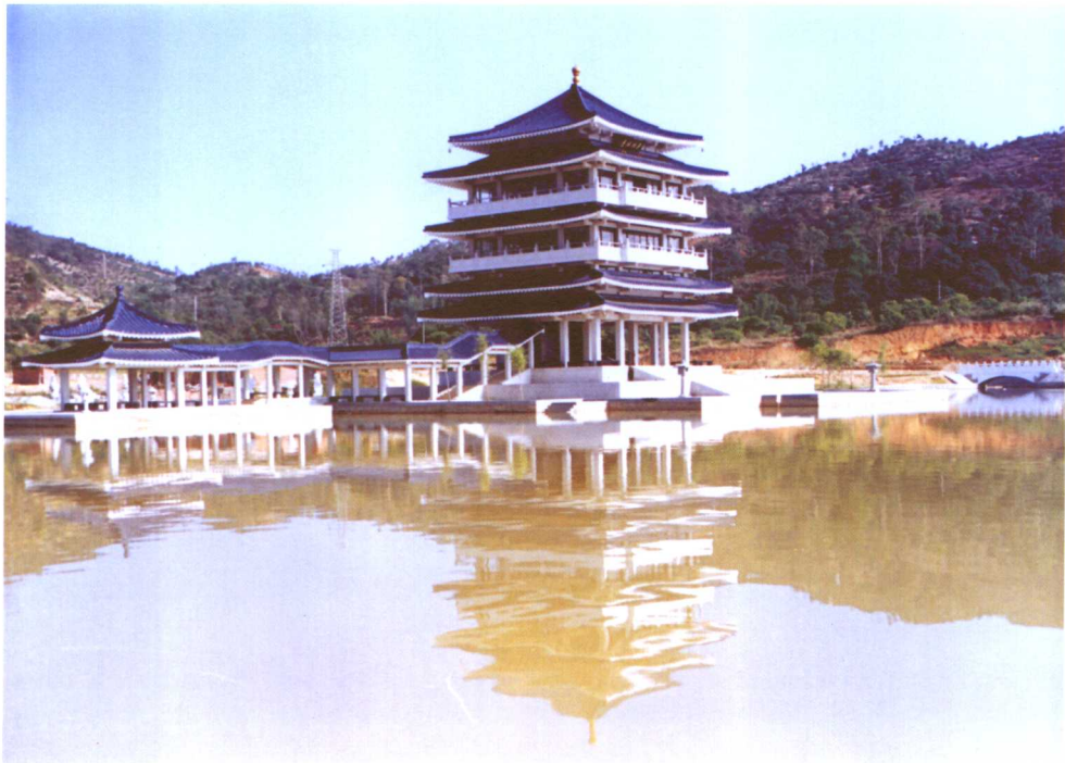
将军山公园归德楼全景