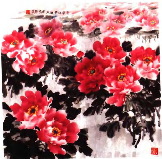
牡丹组画之五：菏泽牡丹蘸水开 68cm × 68cm 2005年