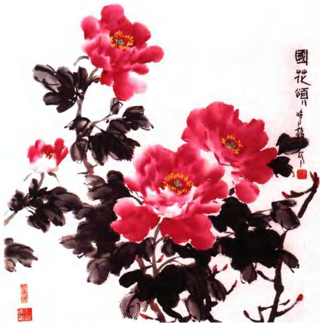
牡丹组画之一：国色天香