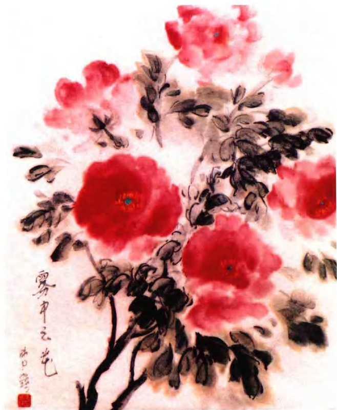
牡丹组画之七：雾中之花朦胧美 68cm × 60cm 2004年