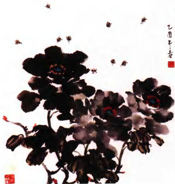
牡丹组画之三：芳菲满人间