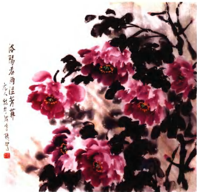
牡丹组画之四：洛阳春雨湿芳菲 68cm × 68cm 2005年