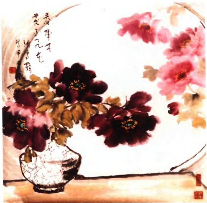
牡丹组画之二：春城无处不飞花