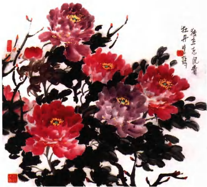
牡丹组画之六：独立东风看牡丹