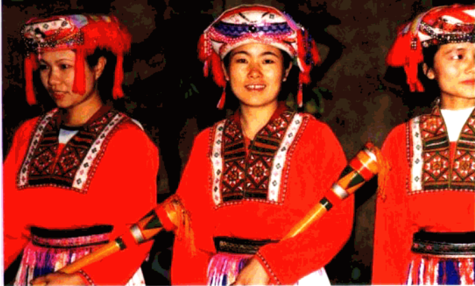
上:能歌善舞的瑶家妹子 下:阿哥嗓子洪亮

的。日本、越南的瑶族，与我国盘瑶的语言、风俗也是相通的。这在民族地理学方面，确是非常有意思的。